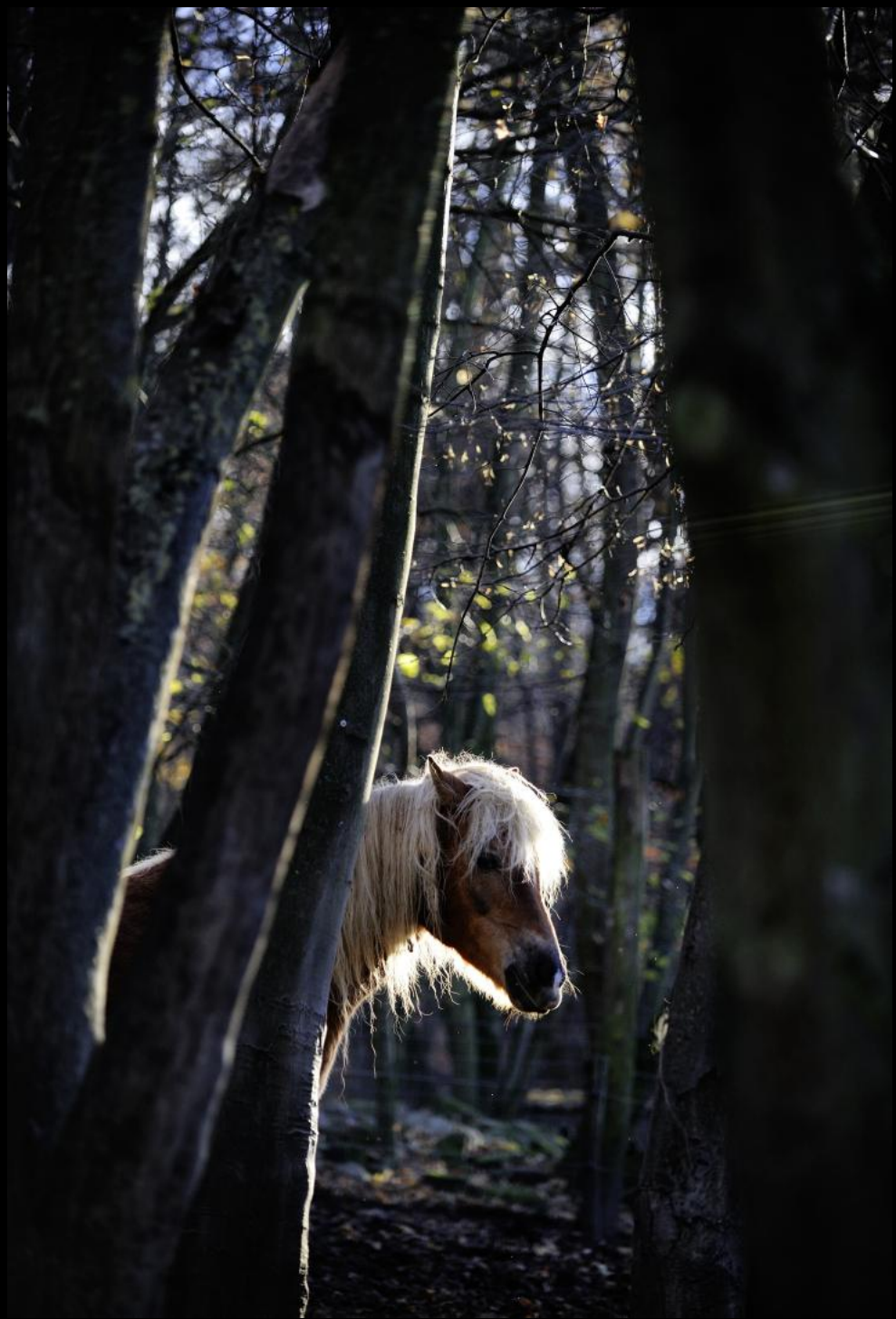
Haflinger in der Wüste von Mannersdorf.