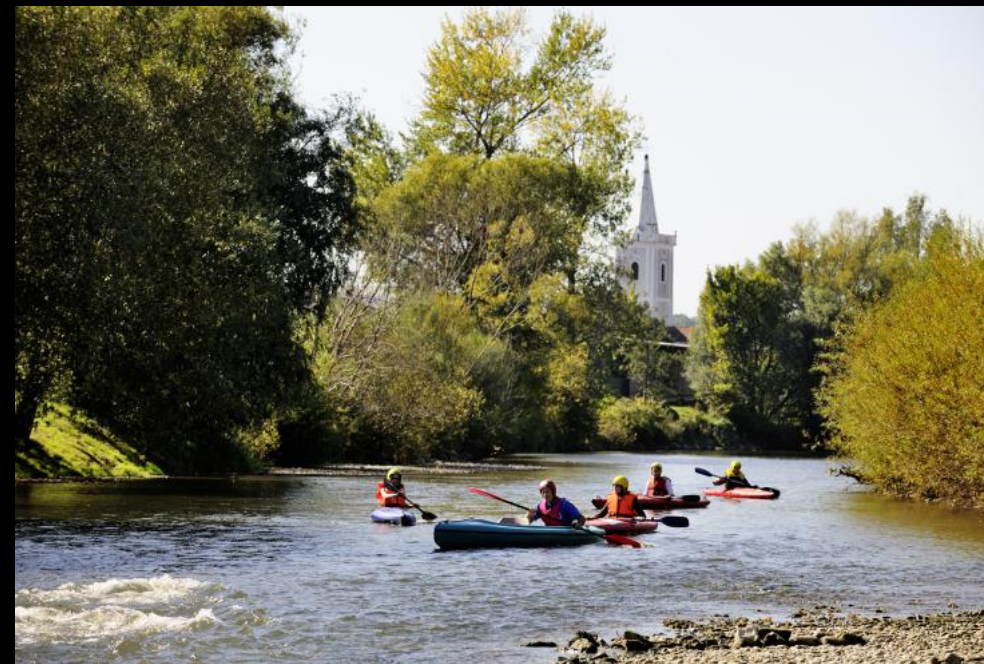
Kajakfahrer auf der Leitha passieren Leithaprodersdorf.