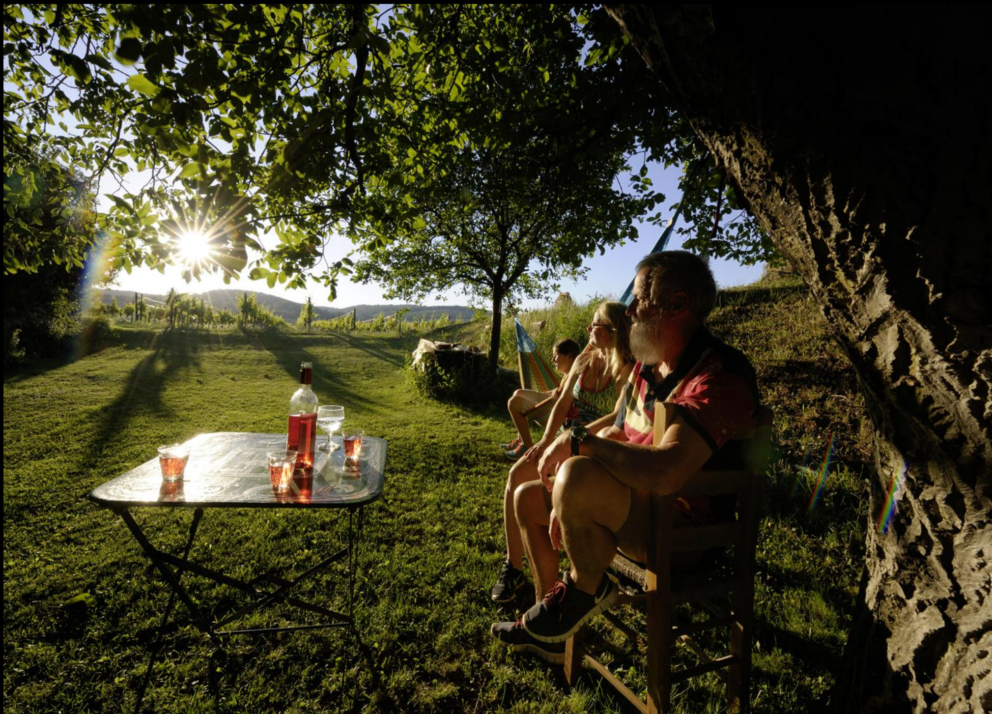
Sonnenanbeter in ihrem Garten hinter dem Weinkeller in Breitenbrunn.