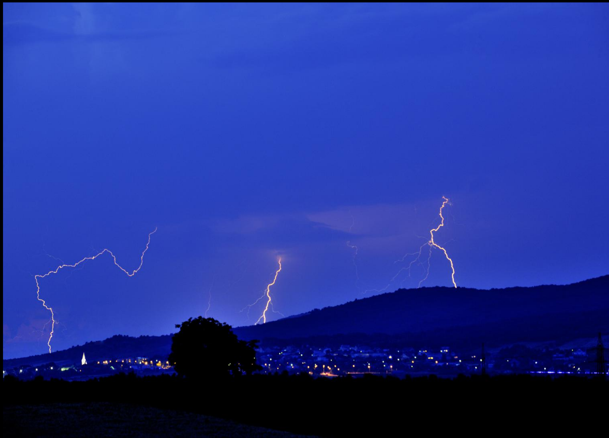
Blitze über Wimpassing.