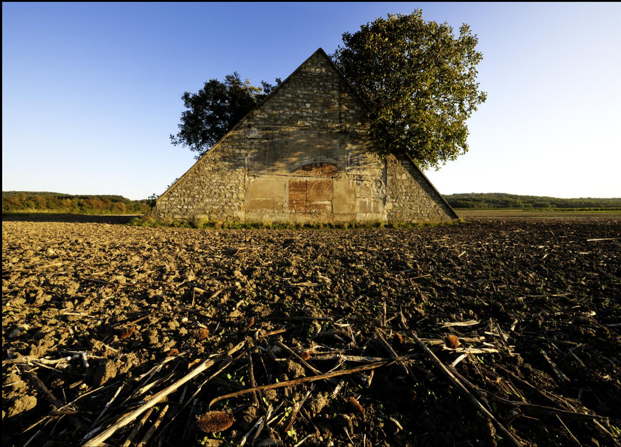
Wehranlage aus dem 2. Weltkrieg in einem abgeernteten Maisfeld.