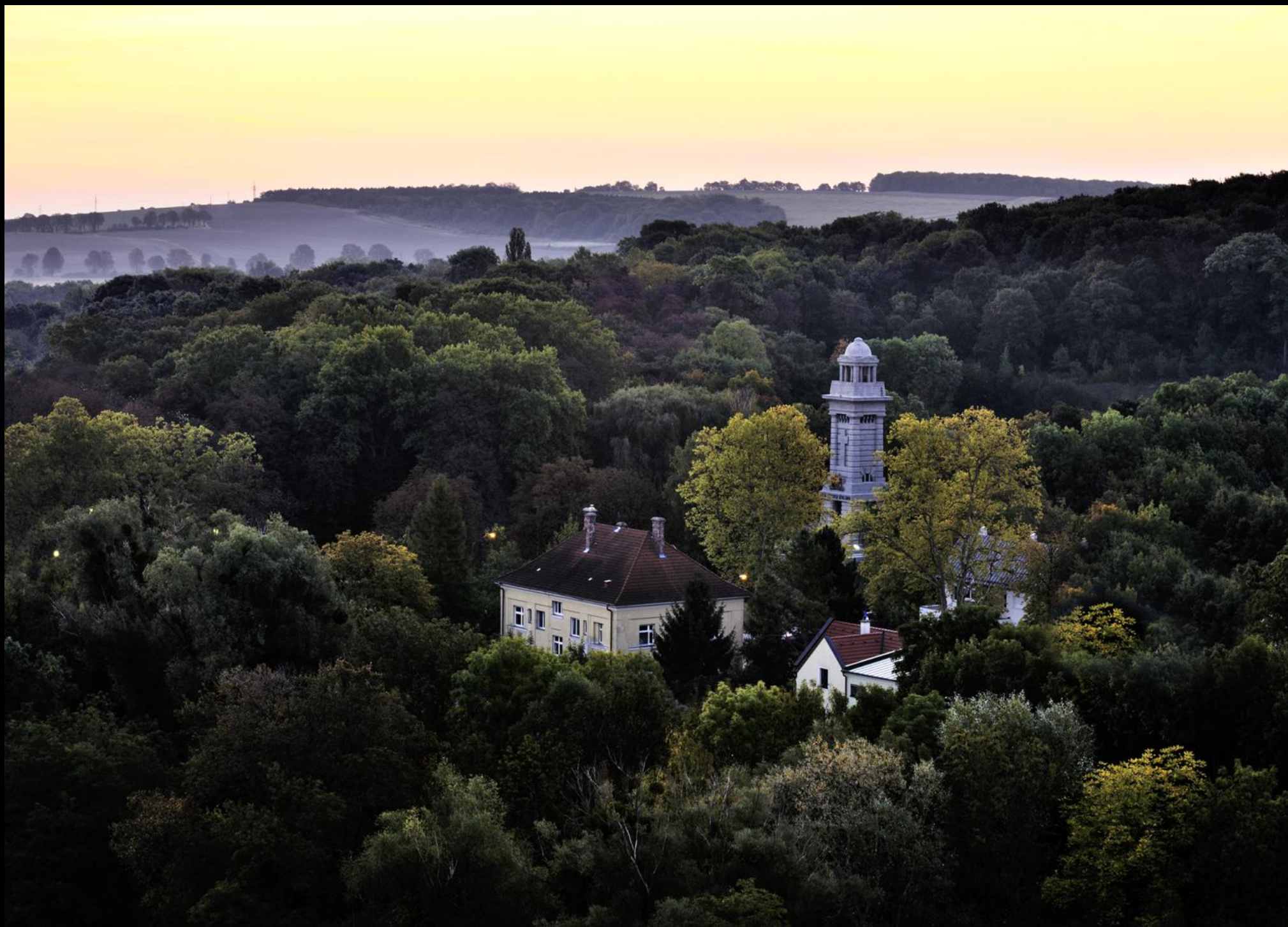
Kriegerdenkmal aus dem 1. Weltkrieg in der Leithau von Bruckneudorf.