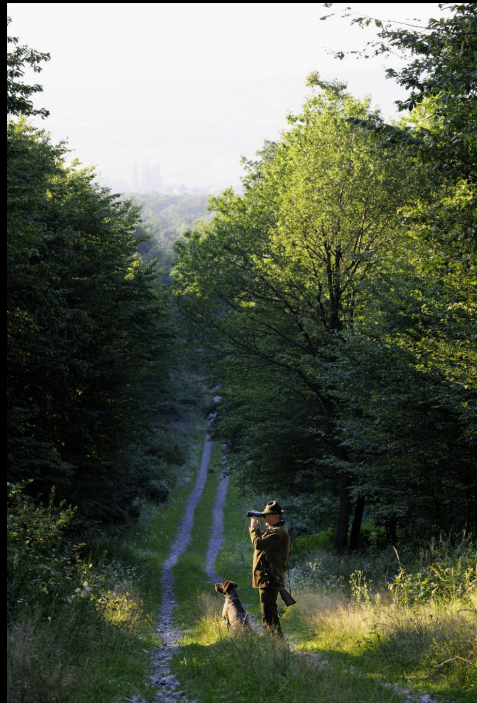
Jäger und Hund an einer Waldlichtung bei der Saugrabenwiese.