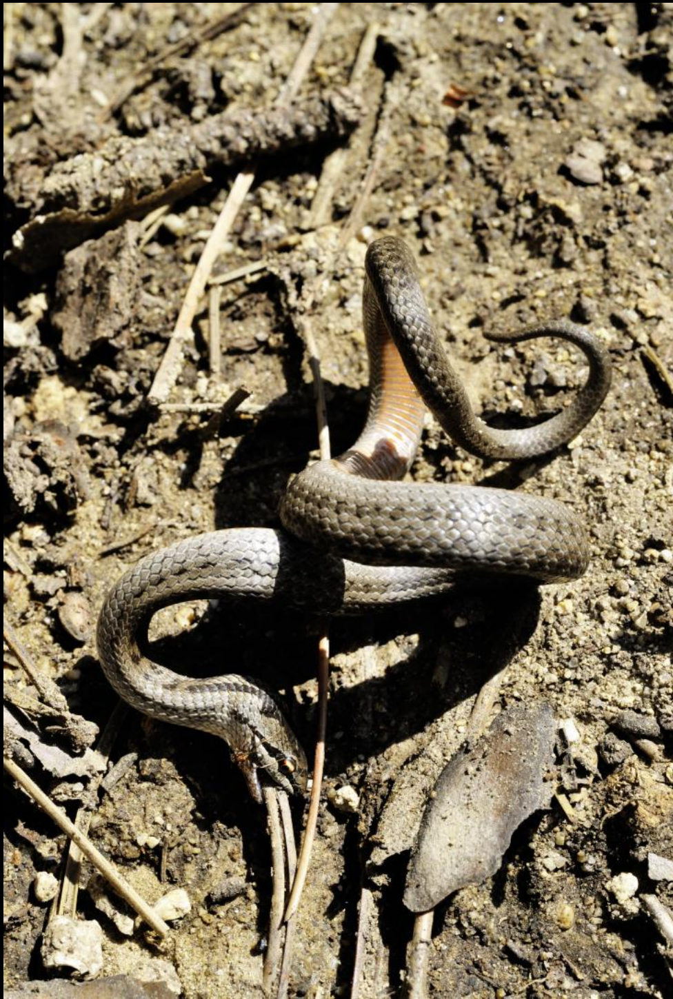
Ringelnatter beißt in eine Föhrennadel