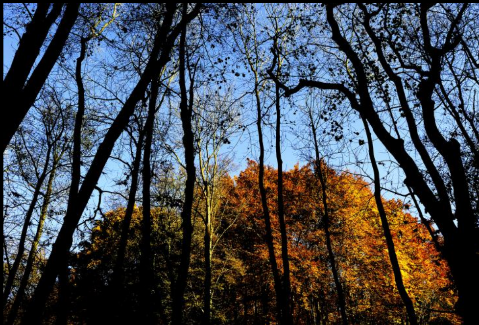
Herbstwald in der Wüste von Mannersdorf.