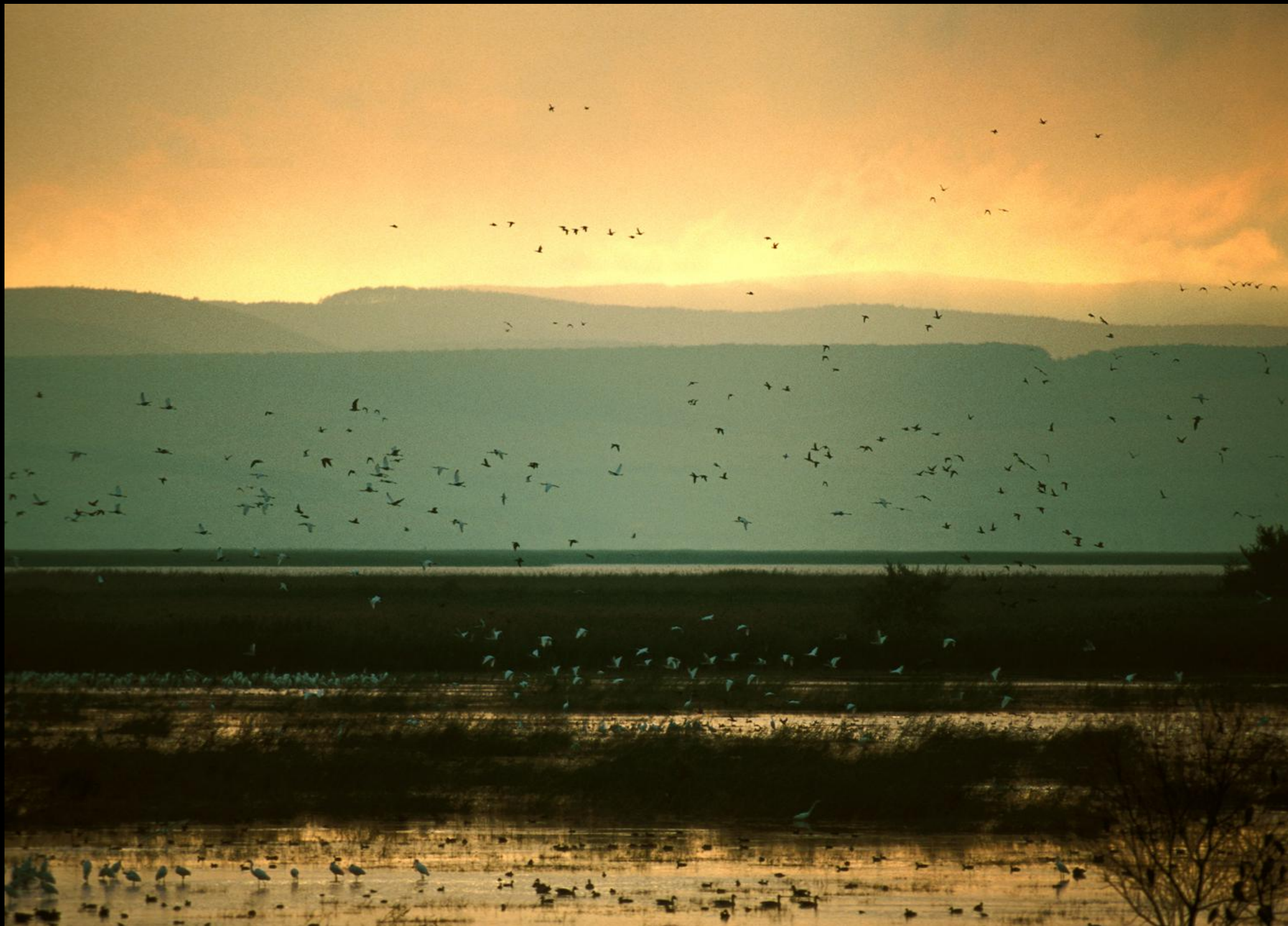
Entfernter Blick auf das Leithagebirge. Blick von der Mexikopuszta im ungarischen Seewinkel. Im Herbst versammeln sich hier die Zugvögel zum gemeinsamen Abflug in den Süden.