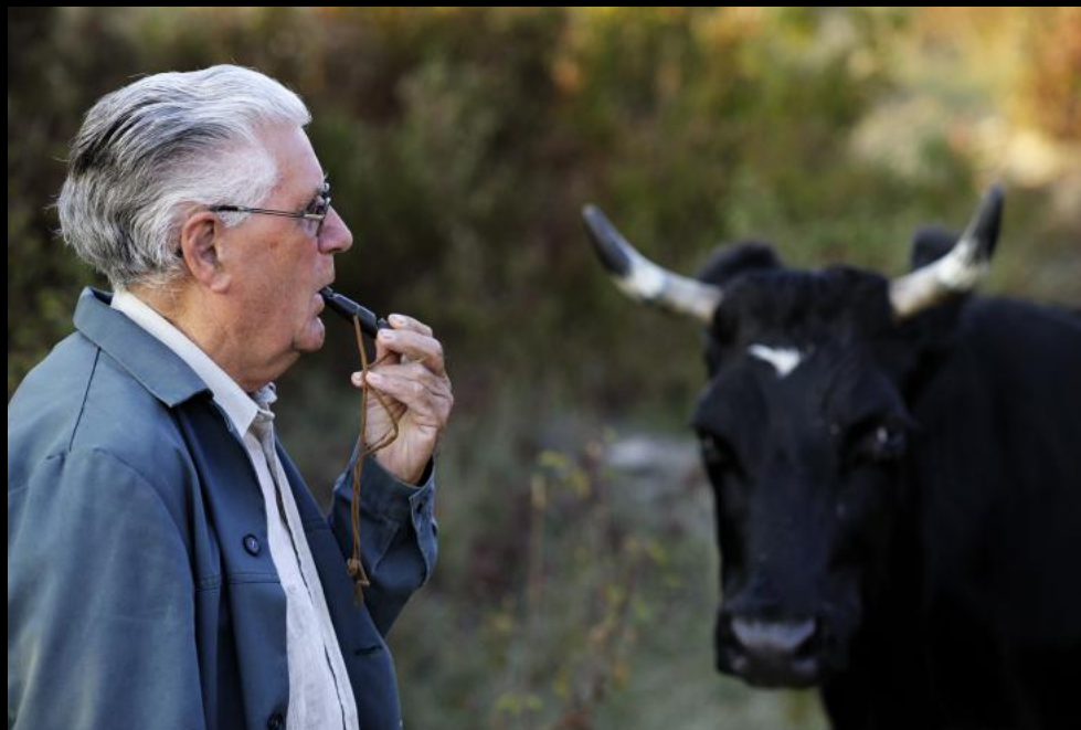
Rinderbauer mit Signalpfeife.