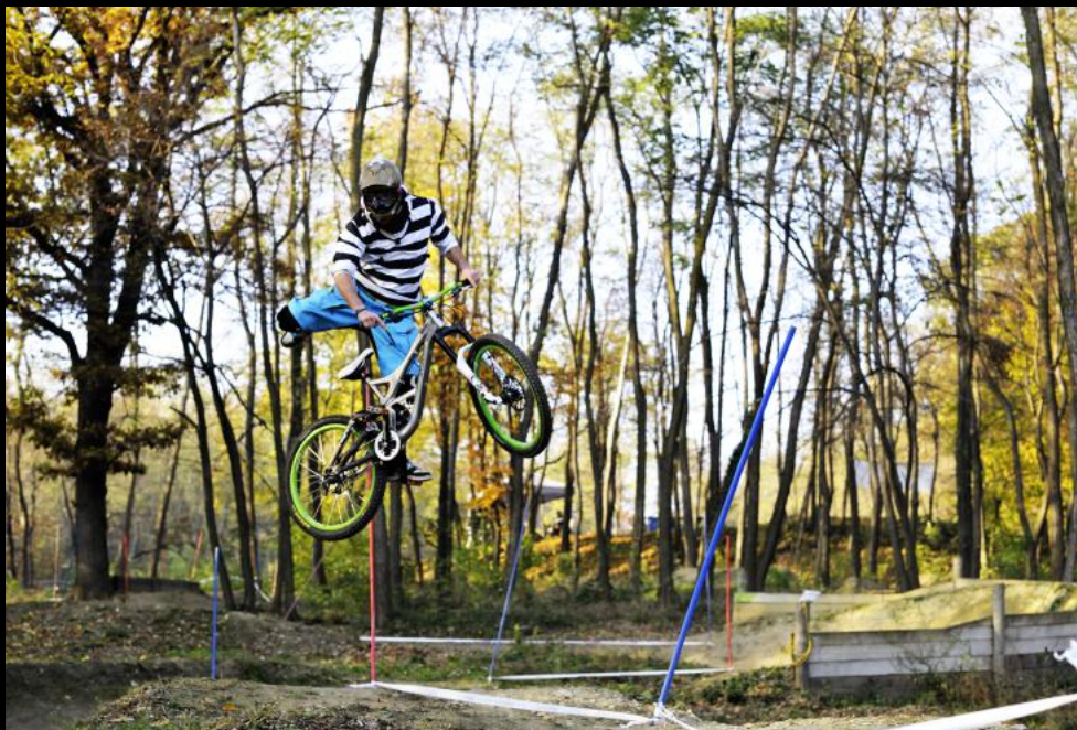
Mountainbiken am Stotzinger Berg.