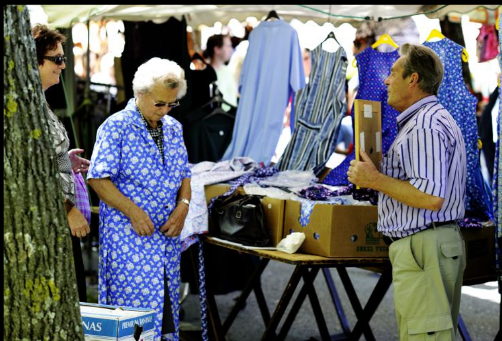
Einkaufen einer Haushaltsschürze beim Markt, der alljährlich zur kroatischen Wallfahrt veranstaltet wird.