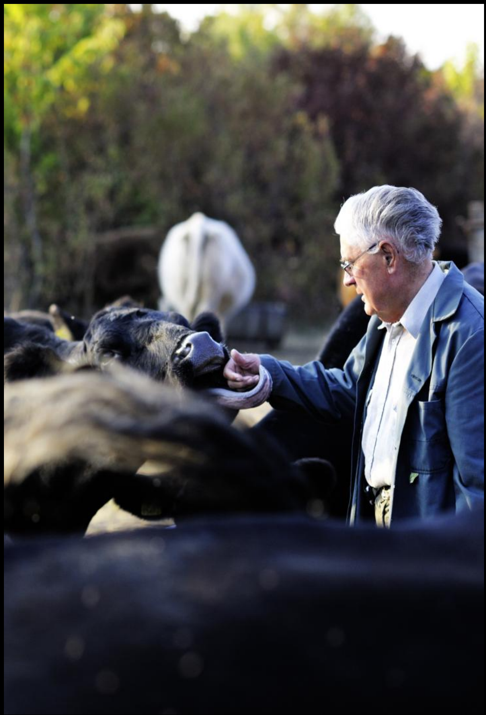
Rinderbauer auf der Hutweide von Purbach.