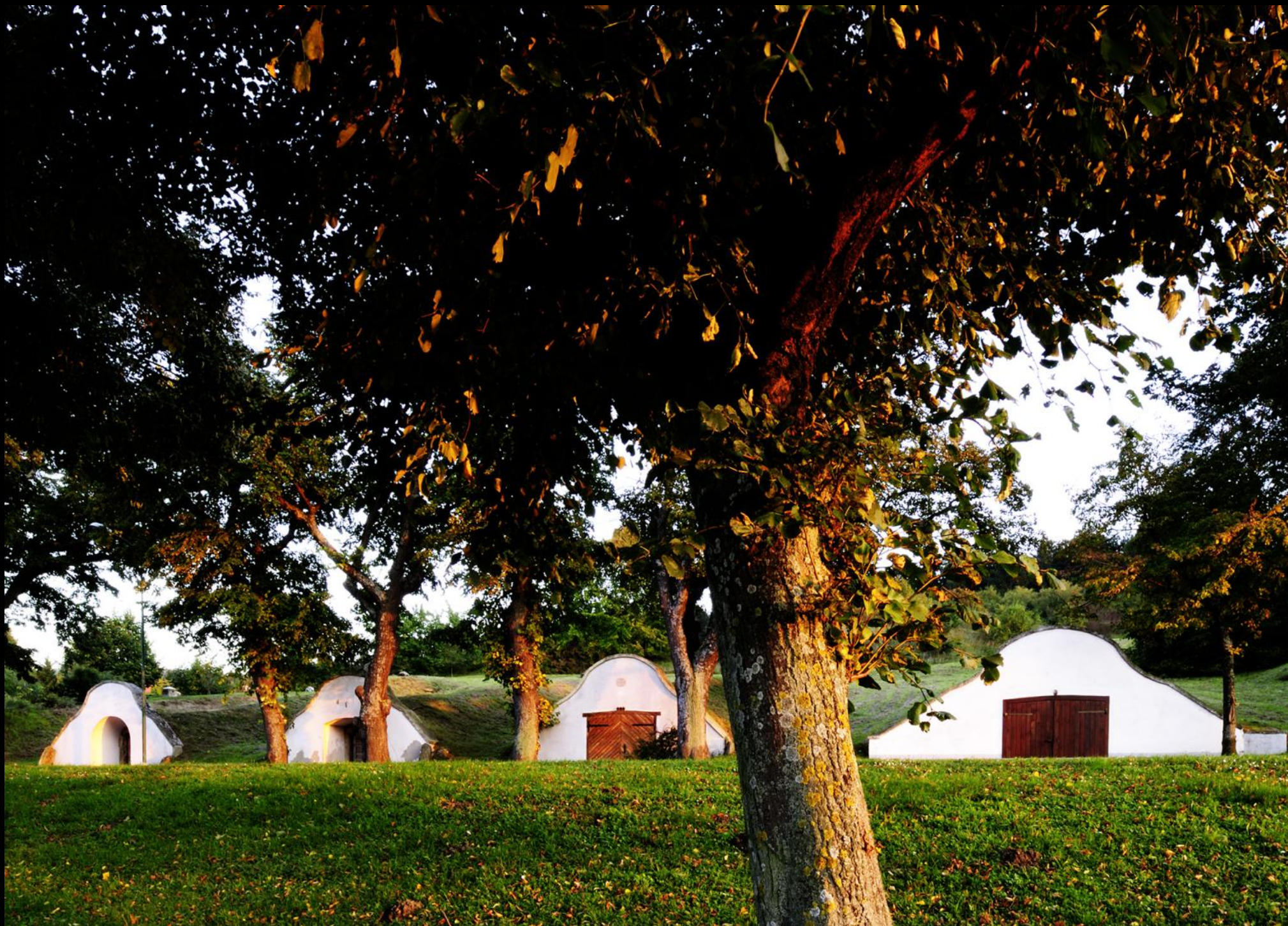
Ensemble von barocken Weinkellern in Sommerin.