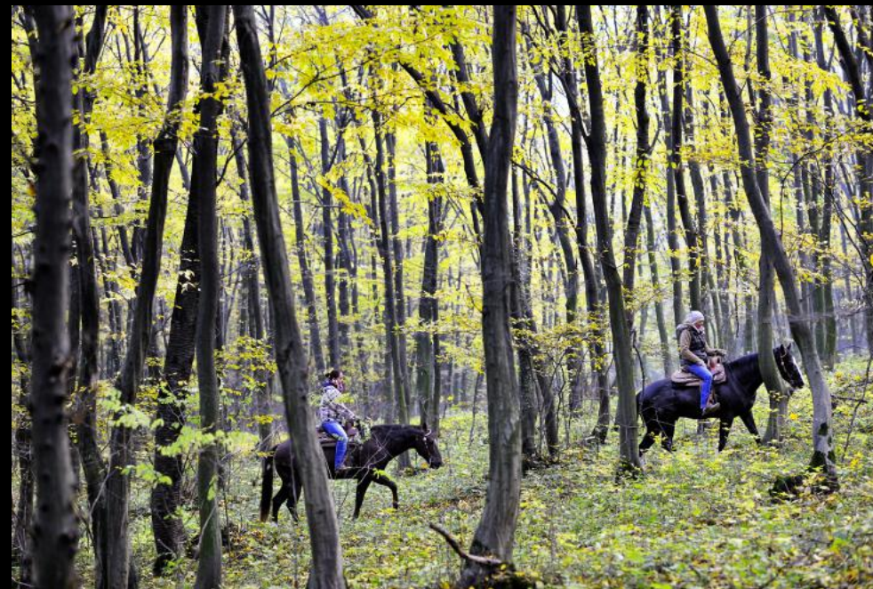
Ausritt in Sommerein.