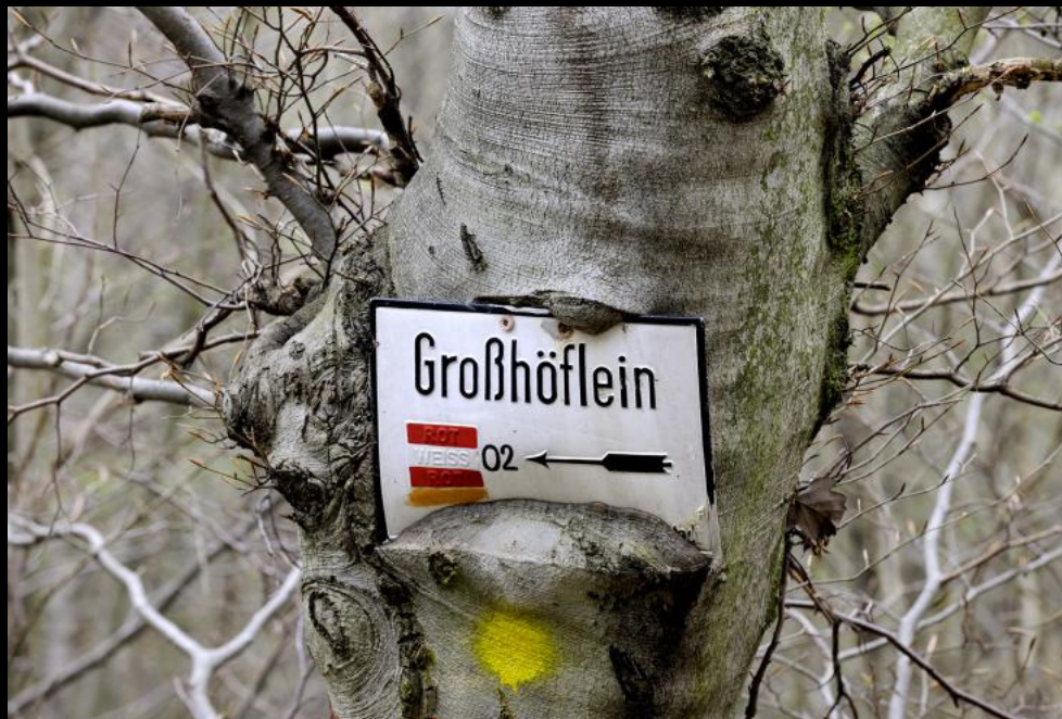
Buche mit eingewachsenem Wanderschild.