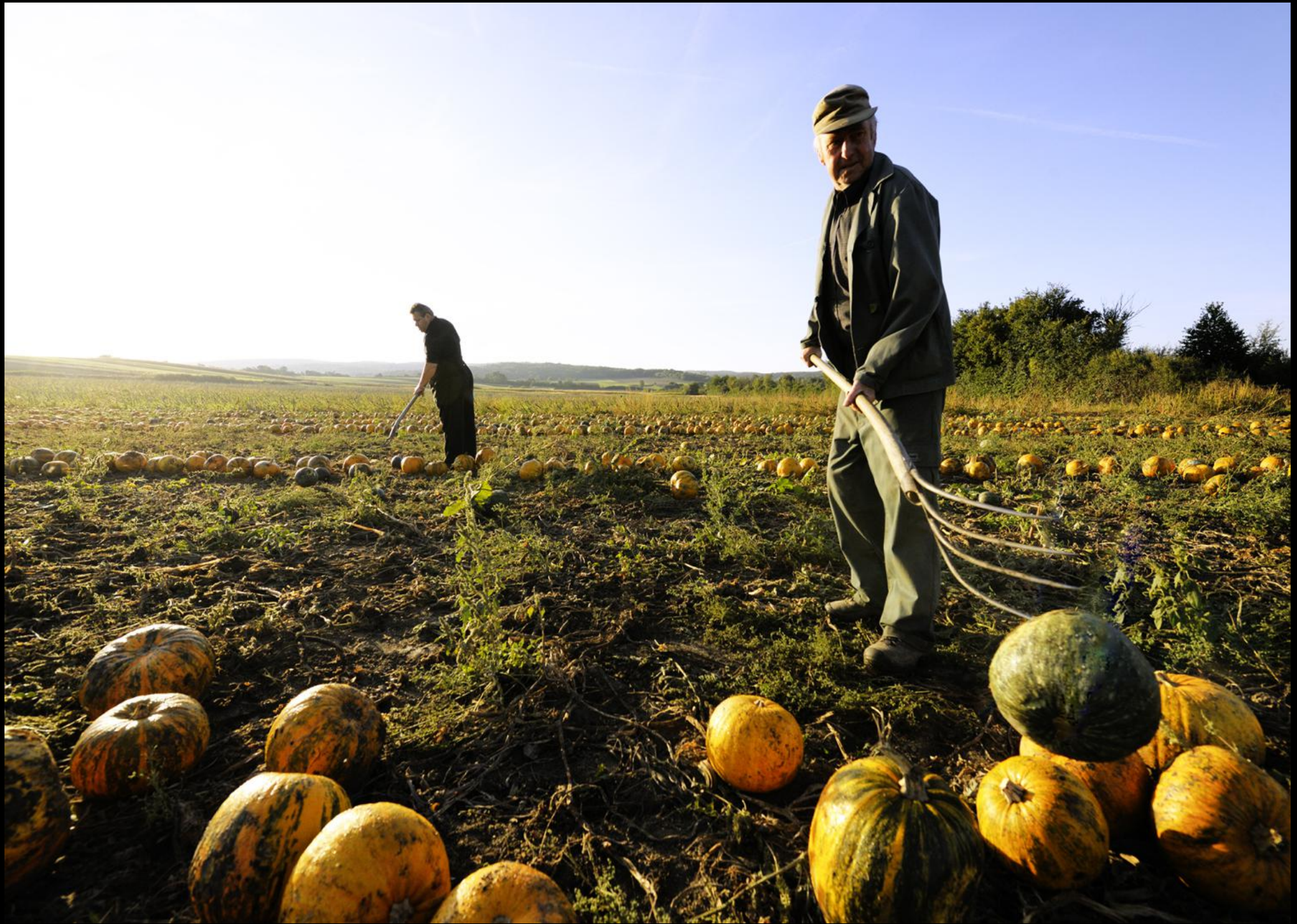
Aussortieren von männlichen Kürbissen in Mannersdorf. Nur die weiblichen Kürbisse werden für die Gewinnung von Kürbiskernen gewünscht.