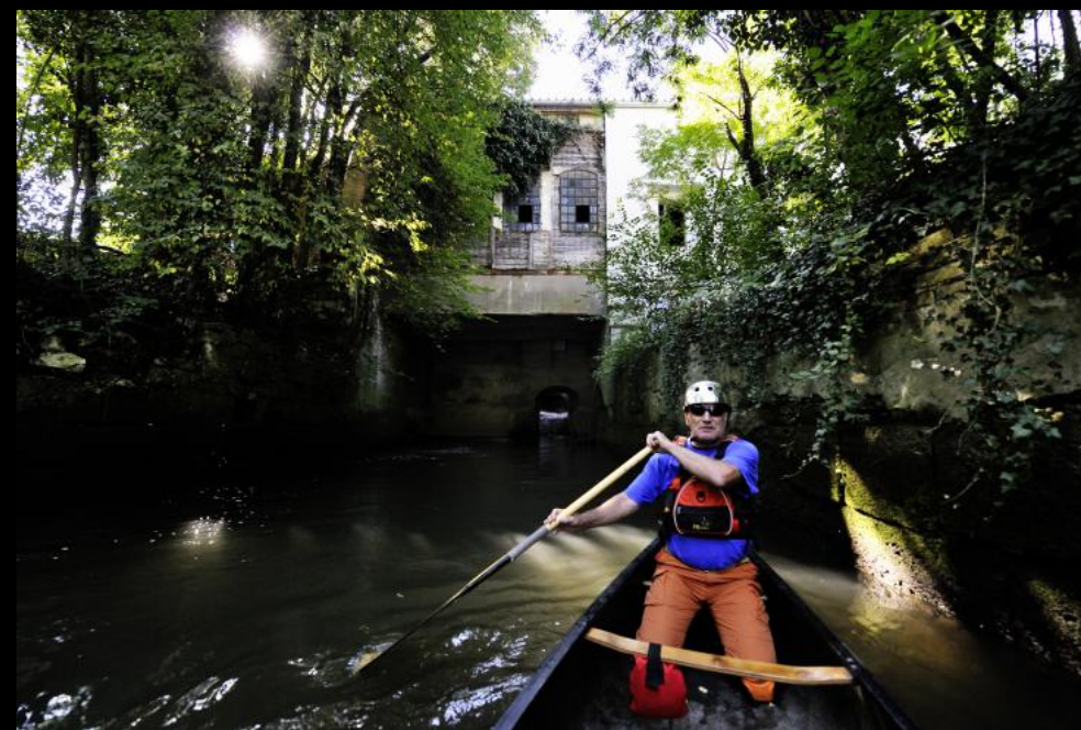
Kajakfahrer auf der Leitha vor einer Schleusenanlage der Bettfedernfabrik in Wimpassing.