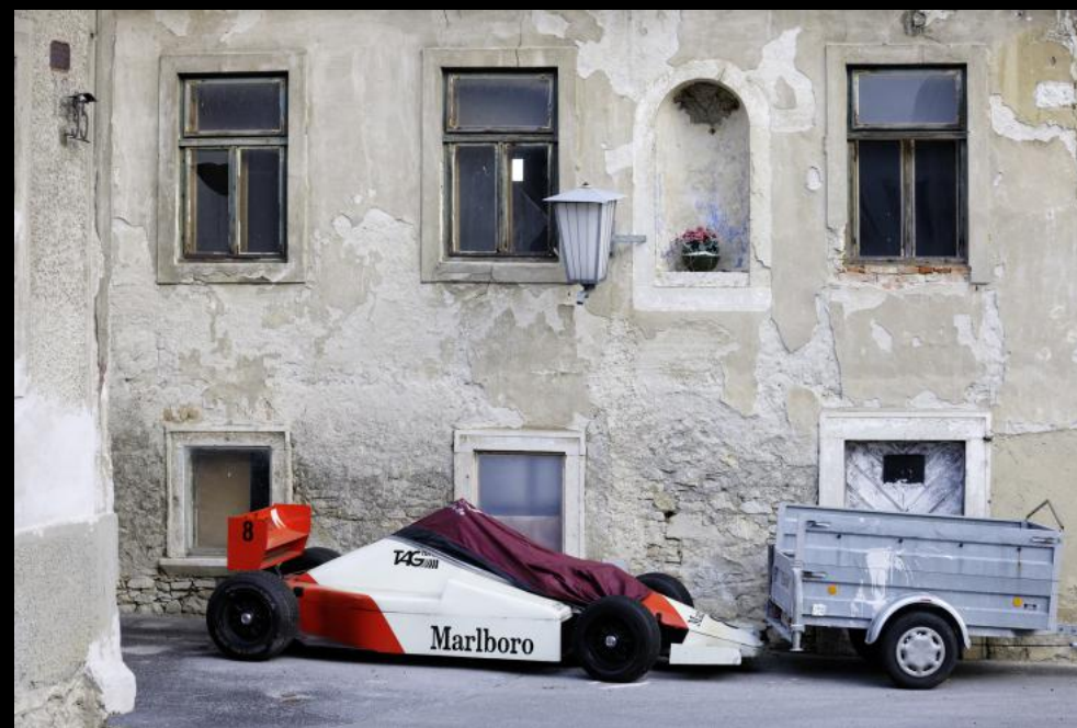
Rennauto und Anhänger in Kaisersteinbruch.