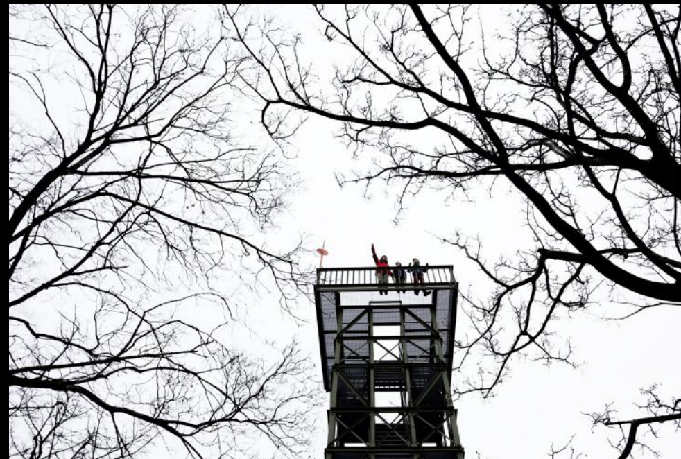
Buchkogelwarte und Wanderer.