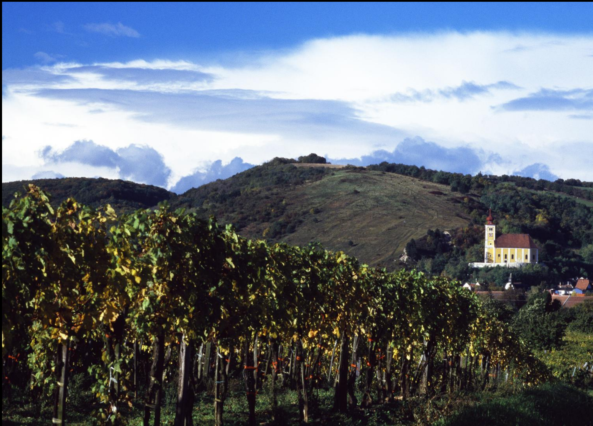
Das kahle Ährenfeld und die Wehrkirche von Donnerskirchen.