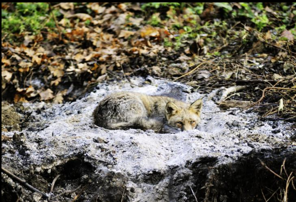
Ein Fuchs wärmt sich im warmen Aschenbett eines Lagerfeuers.