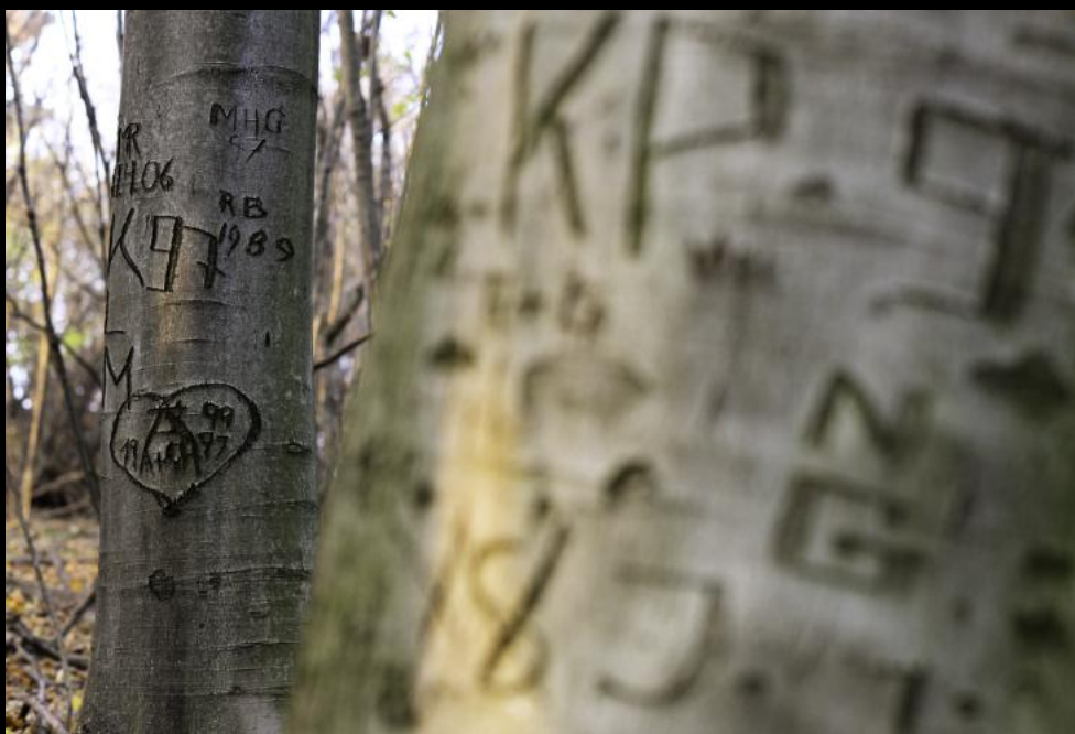
Baumeinritzungen in Buchen am Buchkogel.