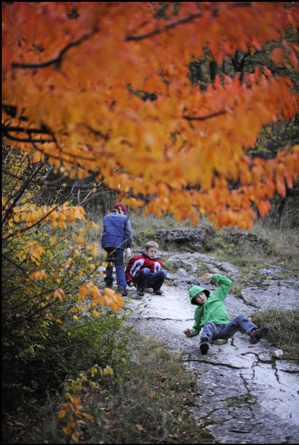
Herbstlicher Spaß beim "Rutschstein" von Sommerein. Ein flacher Stein als Unterlage beschleunigt die Fahrt.