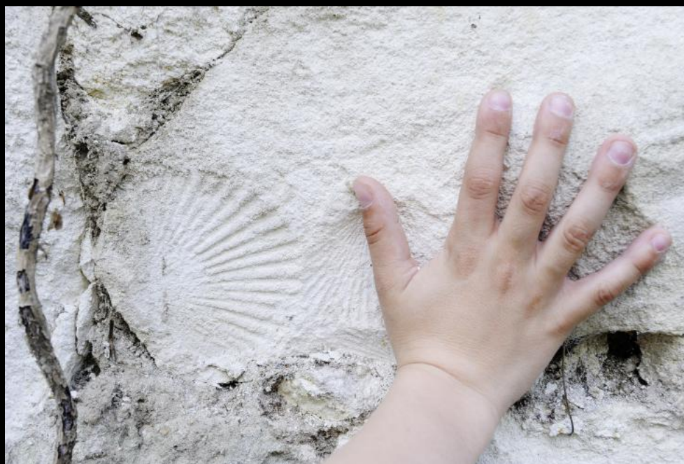
Versteinerte Auster im Kalkstein von Donnerskirchen.