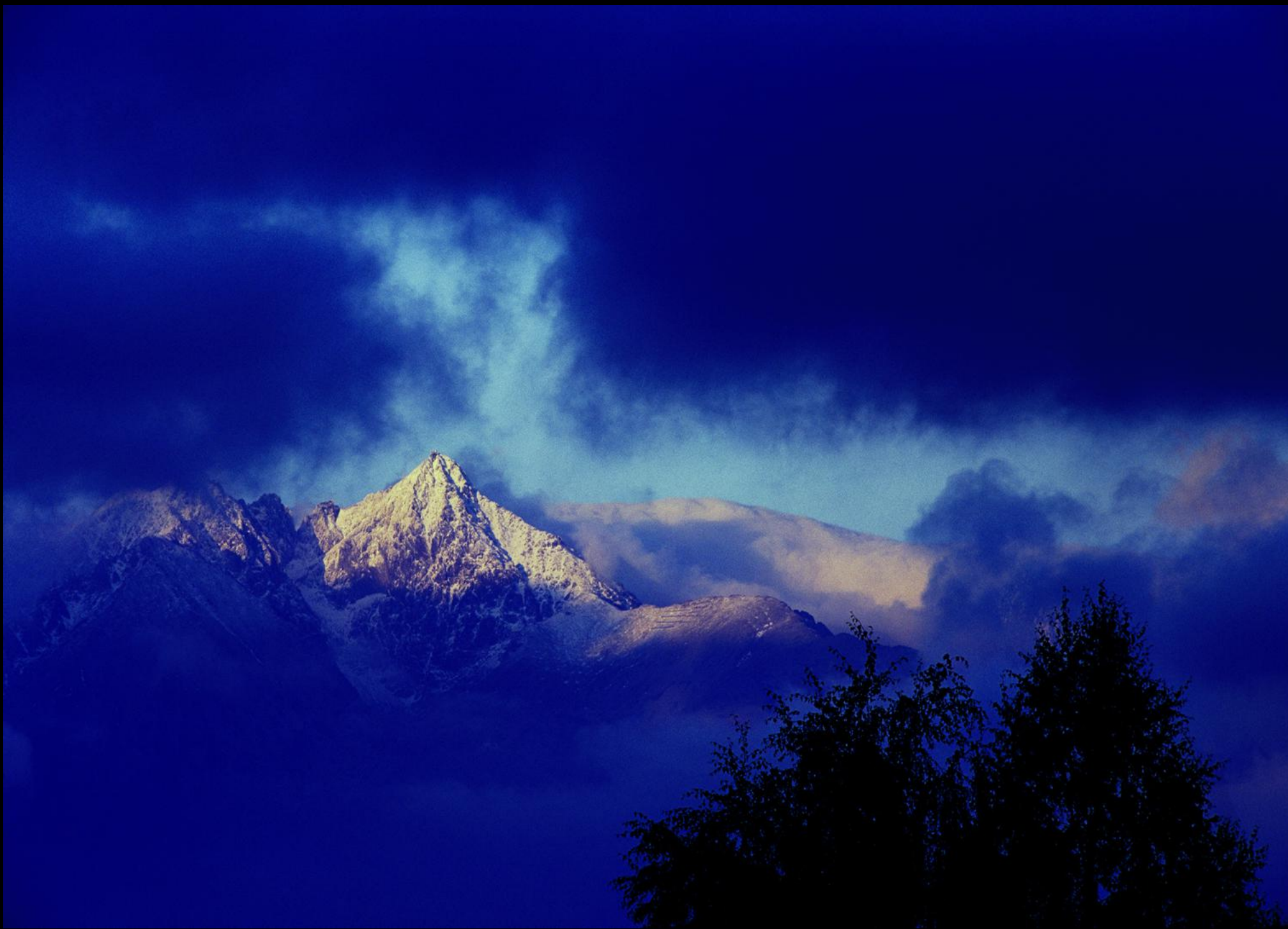
Berggipfel der Hohen Tatra und Wolken.