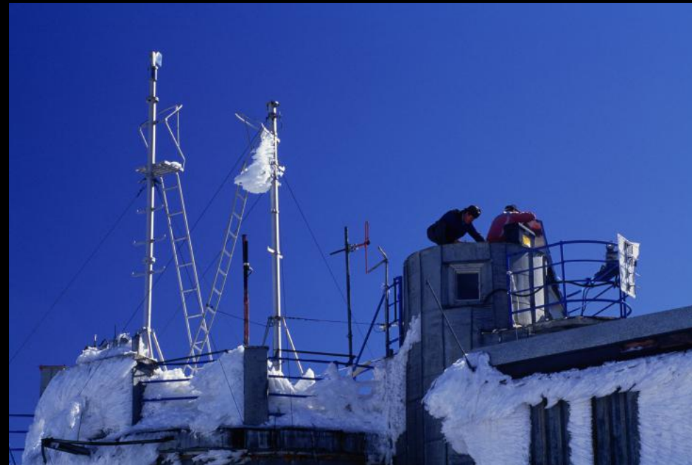
Arbeiter auf dem Dach der Wetterstation auf dem Gipfel von Lomnický štít (Lomnitzer Spitze)