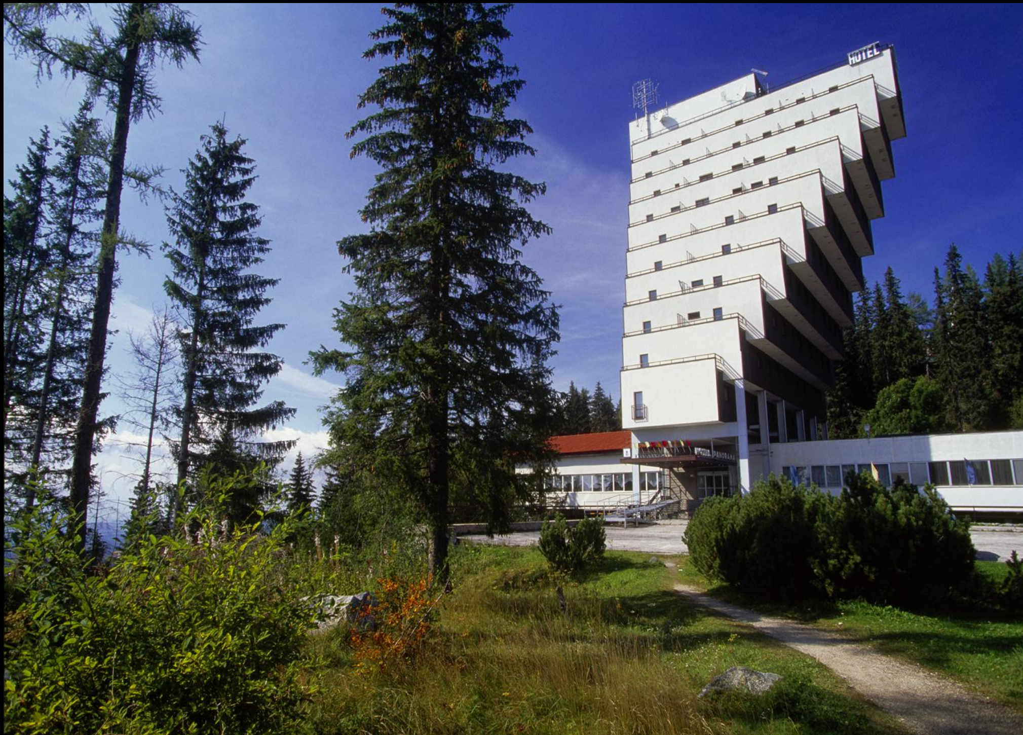
Hotel Panorama gegenüber der Tatra-Bergbahn in Štrbské Pleso.