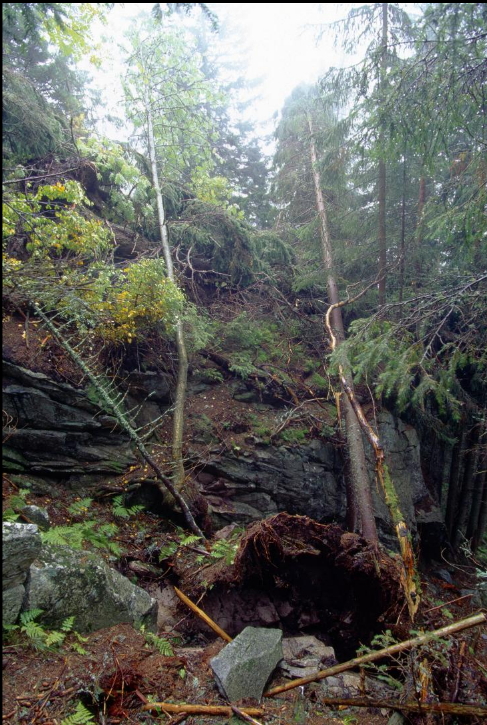
Umgekippter Baum (Sturmschaden) im Kohlbachtal (Veľka Studená dolina).