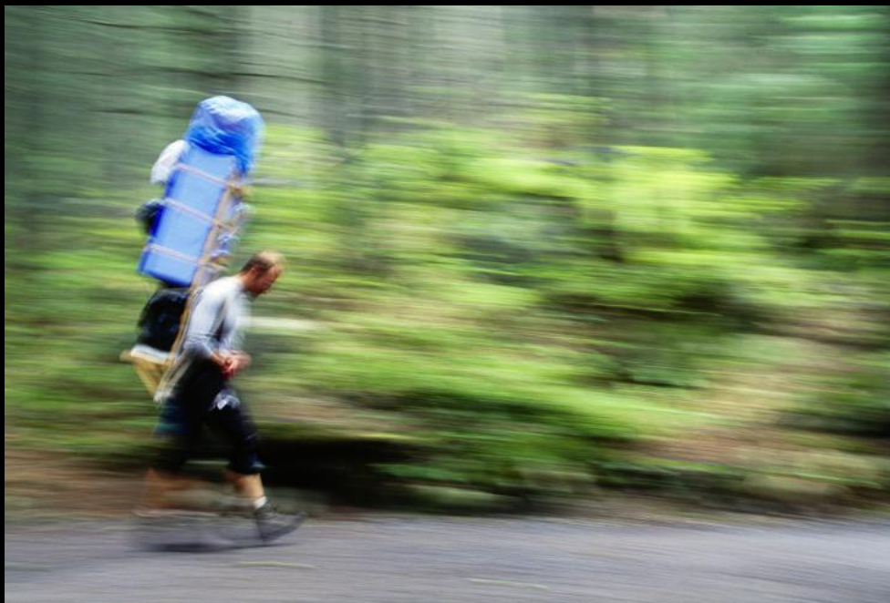
Die Versorgung der Berghütten erfolgt durch mühsames Transportieren schwerer Lasten und Märschen bis zu 8 Stunden Gehzeit.