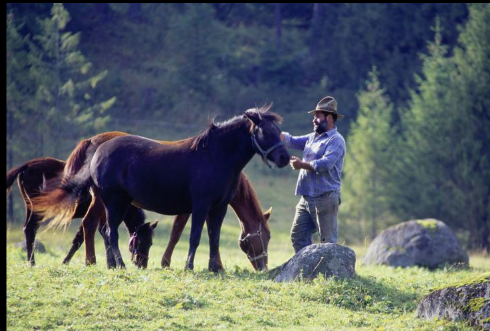
Ein Pferdezüchter zäumt in Javorina Tatranska ein Pferd auf.