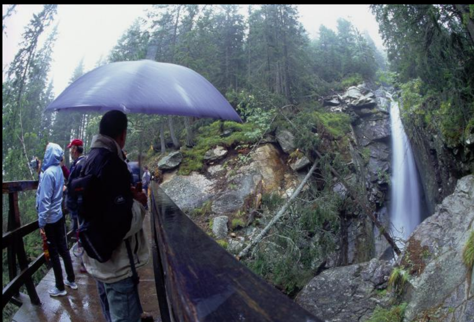
Wanderer auf einer Brücke im Großen Kohlachtal (Velka Studena dolina).