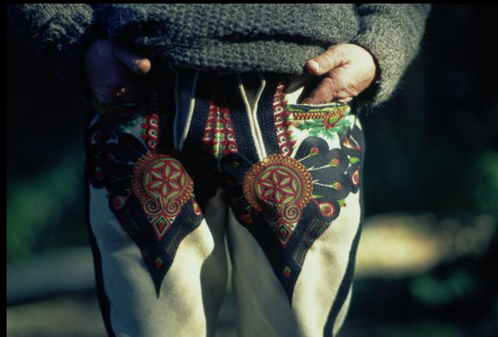
Handbestickte Lederhose eines Kutschers bei Morskie Oko (Meeresauge) auf der polnischen Seite der Hohen Tatra.