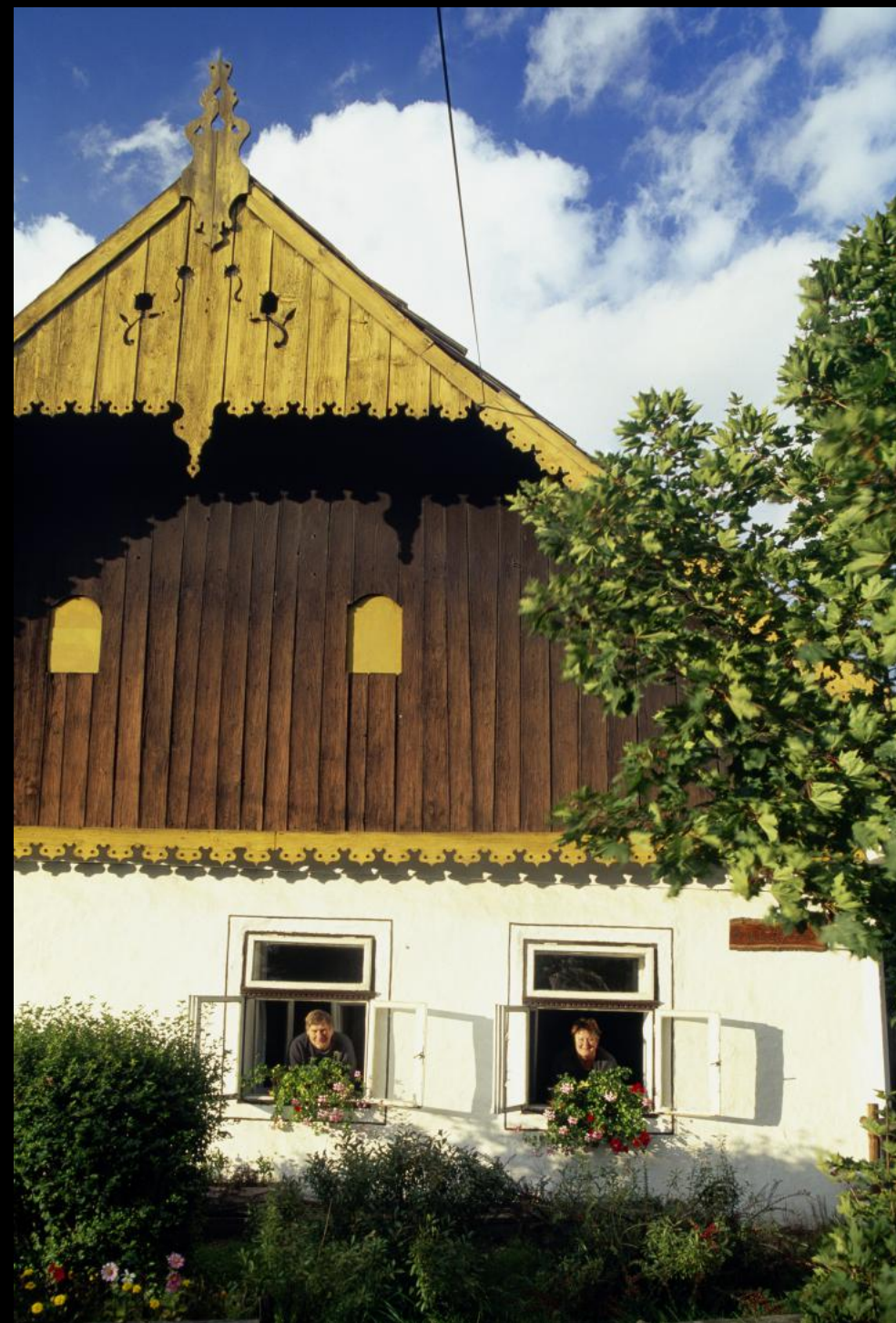
Bauern in ihrem Haus mit geschnitztem Holzgiebel in Bušovce (Bauschendorf).