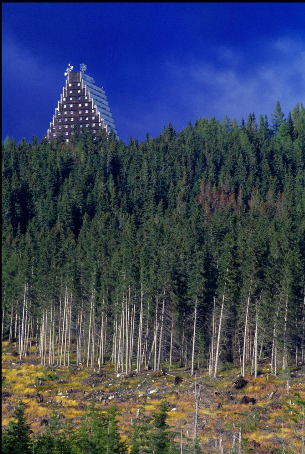
Hotel Panorama und Nadelwald-Lichtung bei Štrbské Pleso.