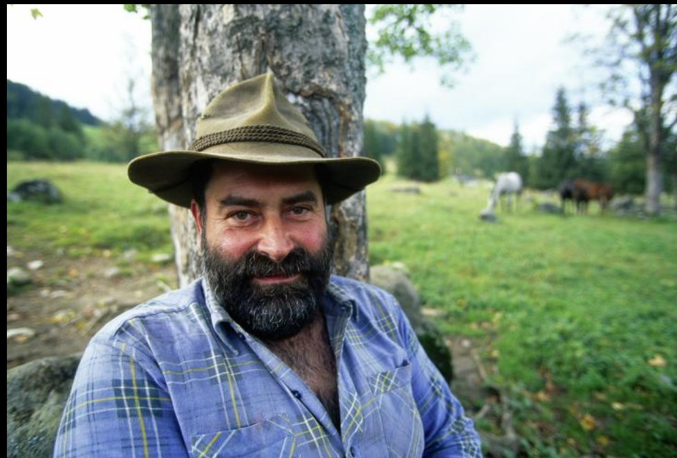
Ein Bauer auf der Weide bei seinen Pferden bei Javorina Tatranska.