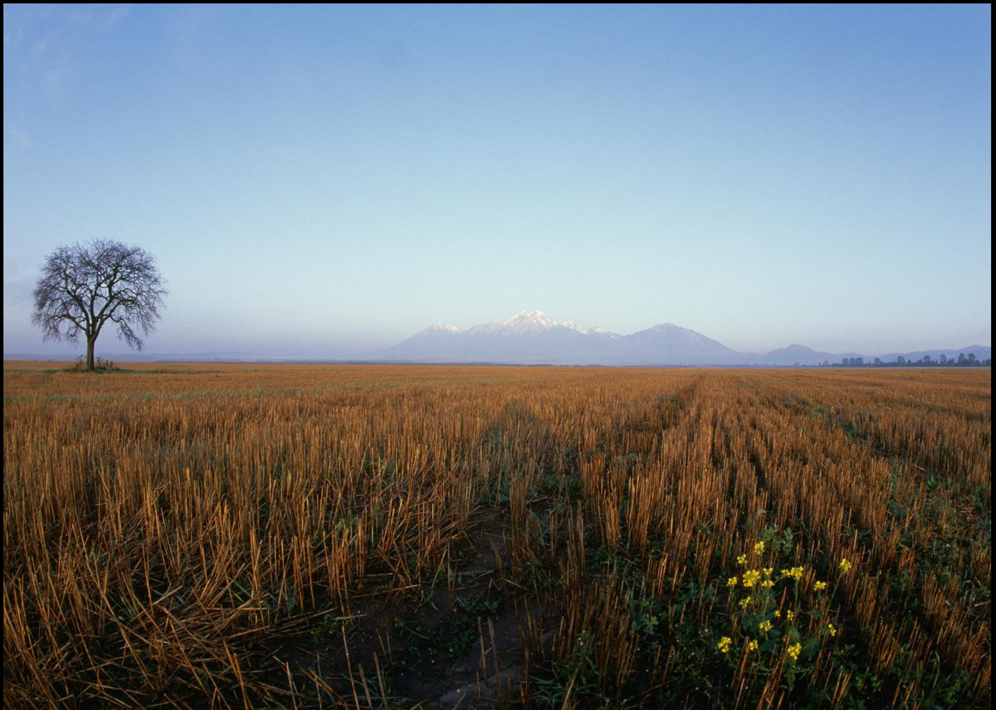
Stoppeln in abgeerntetem Getreidefeld und Gebirgsmassiv der Hohen Tatra.