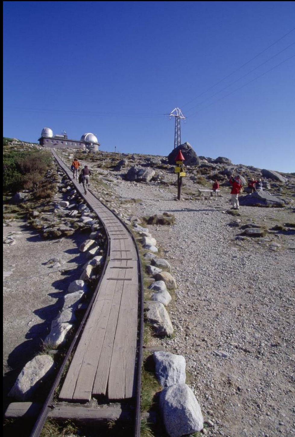
Weg zum Tatra-Observatorium auf dem Gipfel Lomnický štít (Lomnitzer Spitze).