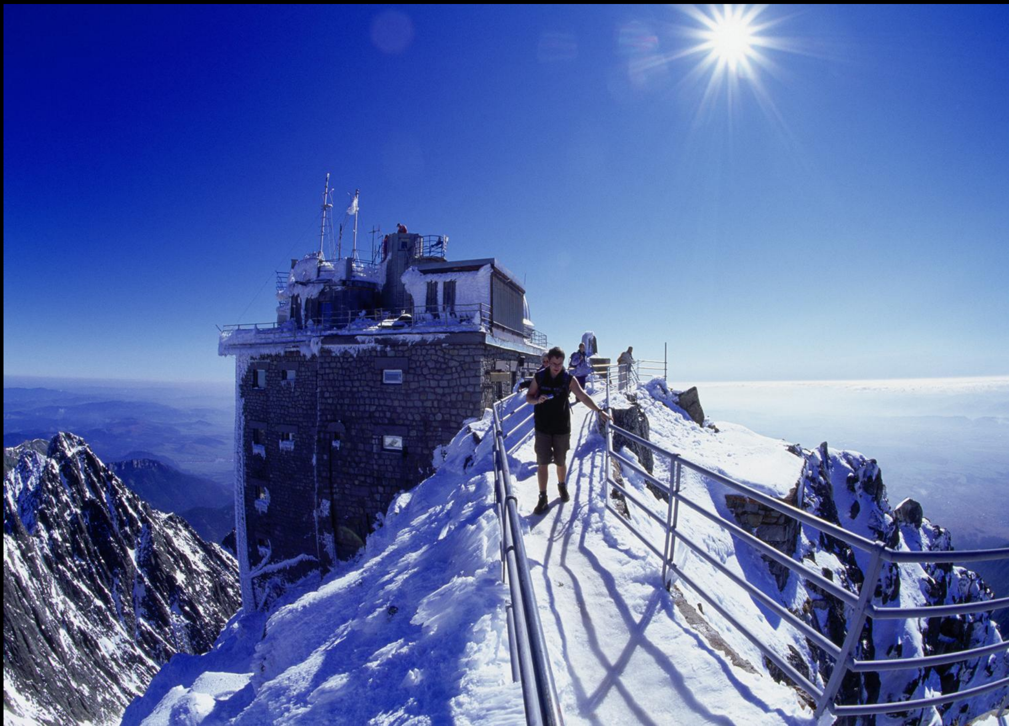
Wetterstation und Hotel Praha am Lomnický štít (Lomnitzer Spitze) auf 2634 Metern.