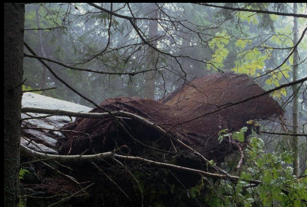
Umgekippter Baum (Sturmschaden) im Großen Kohlbachtal (Veľka Studená dolina).