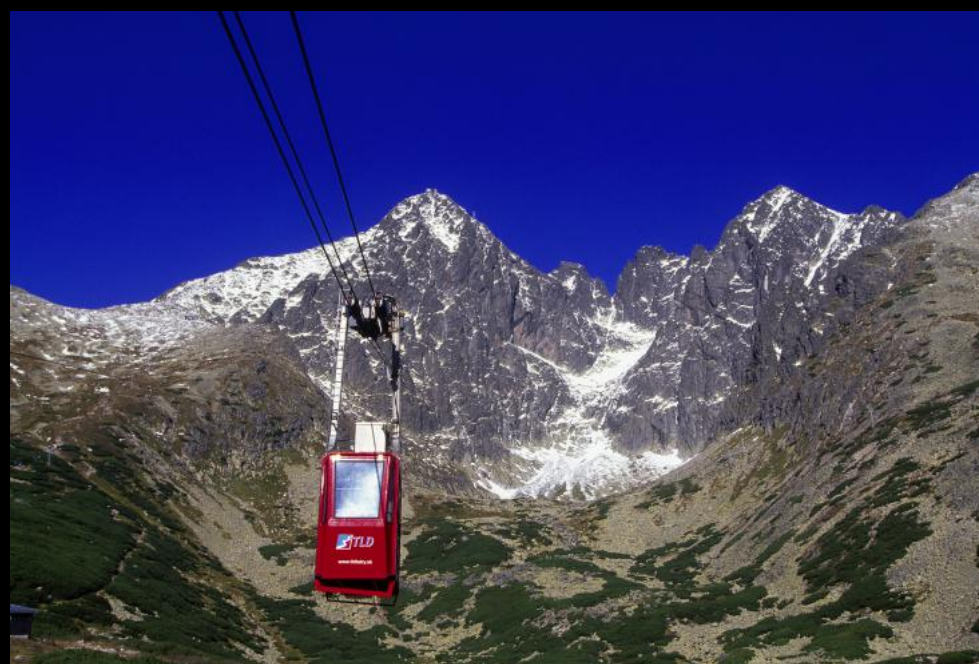
Die Luftseilbahn zum Gipfel der Lomnitzer Spitze (Lomnický štít) hat nur zwei Liftstützen und durchspannt das ganze Tal mit 4137 Metern.