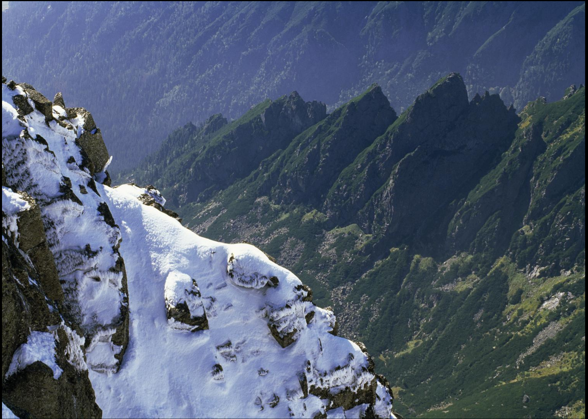
Blick von Lomnický štít (Lomnitzer Spitze).