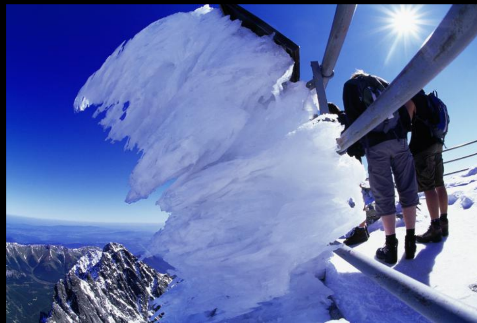
Vereiste Hinweistafel und Wanderer am Gipfel von Lomnický štít (Lomnitzer Spitze).