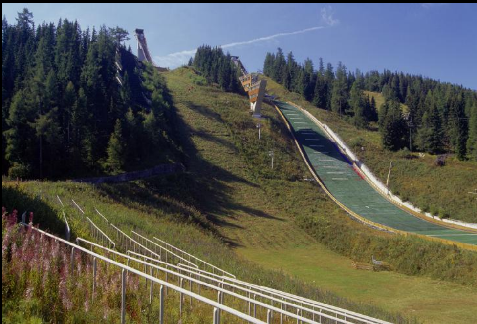
K 120 - Skisprungschanze Štrbské Pleso.