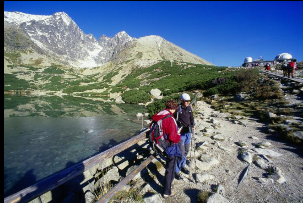
Wanderer beim Tatra-Observatorium auf der Lomnický štít (Lomnitzer Spitze).