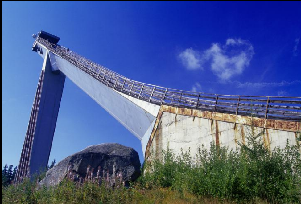
K 120 - Skisprungschanze Štrbské Pleso.