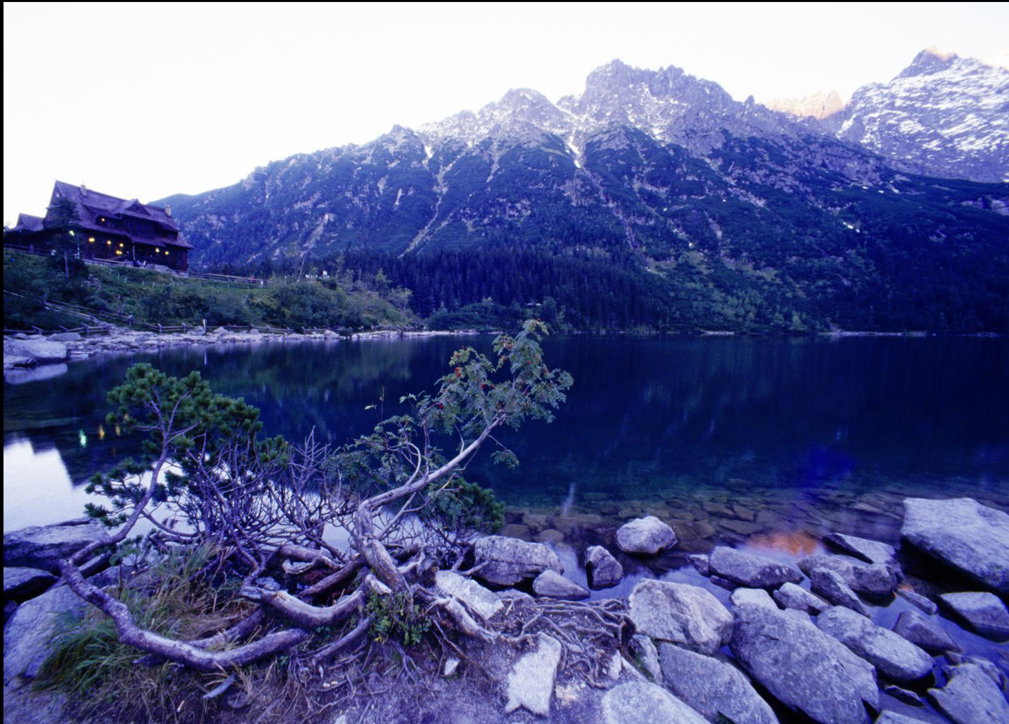
Bergsee "Meeresauge" (Morskie Oko) in einer Höhe von 1395 m auf der polnischen Seite der Hohen Tatra.