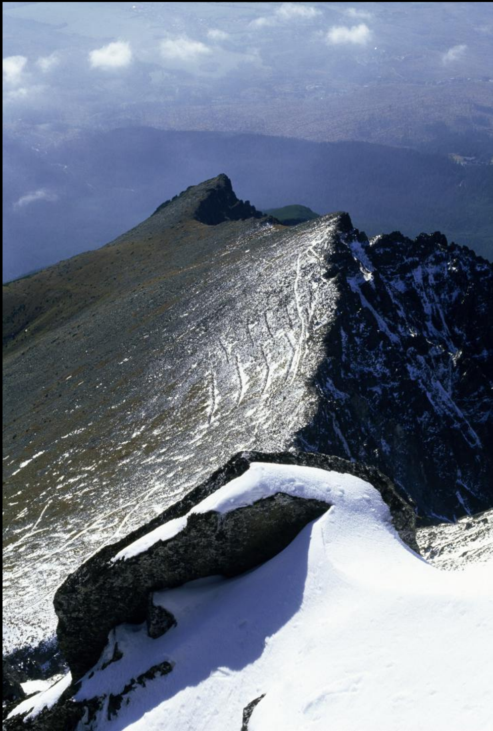
Blick von Lomnický štít (Lomnitzer Spitze).