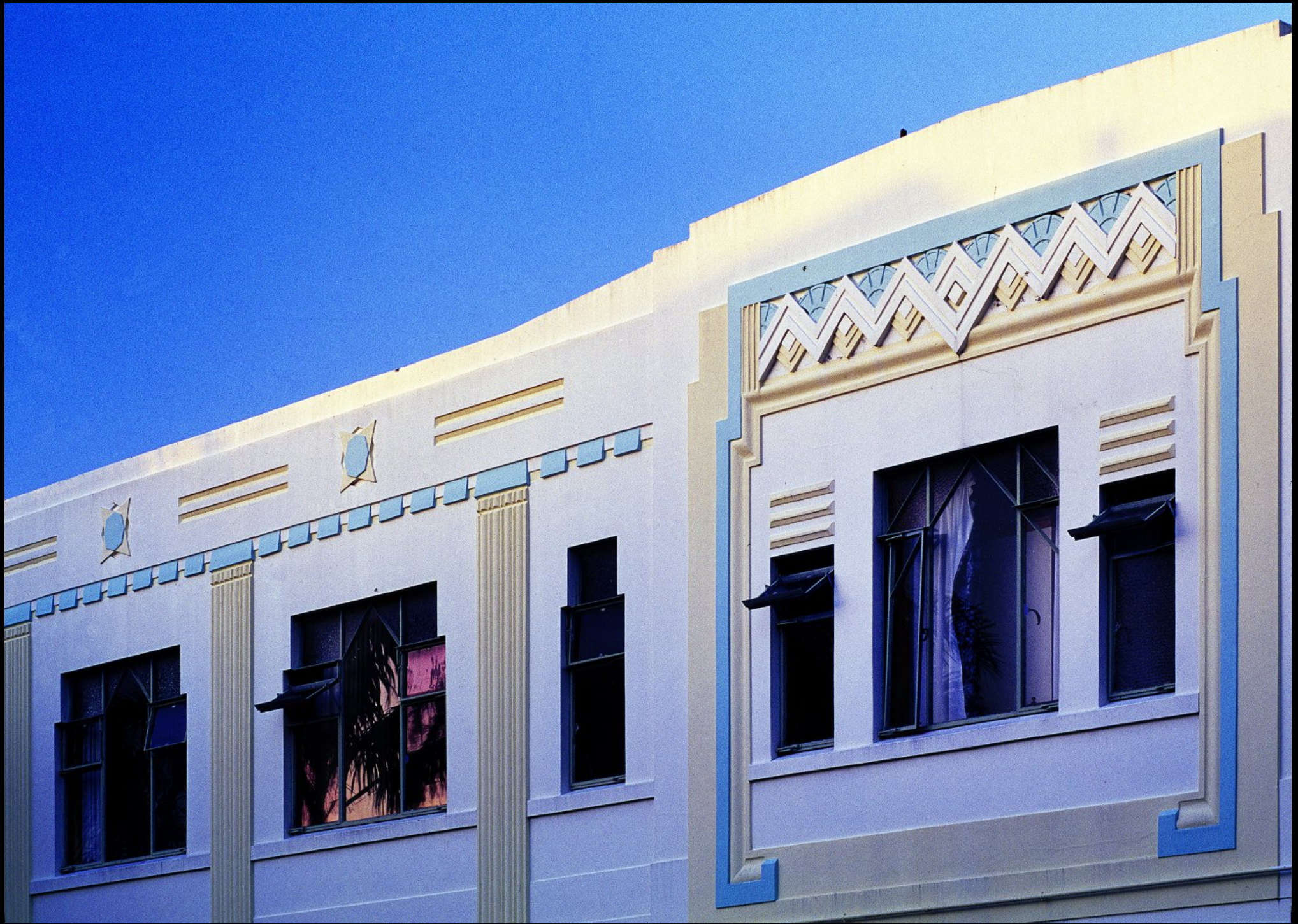
Art Deco Haus in der Dalton Street