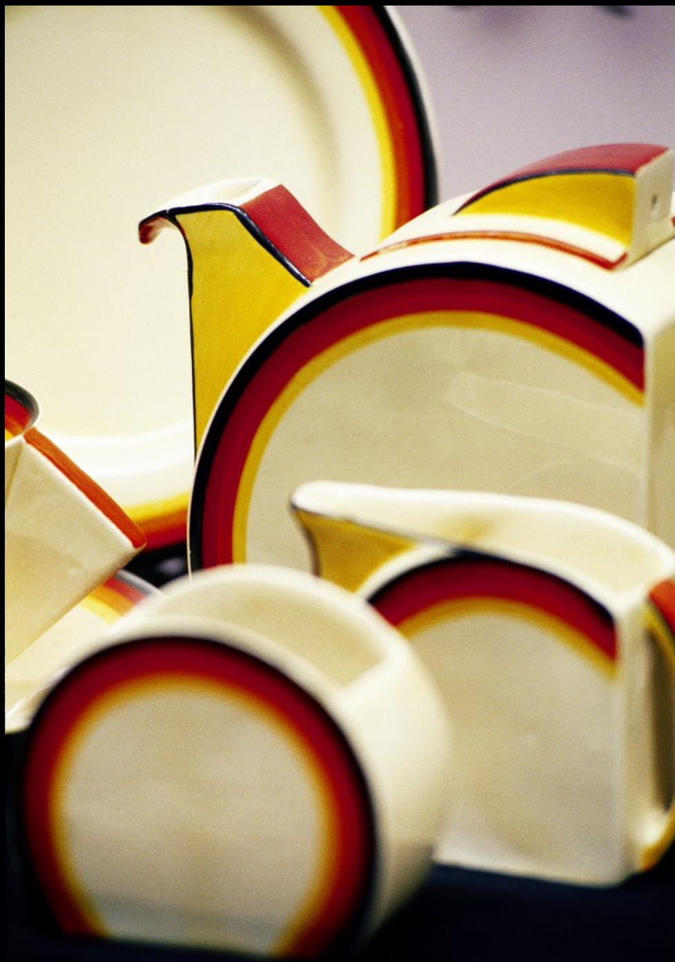
Art Deco Teeservice (Erdbebenmuseum)