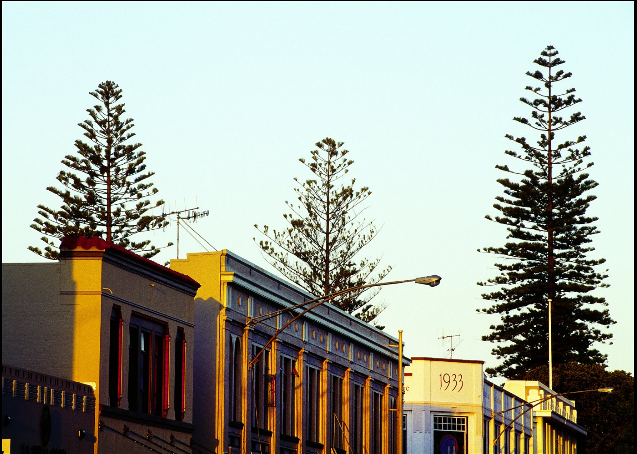
Häuser und Norfolkannen