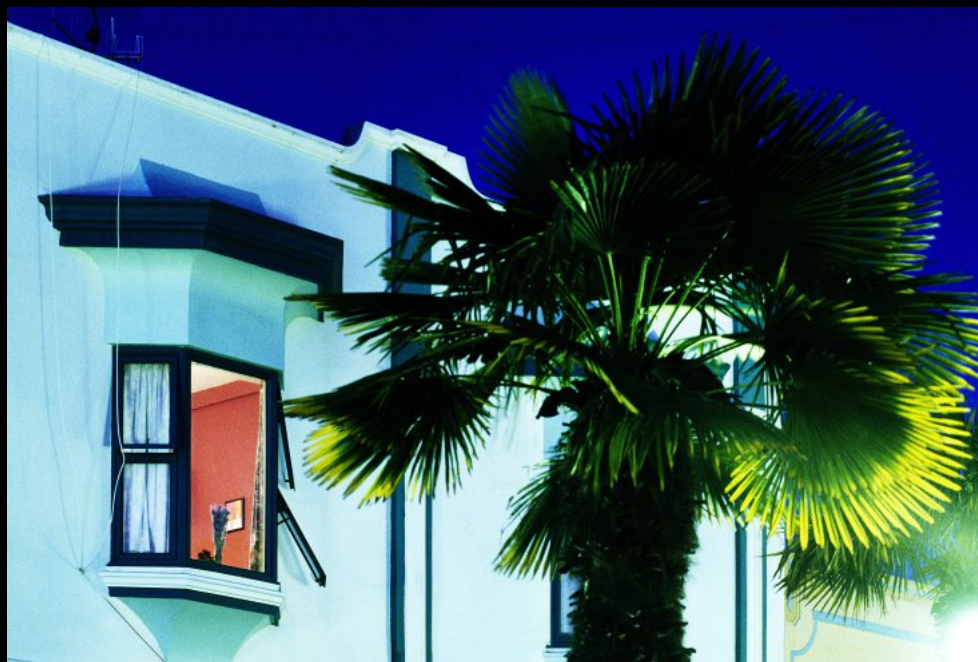
Art Deco Haus ("Rent a Room")