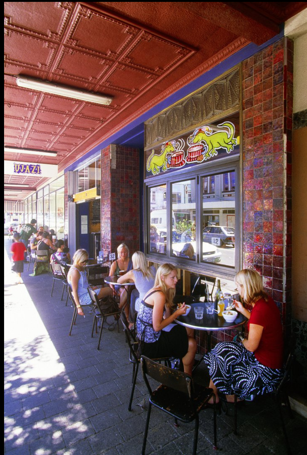
Art Deco Haus "Cafe Ujazi"