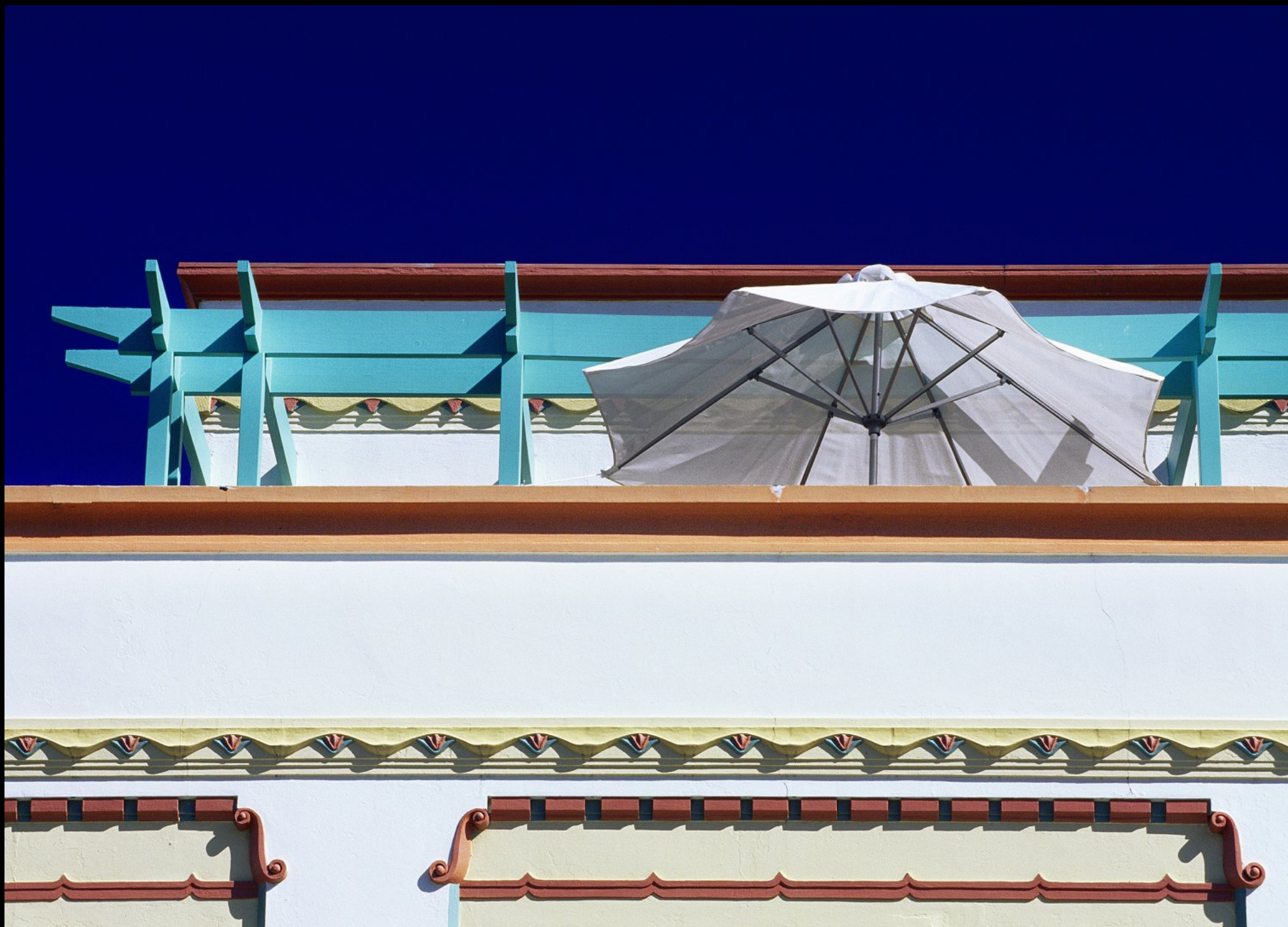
Art Deco Haus an der Emerson Street