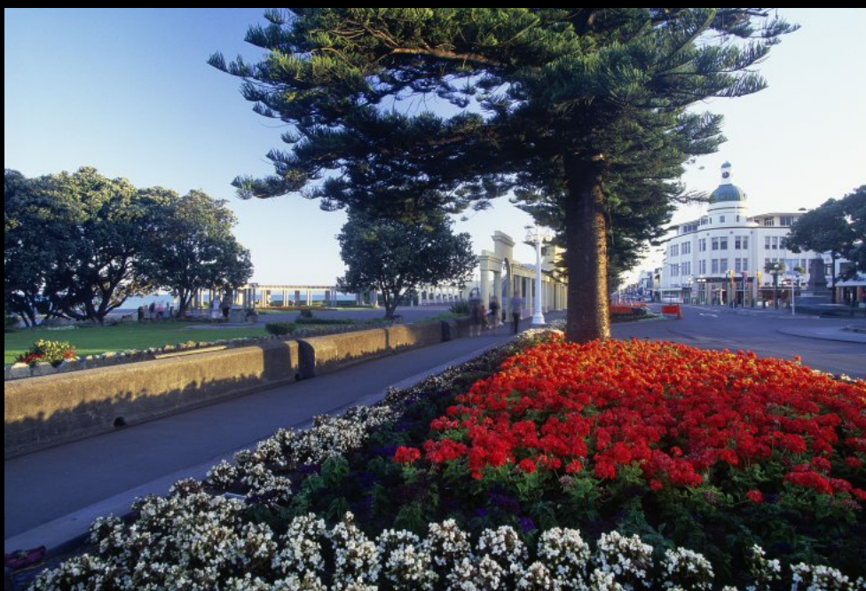
KonzerKonzertthalle "Sound Shell" an der Promenade