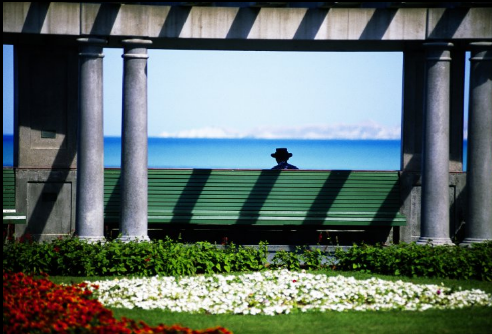
Parkbank mit Meeresblick an der Seepromenade