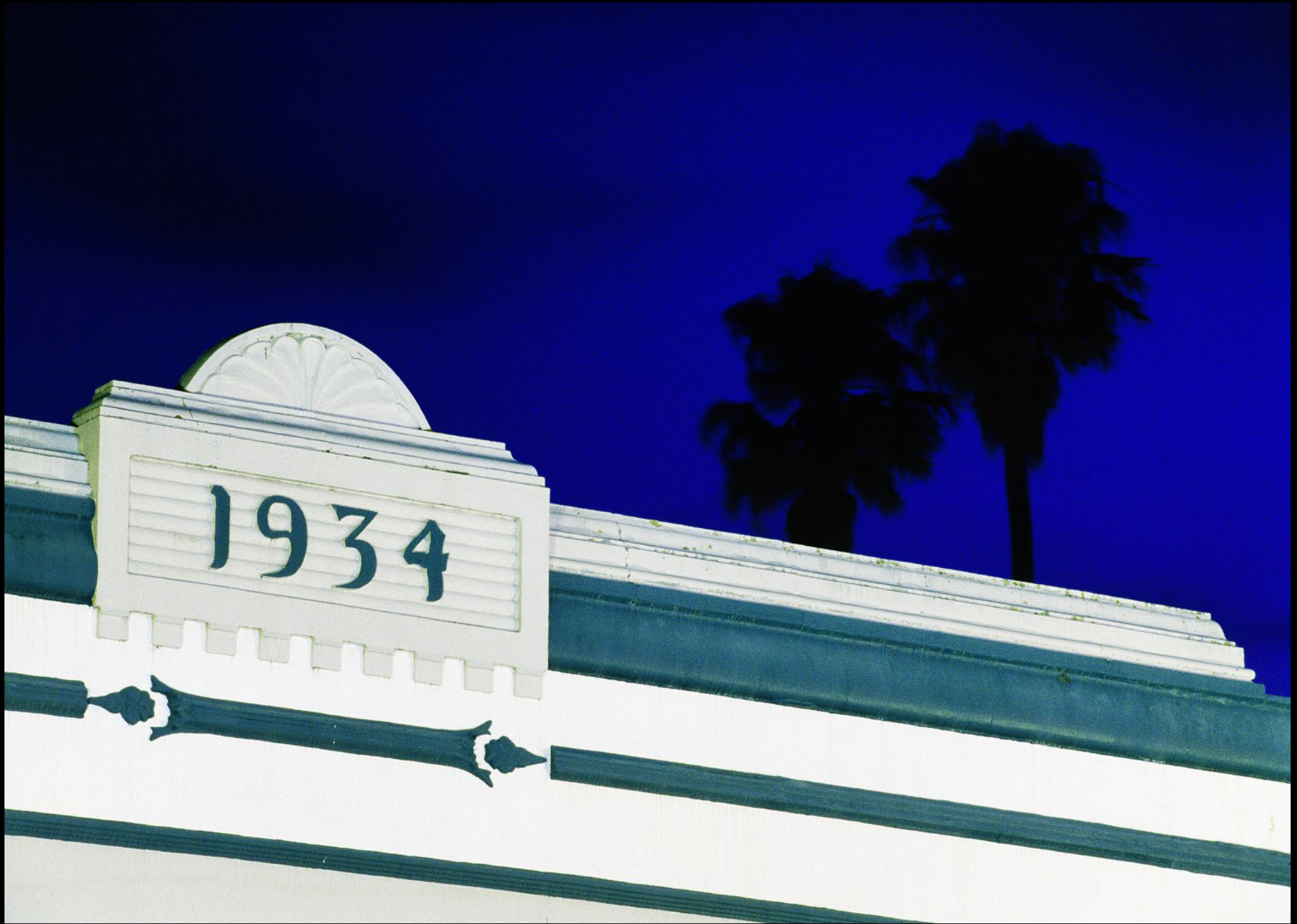
Detail an Art Deco Haus an der Emerson Street