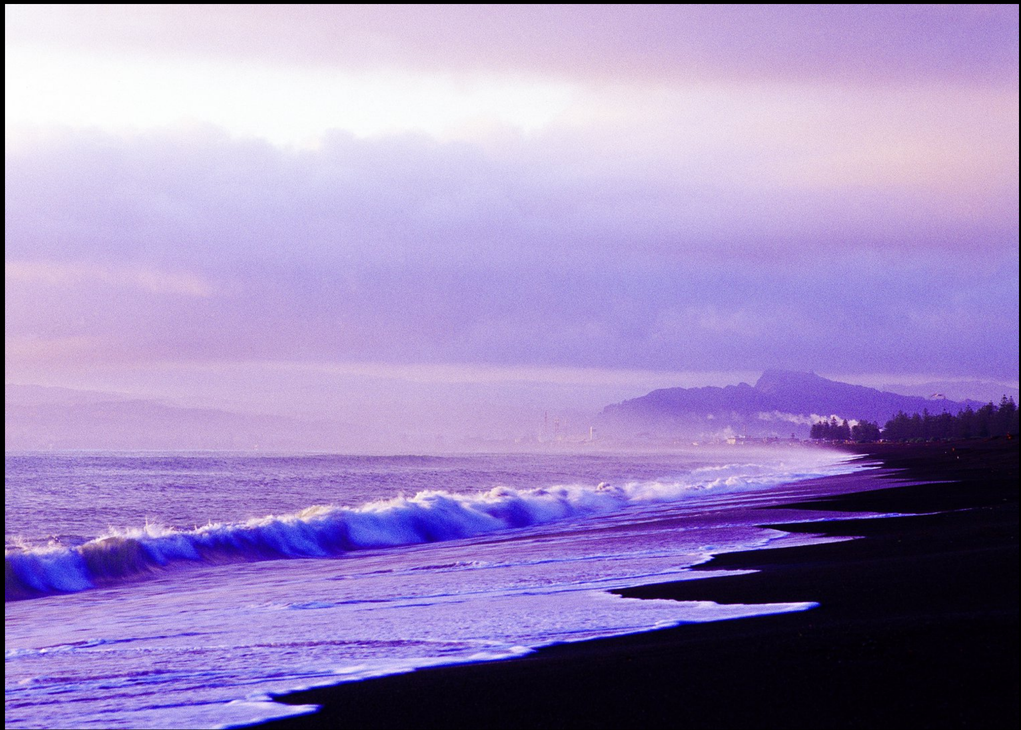
Hawke's Bay und schwarzer Strand von Napier