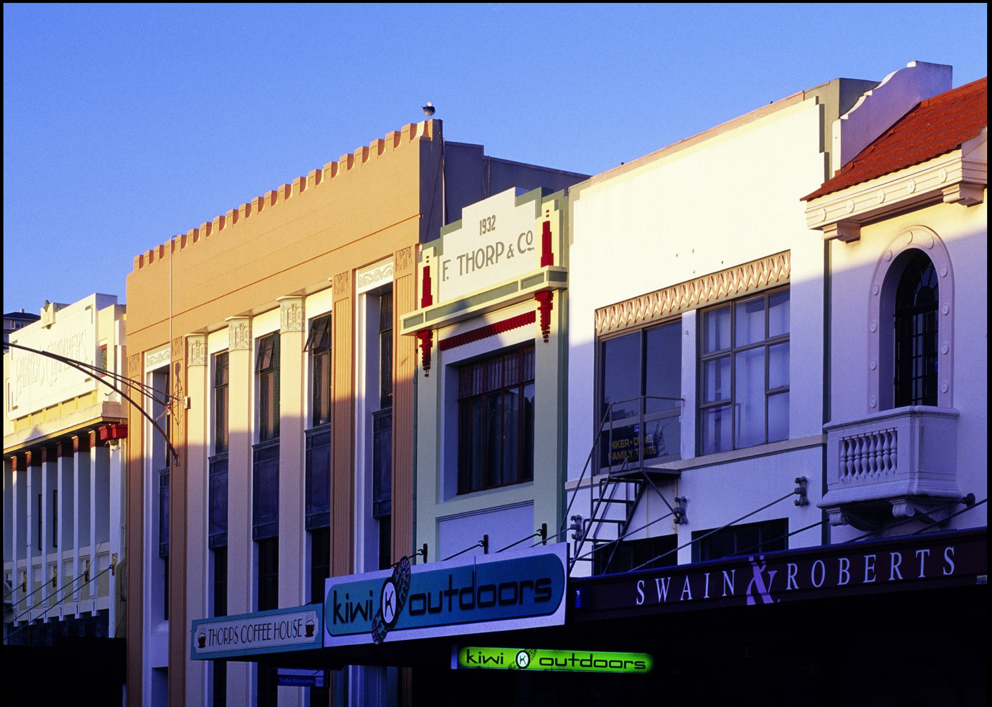
Geschäfte in der Herschell Street