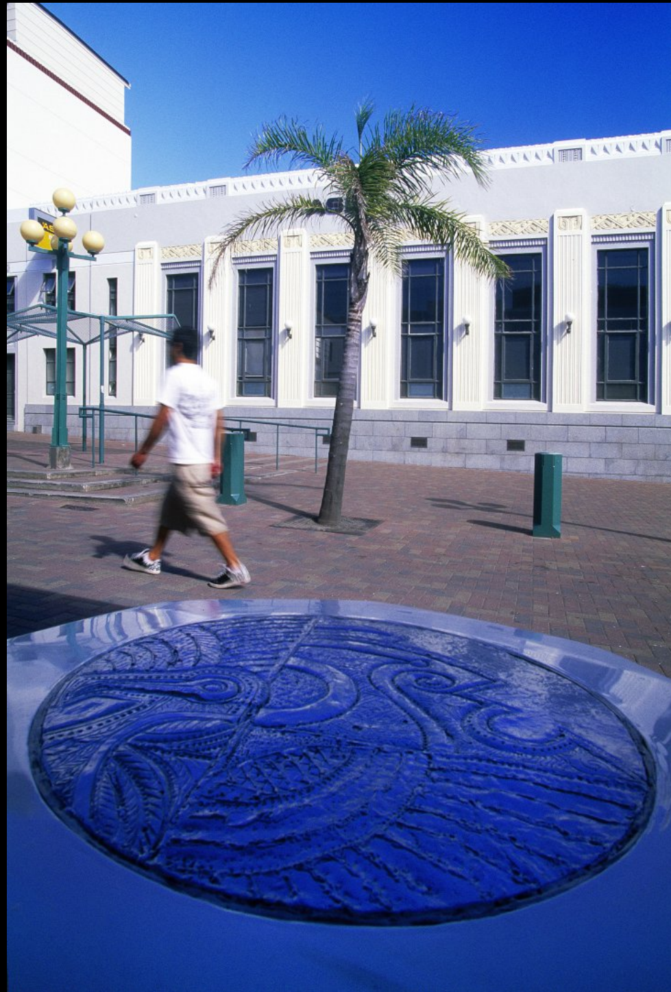
Skulptur mit Maori-Muster