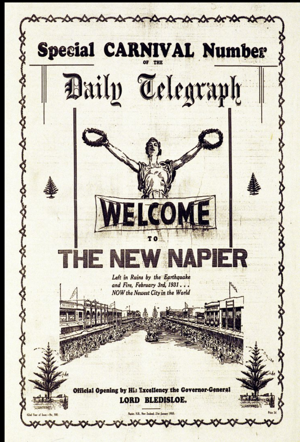
Erdbeben Museum, Zeitungsausschnitt von 1931 kündigt die Neueröffnung der Stadt nach dem Wiederaufbau (Erdbeben) an