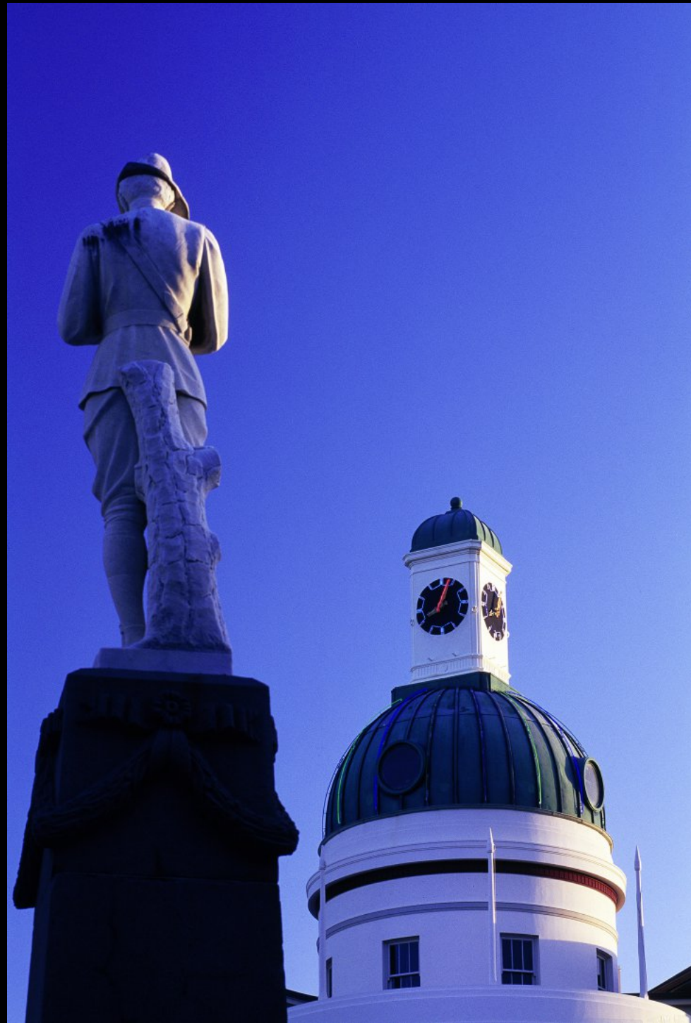
Kriegerdenkmal und Kuppel der A&B Bank