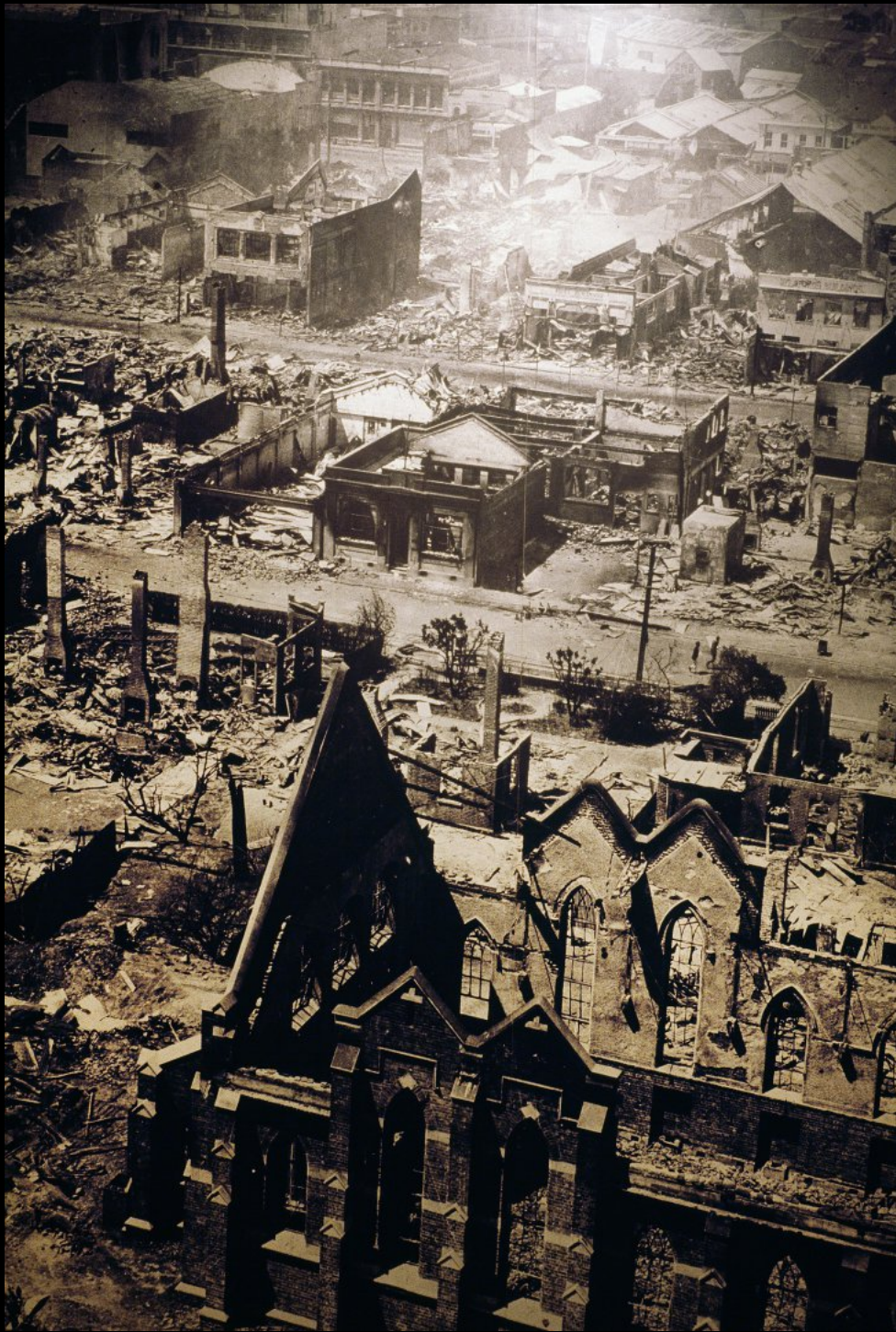
Erdbeben Museum, Foto vom Erdbeben 1931