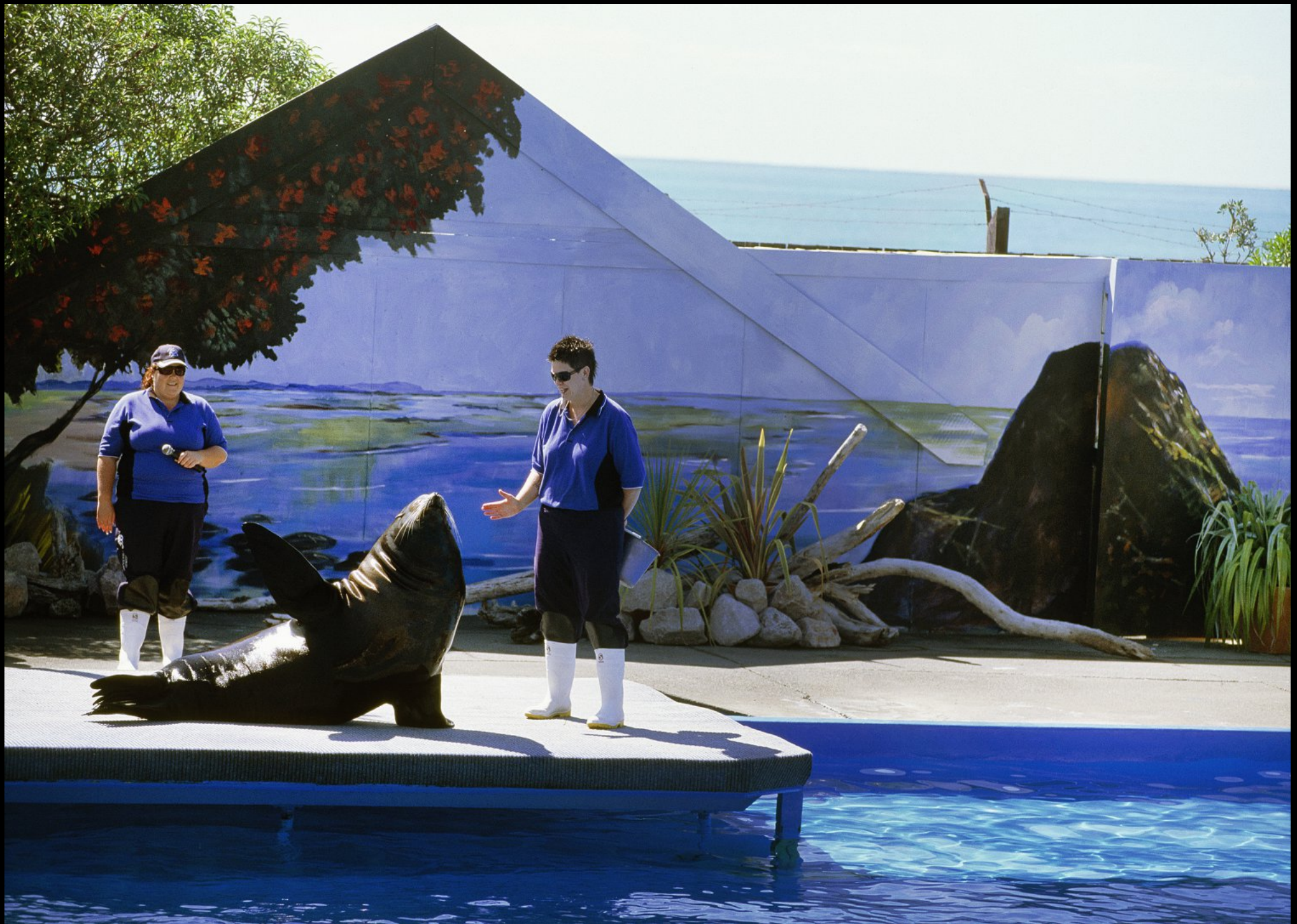
Seelöwe im Aquarium "Marine World"