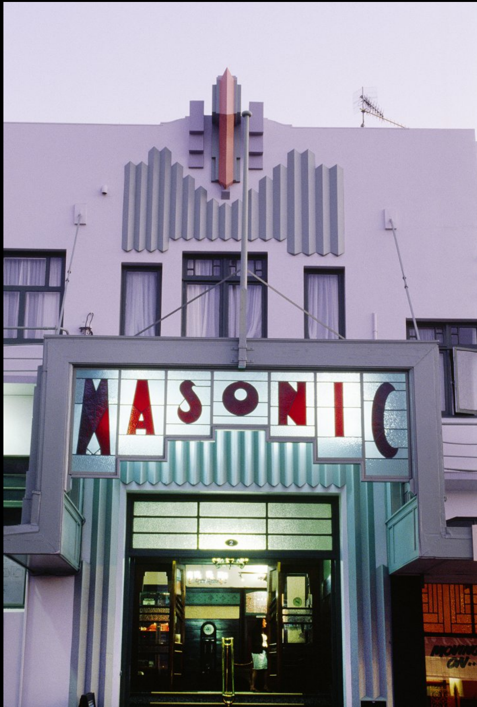
Art Deco Hotel "Masonic"