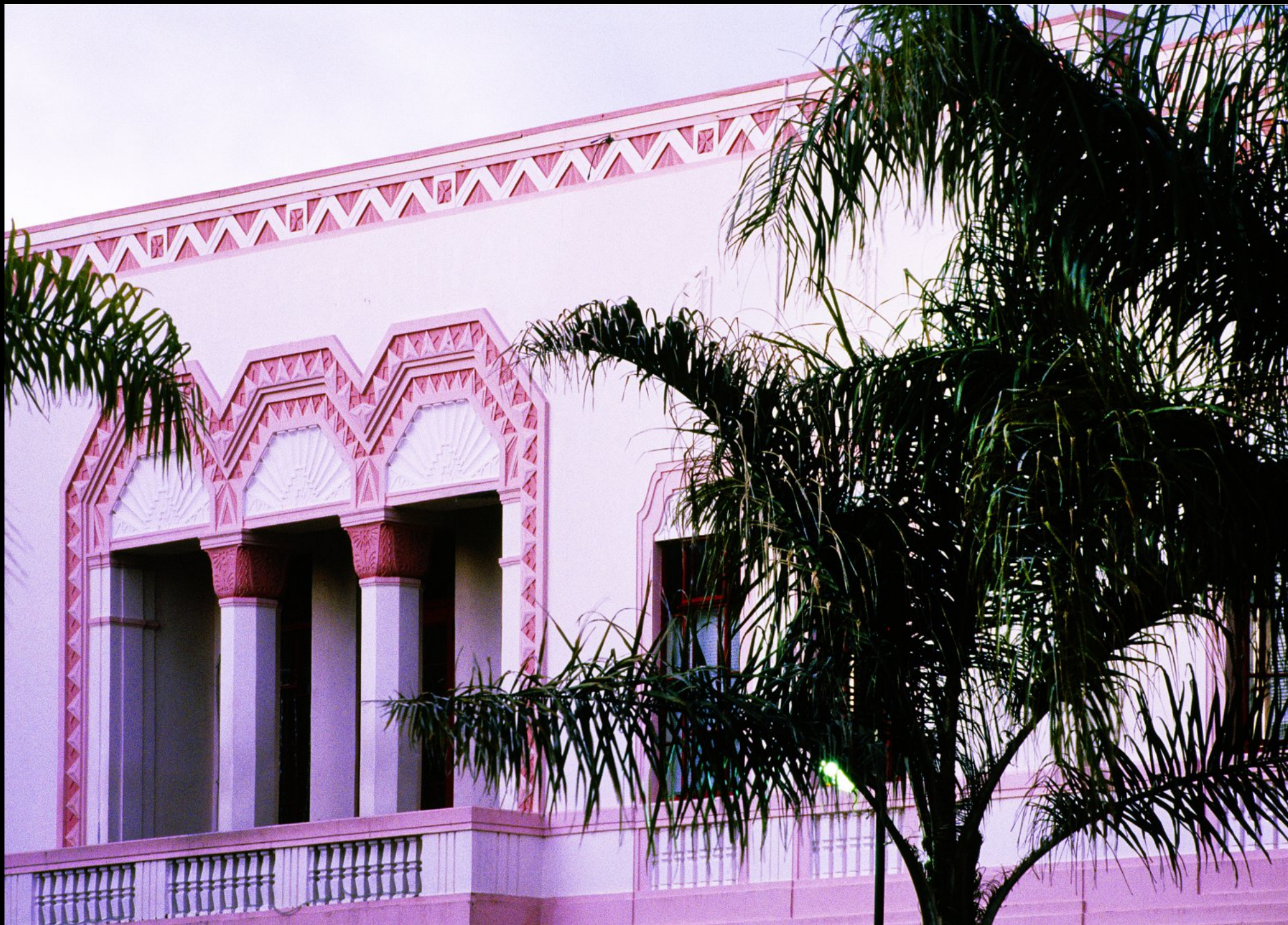
Art Deco Haus "Hotel Central"