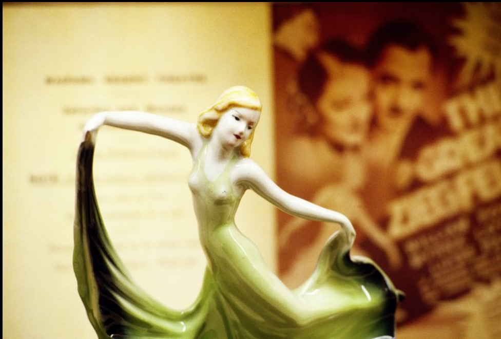
Art Deco Statue im Erdbeben Museum