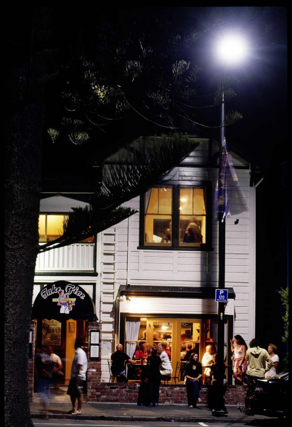
Lokal an der Marine Parade