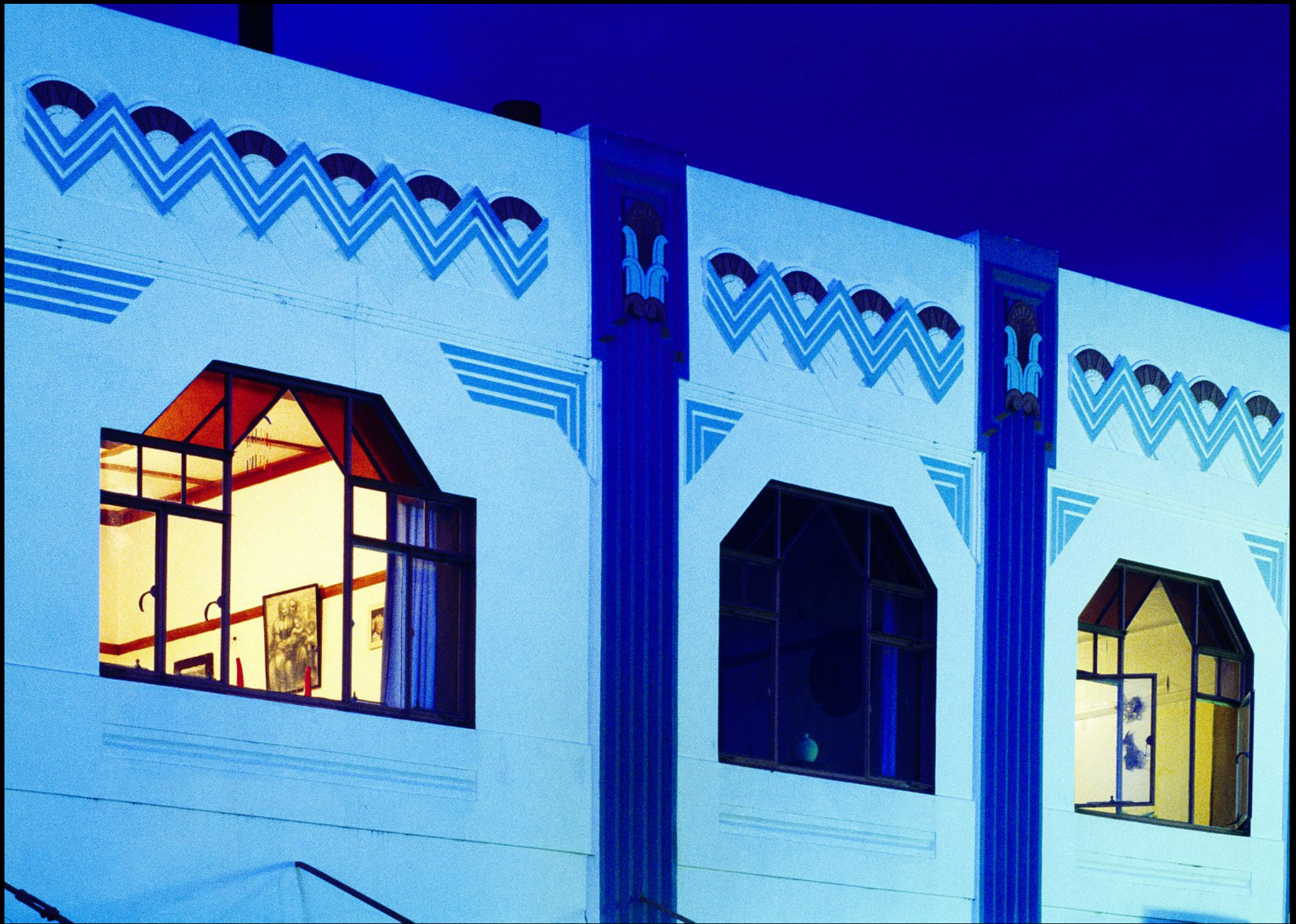
Art Deco Haus an der Emerson Street