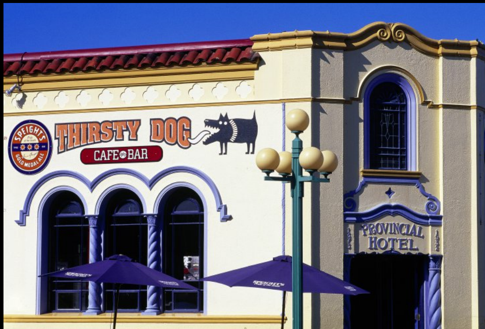
Art Deco Haus (Restaurant "The Fat Dog")