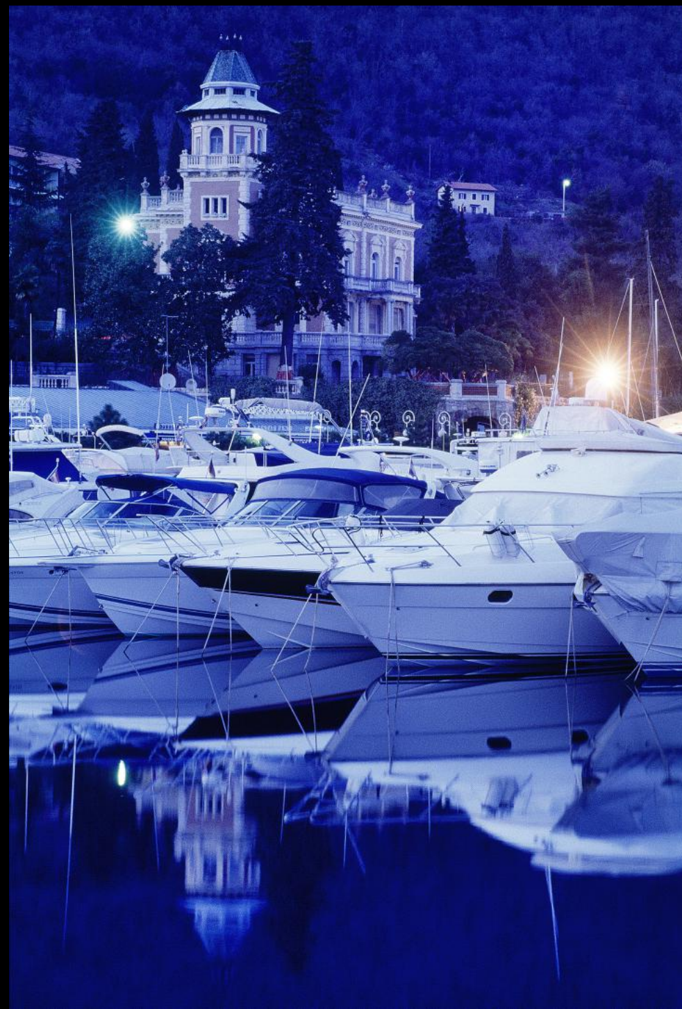
Villa Münz und Yachthafen