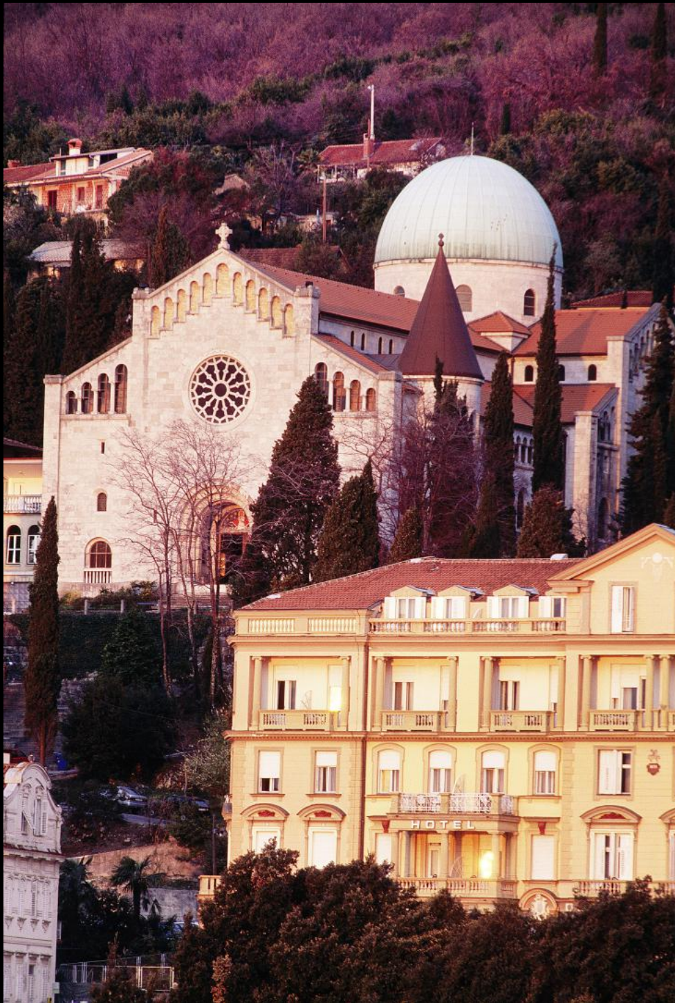
Jugendstil-Kirche "Kirche der Ankündigung"