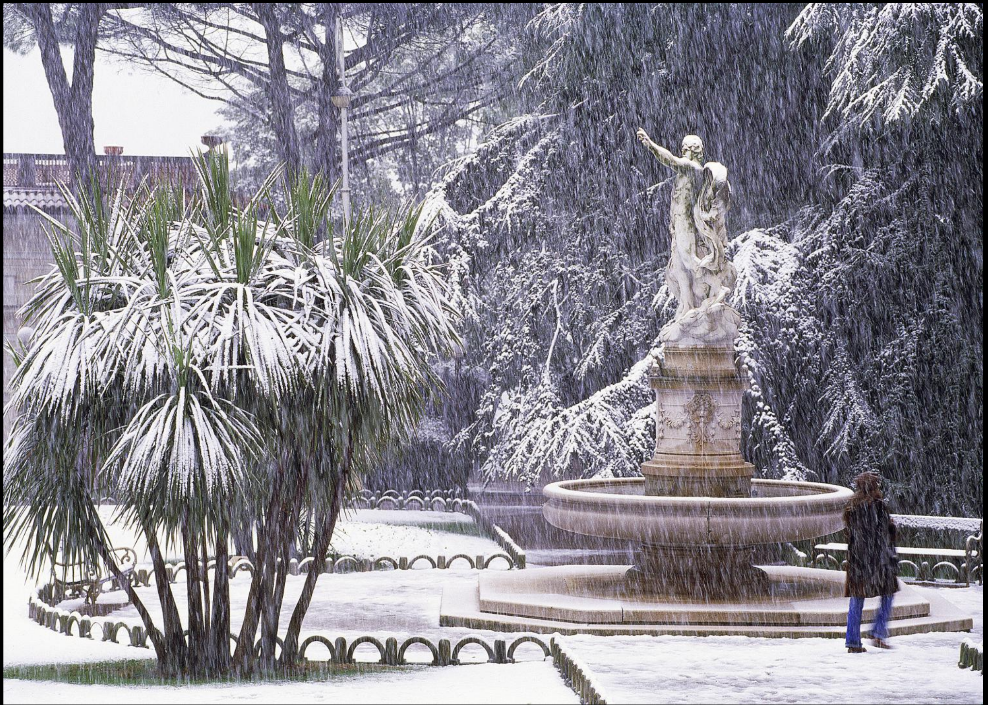
schneebedeckter Brunnen im Park von Hotel Millenium