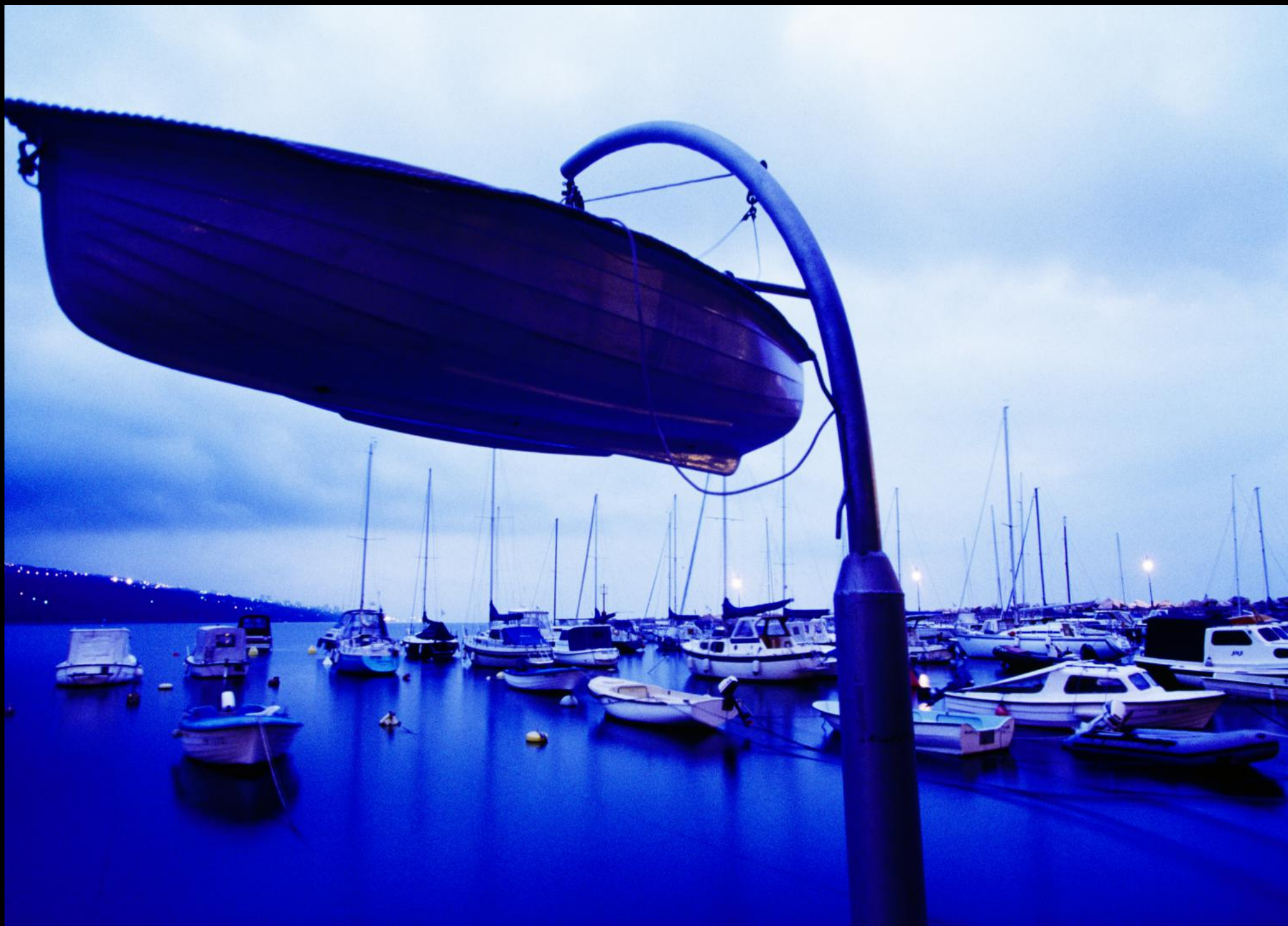
Opatija (Abbazia): typisch für den Hafen sind die auf Kränen hochgezogenen und geparkten Boote