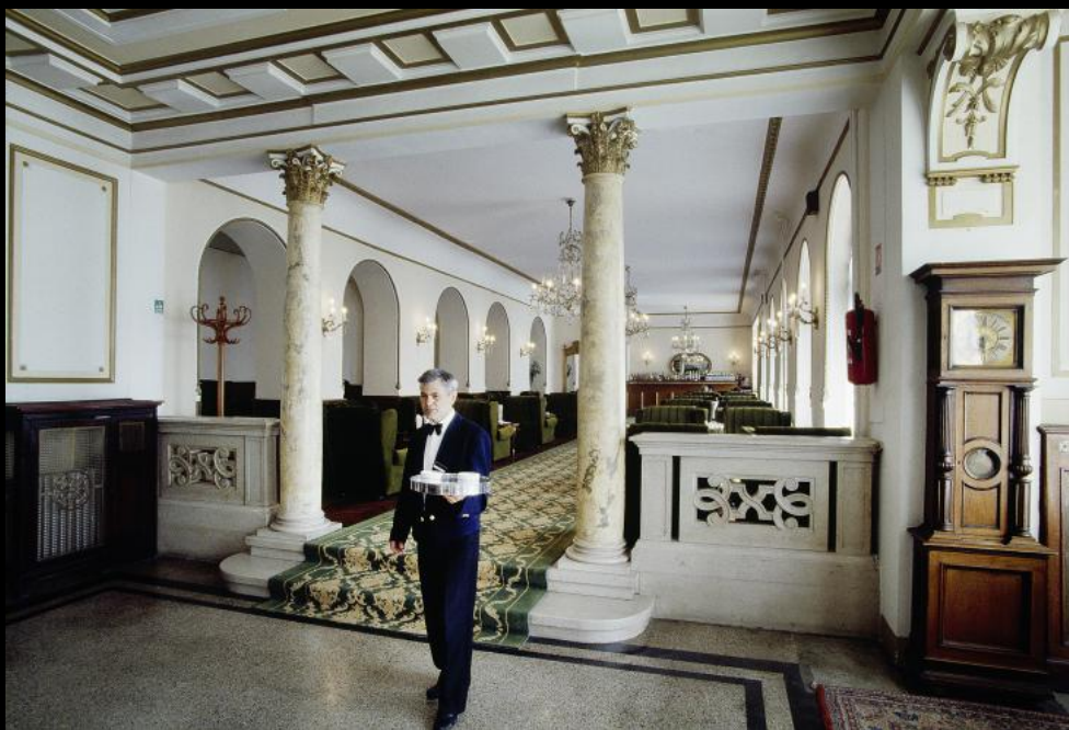
Kellner in der Aula des Hotel Bristol