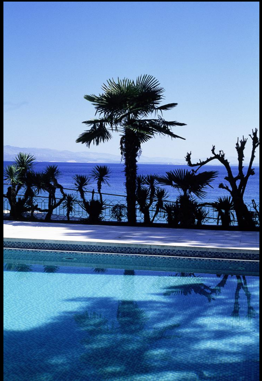
Swimming Pool von Hotel Kvarner und Blick auf das Učka-Gebirge