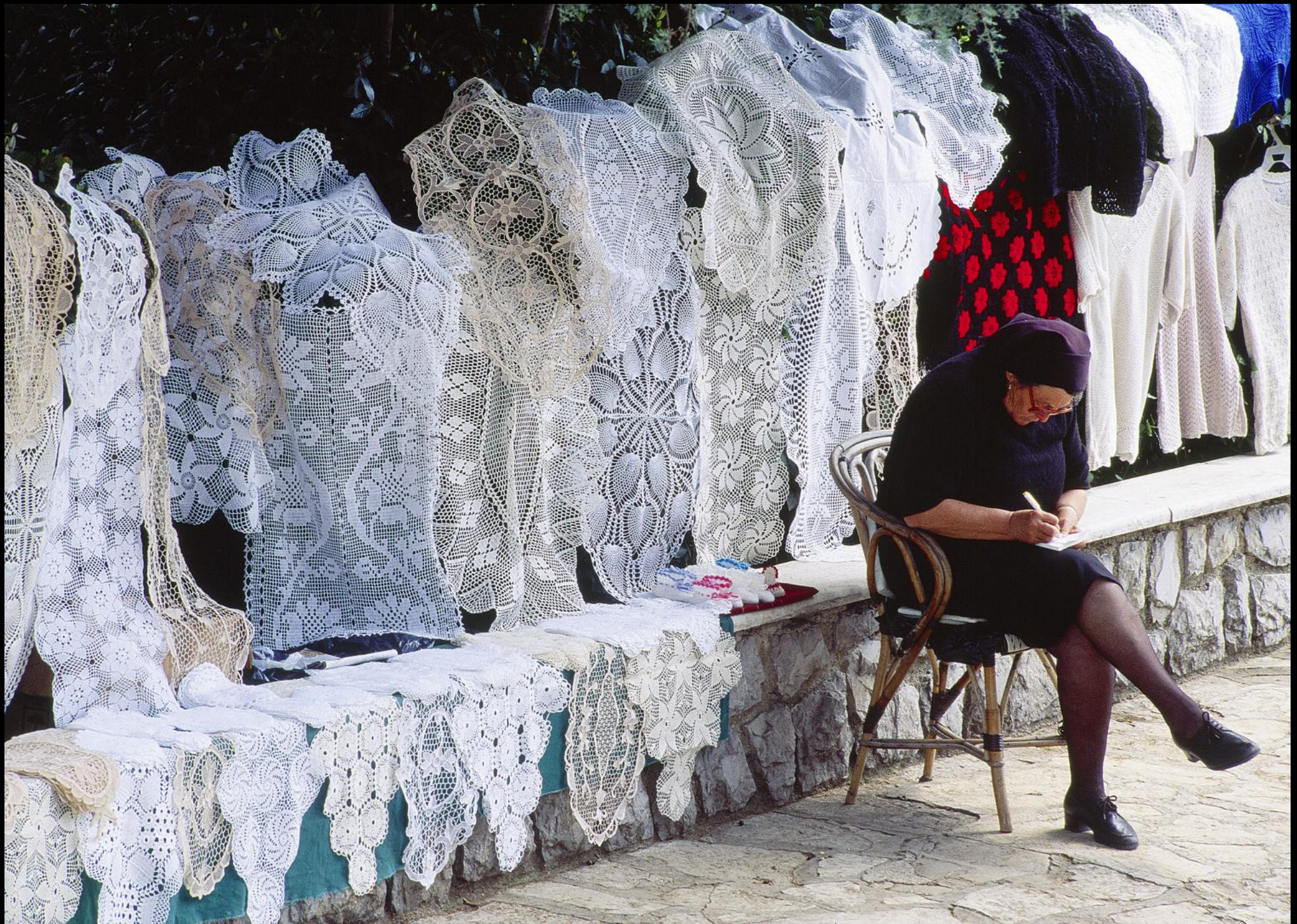
Strassenverkauf von handgehäkelten Tischdecken