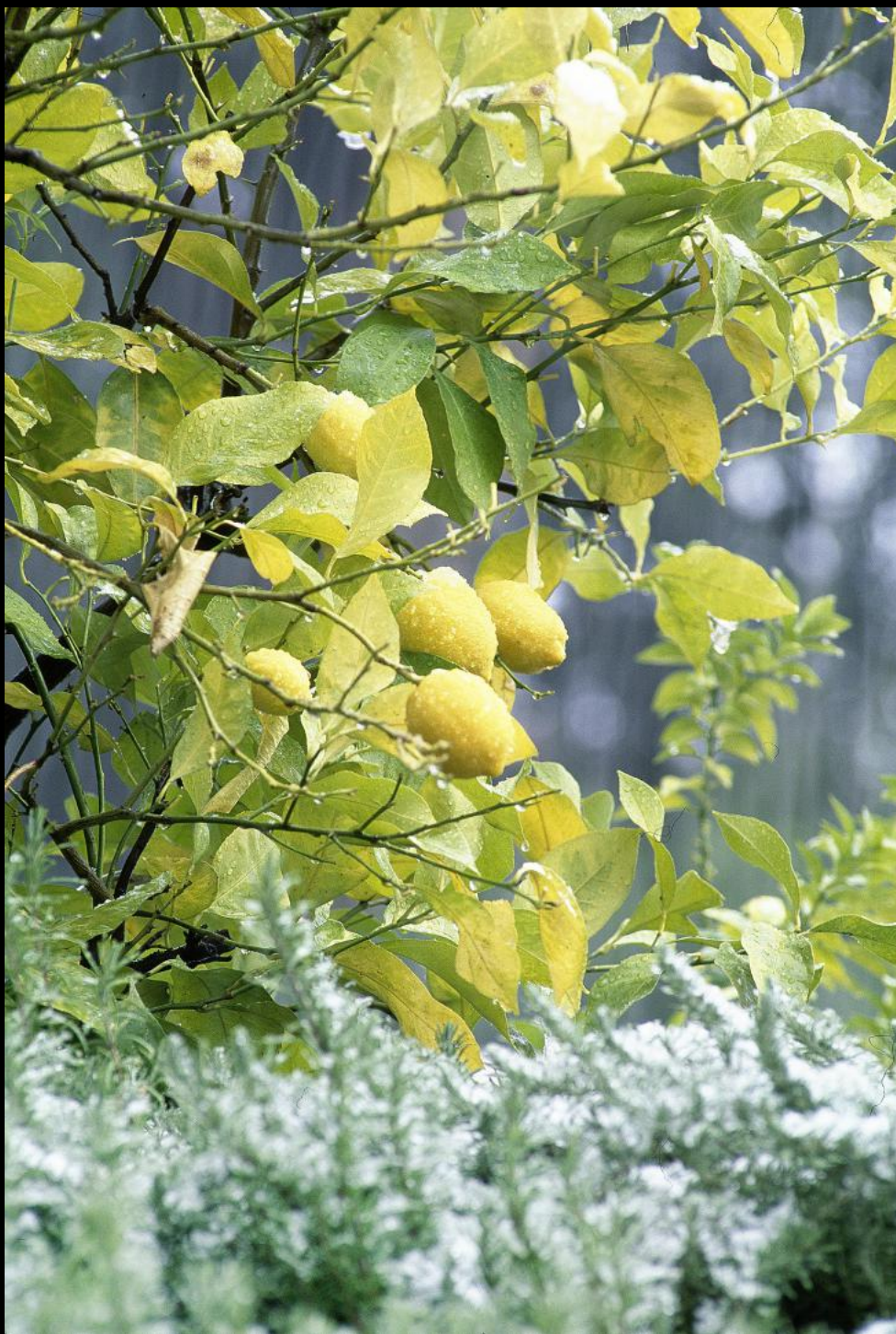
schneebedeckter Zitronenbaum im Angiolina Park