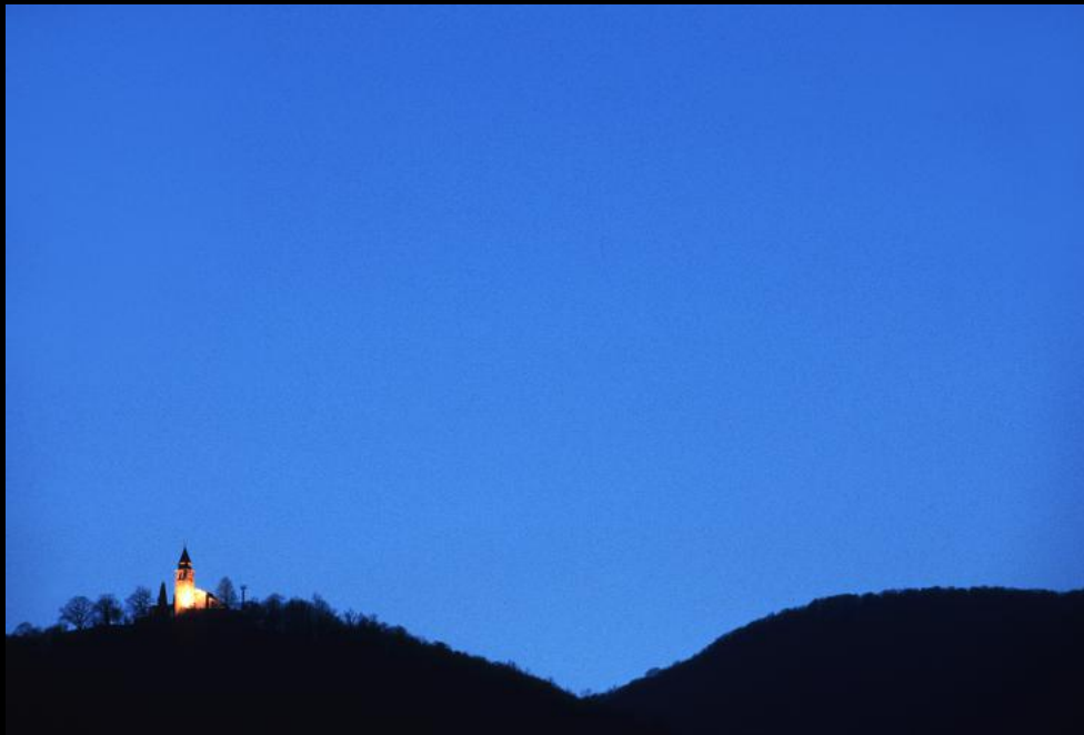
Kirche auf einer Anhöhe des Učka Gebirges