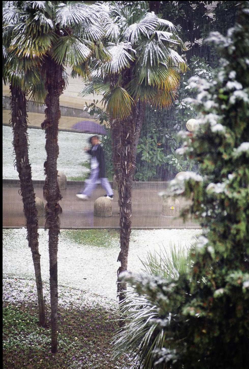
Spaziergänger im Park von Hotel Millenium