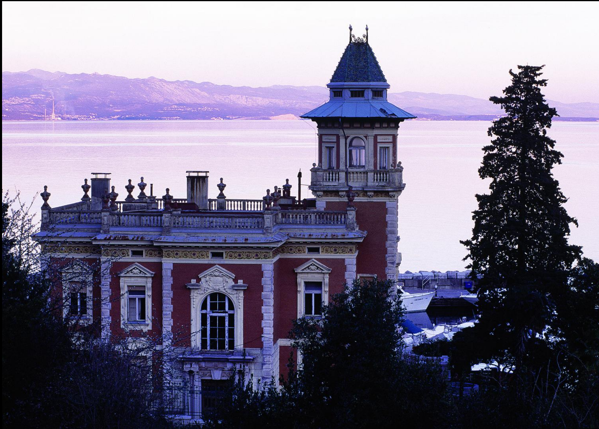
Villa Münz und Yachthafen mit der Kvarner Bucht und dem Učka Gebirge