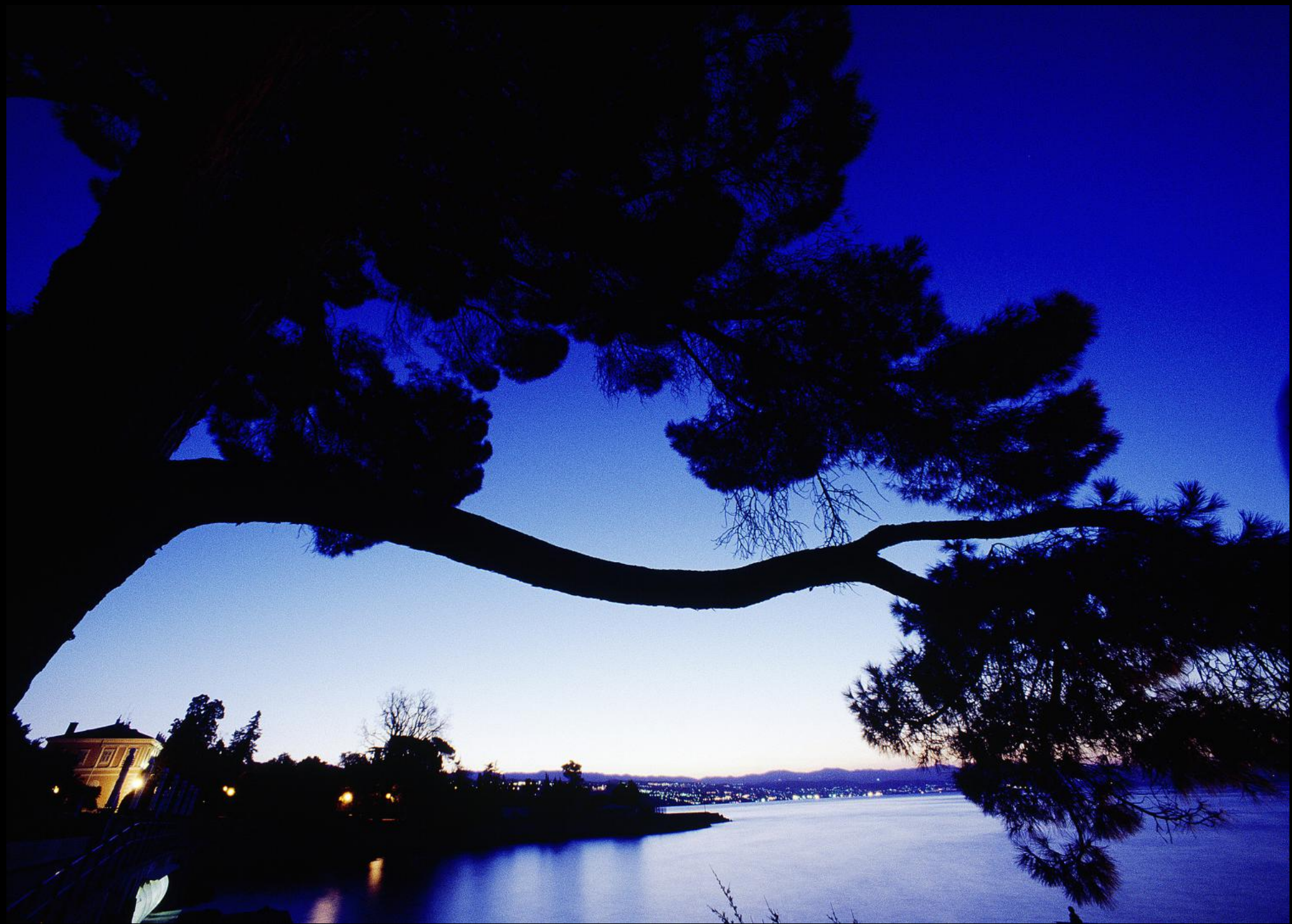
Hotel Kvarner an der Uferpromenade