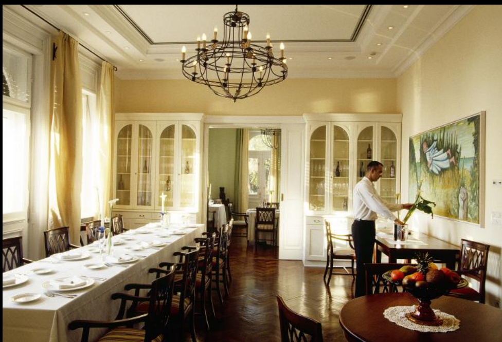
Kellner im Speisesaal von Villa Astra