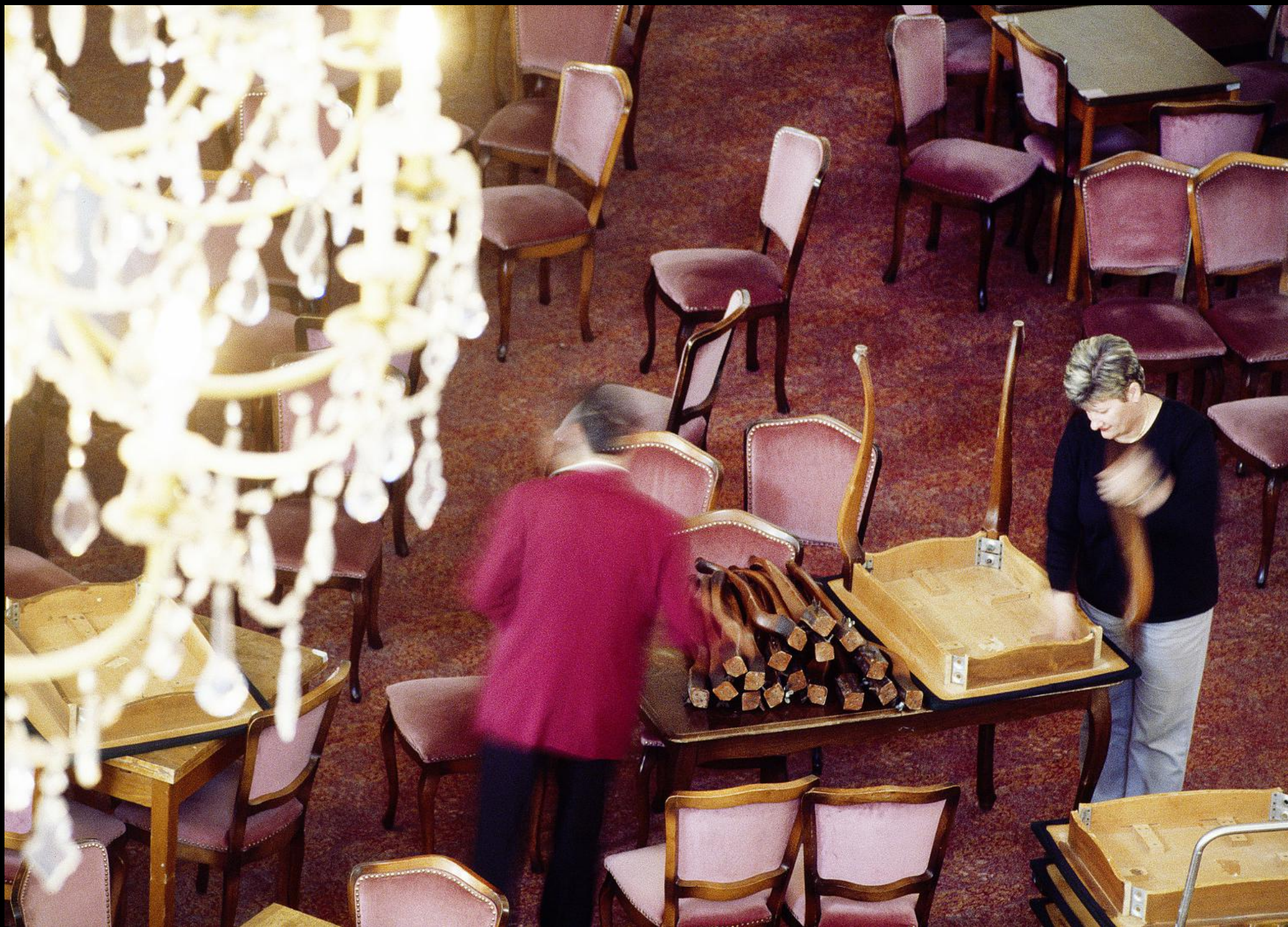
Servicearbeiten an den Sesseln des Hotel Kvarner