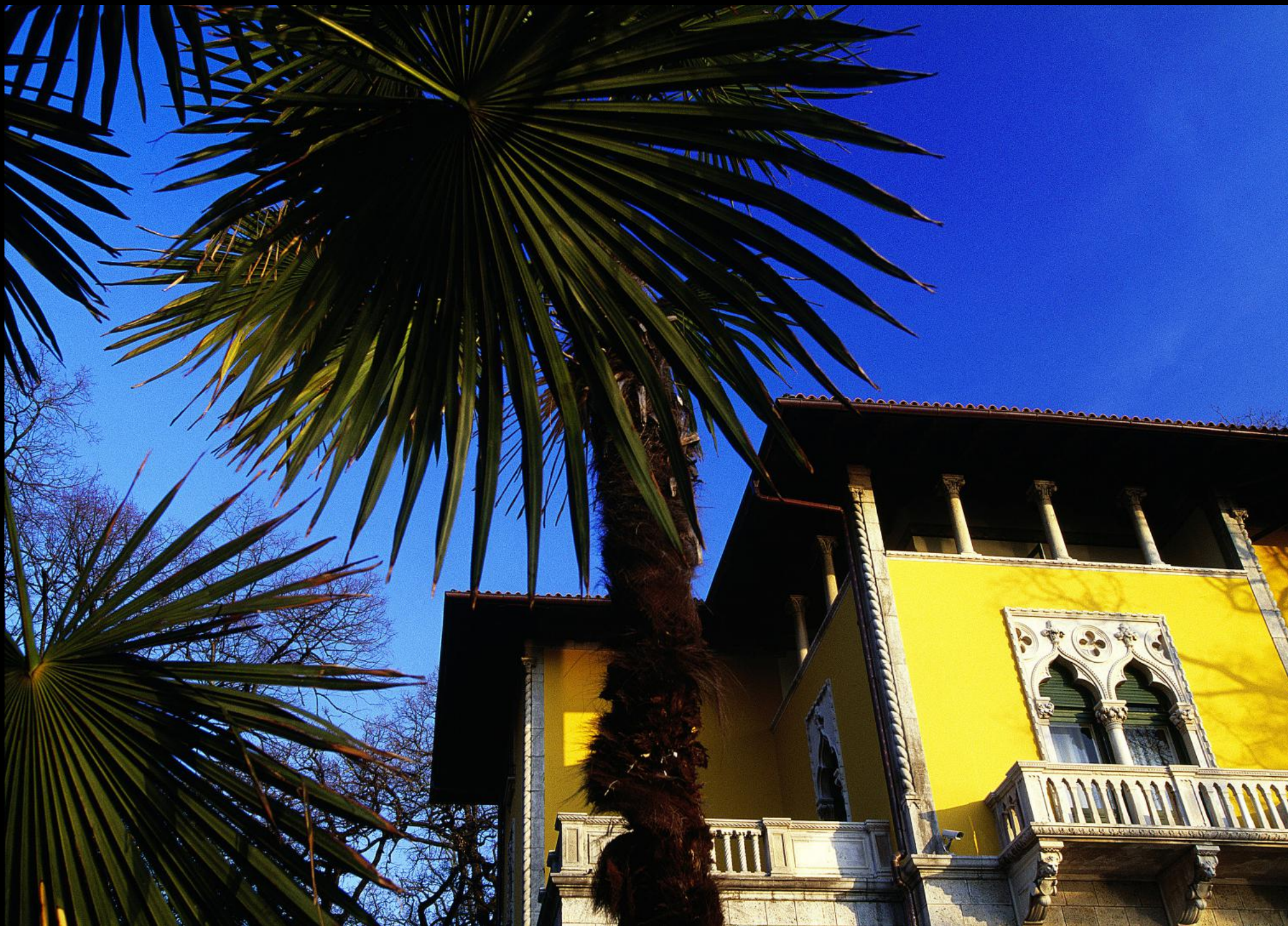
Villa Astra an der Uferpromenade