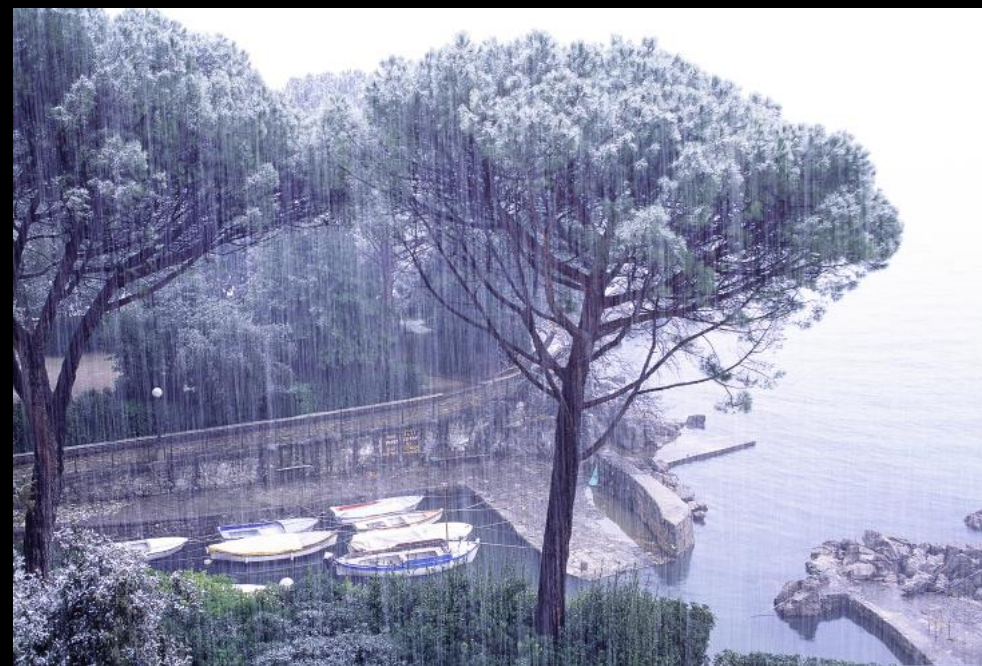
Boote an der Uferpromenade