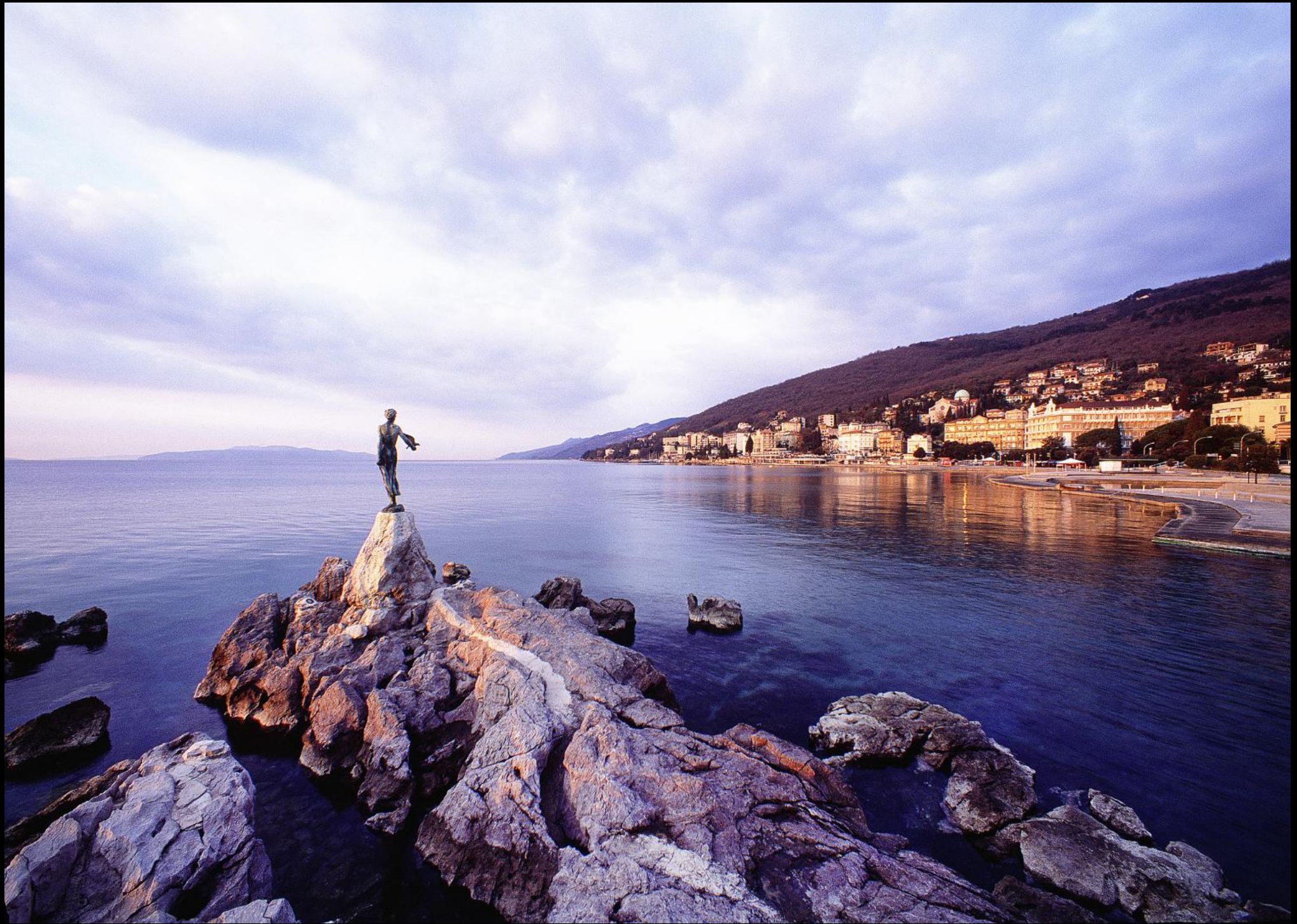
Skulptur "Mädchen mit der Möwe" an der Uferpromenade von Opatija (Abbazia)