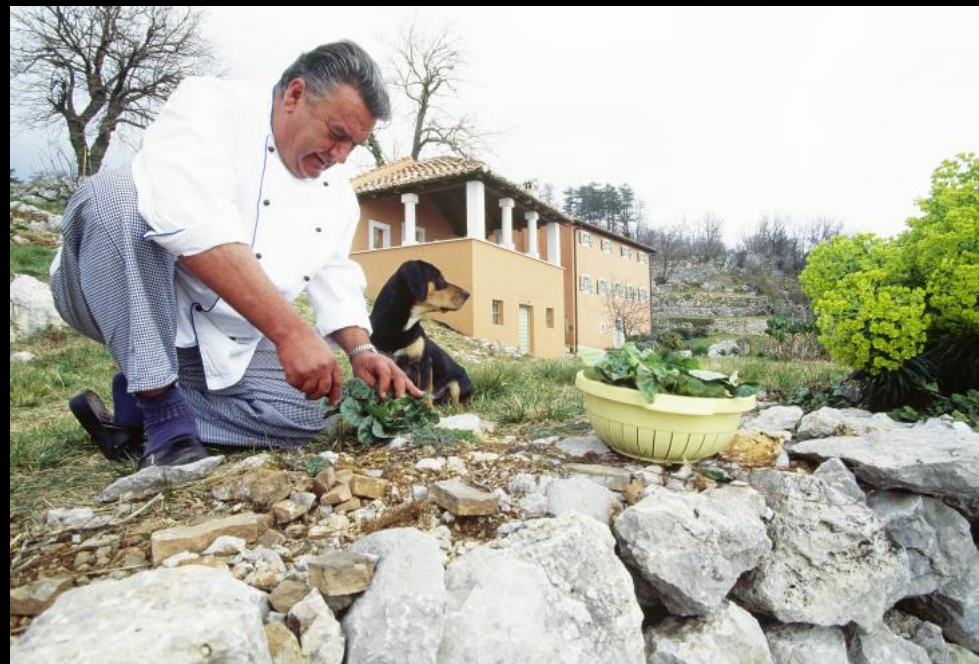
Koch beim Ernten von Küchenkräutern bei Landhaus Oraj