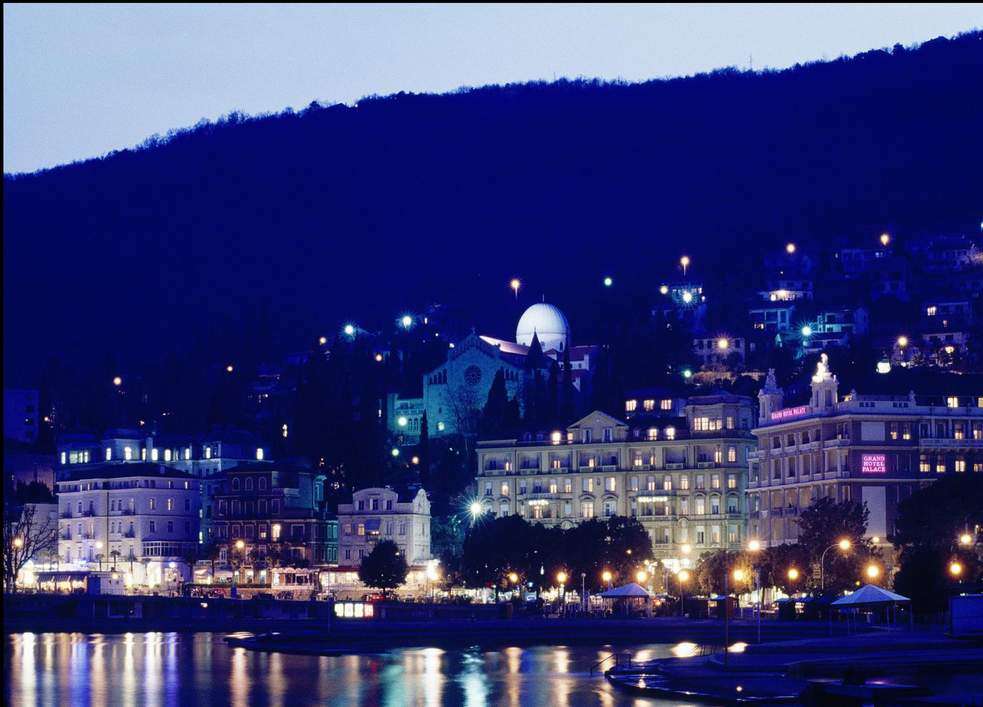
Opatija (Abbazia) und Hafen