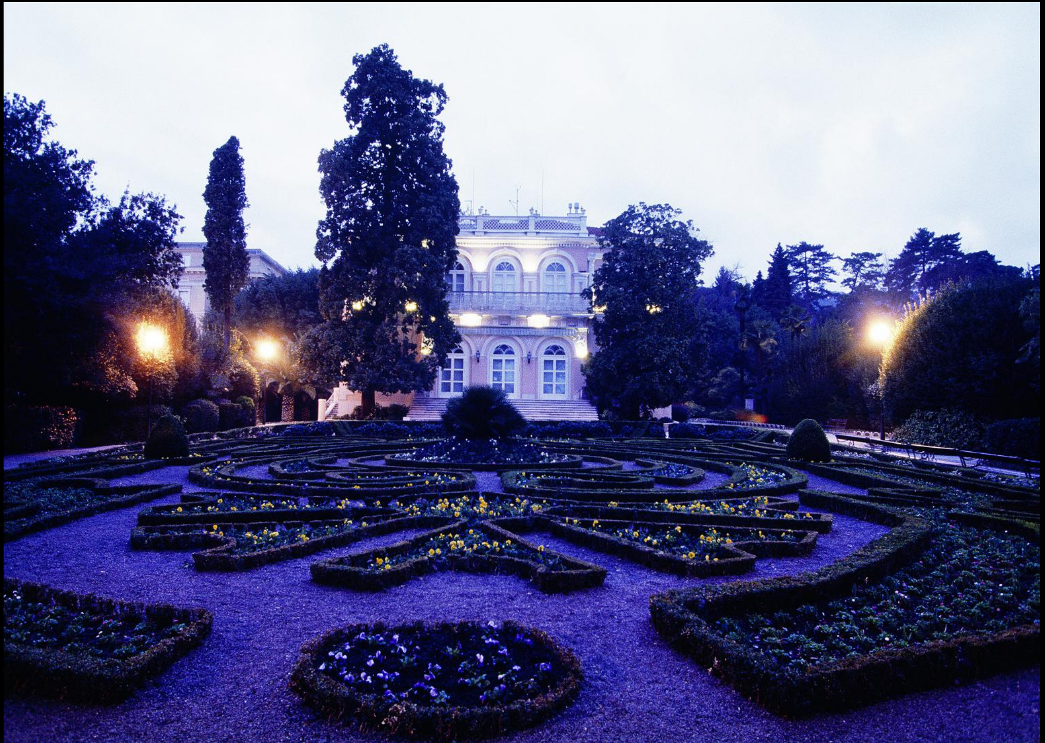
Villa Angiolina und Angiolina Park in Opatija (Abbazia)