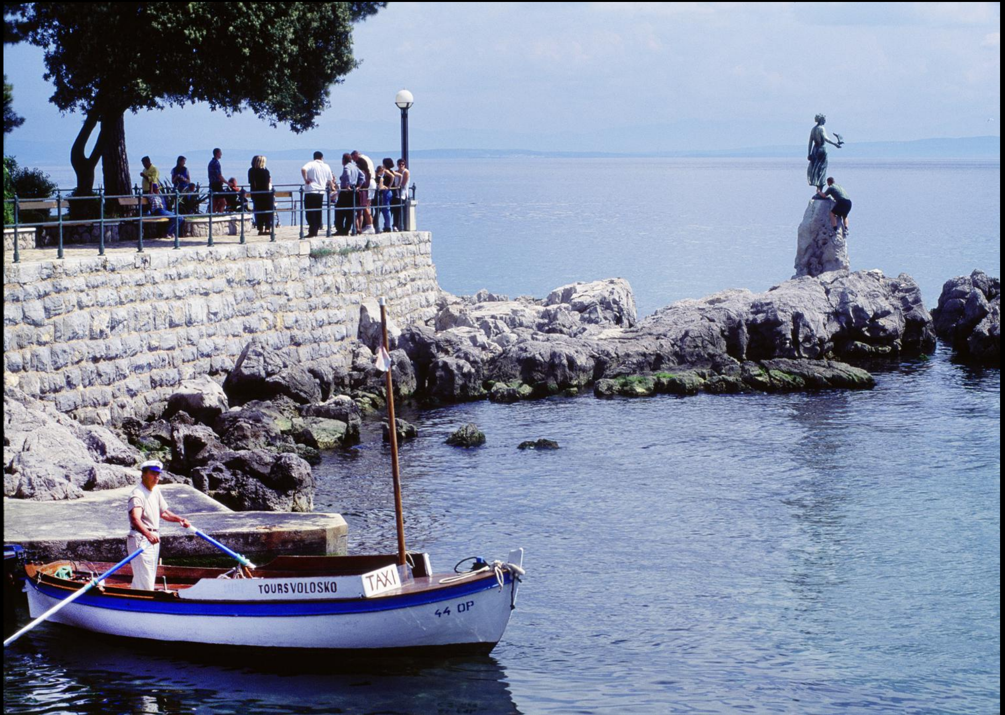
Ausflugs-Boot in einer kleinen Bucht bei der Villa Angiolina