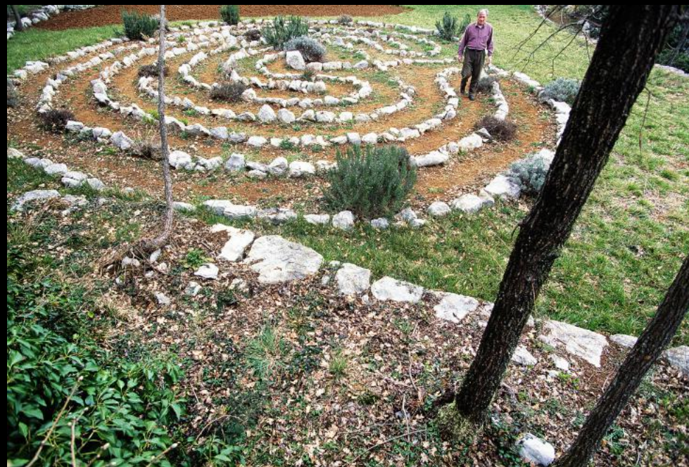
Besucher begeht das Labyrinth im Park von Landhaus Oraj