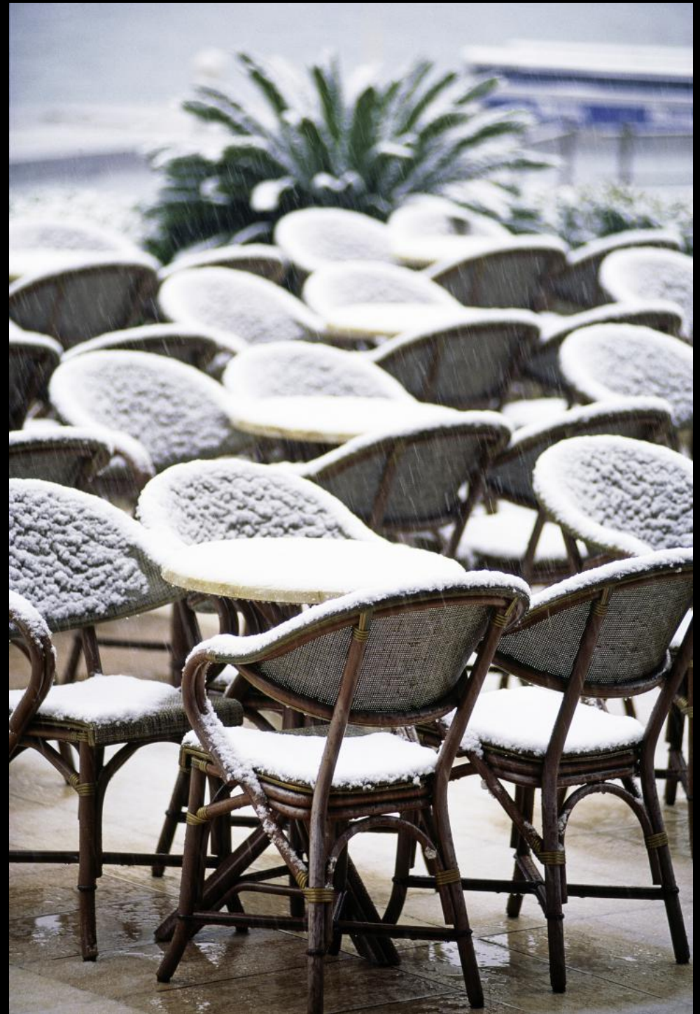
Sessel auf der Terrasse des Hotel Millennium