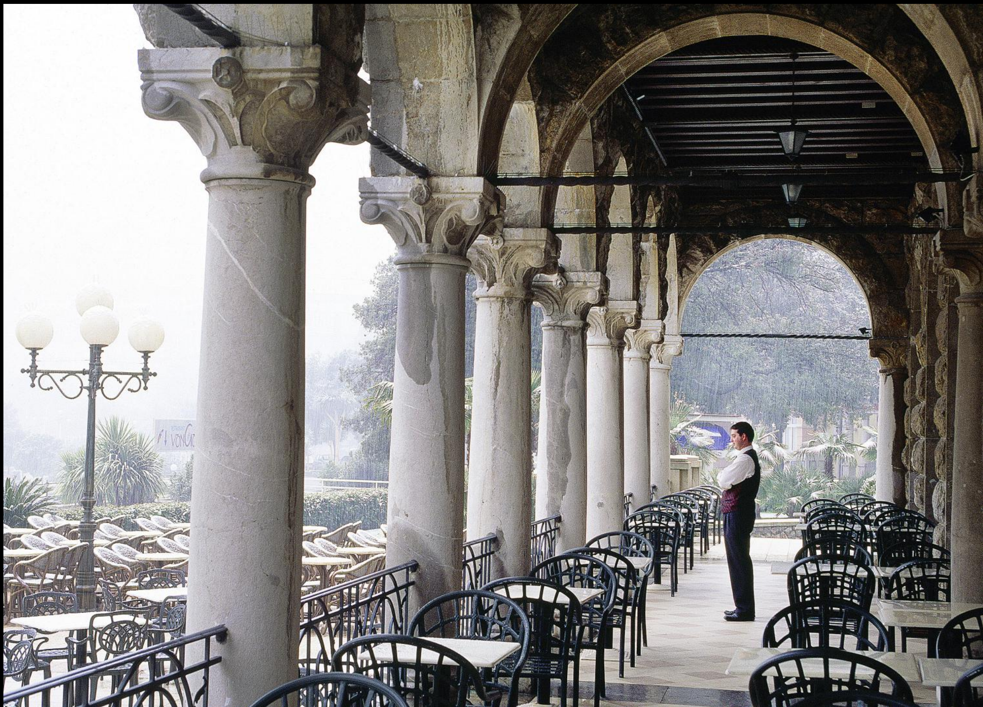
Kellner auf der Terrasse des Hotel Millenium