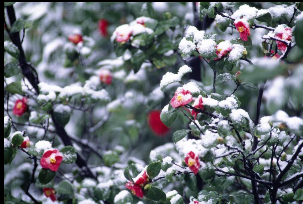
Kamelienbaum im Angiolina Park