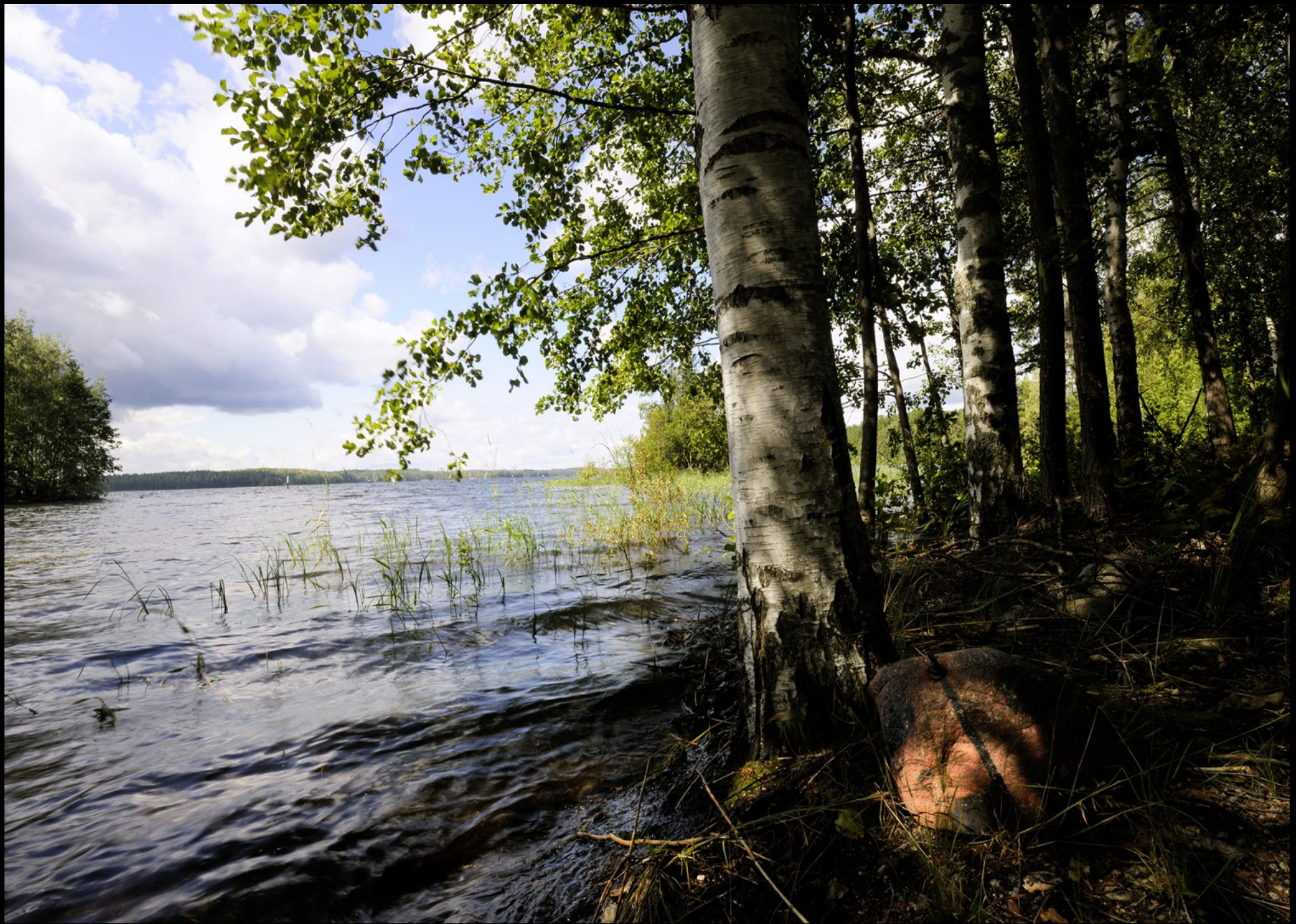
roter Ankerstein für Boote am See Pihlajavesi