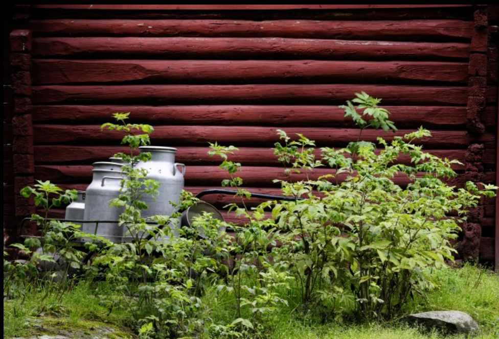
Milchkannen an der schwedenroten Holzwand einer Scheune