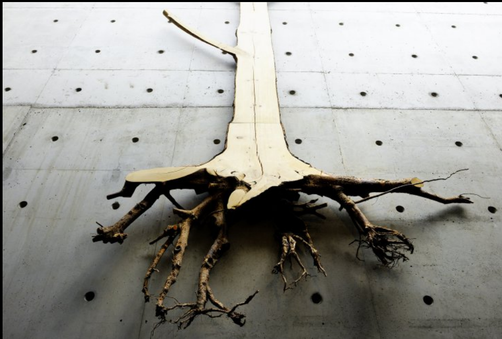
Kunst aus Holz im Finnischen Forstmuseum Lusto bei Punkaharju