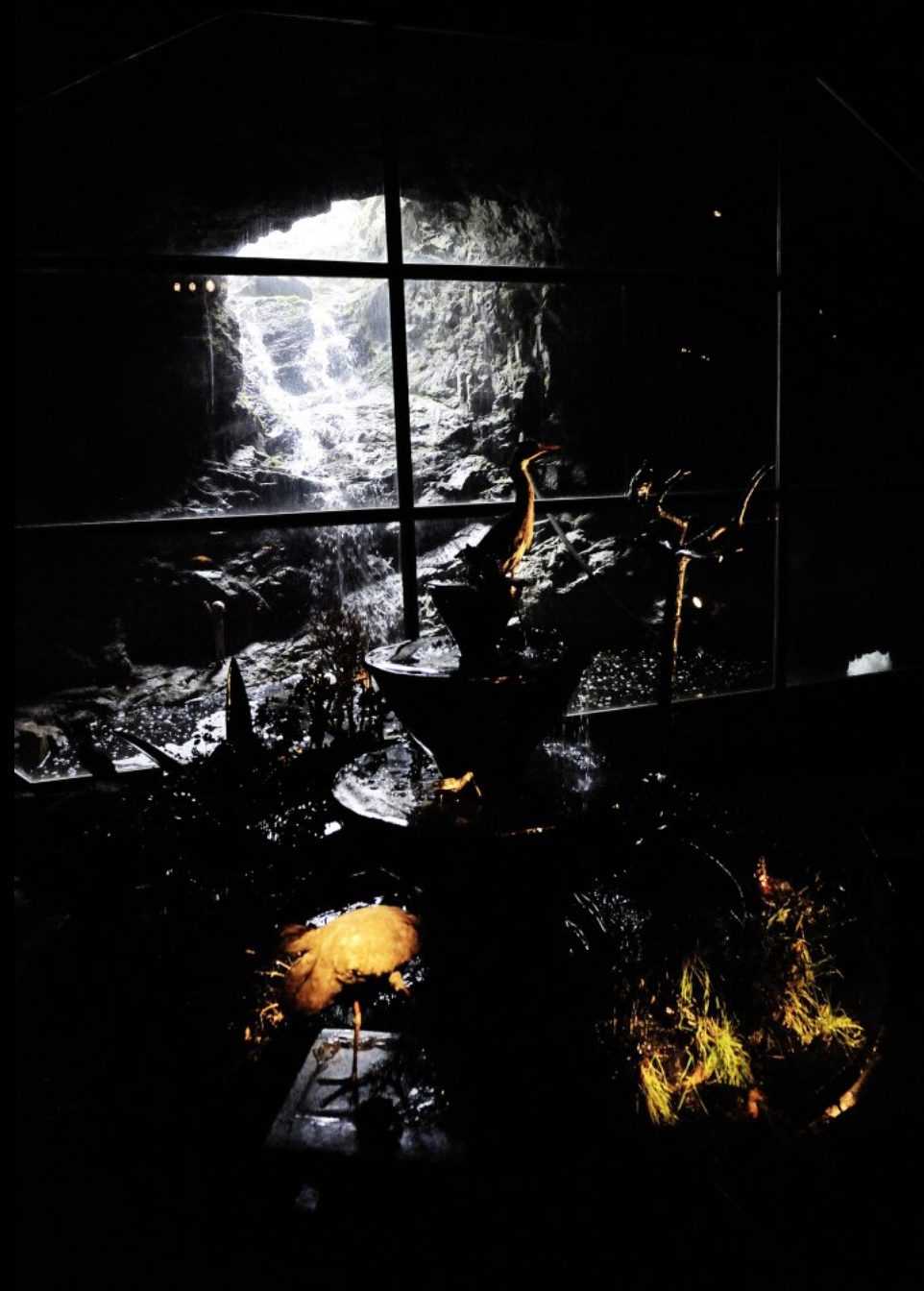
Ausstellung im unterirdischen Retretti Museum