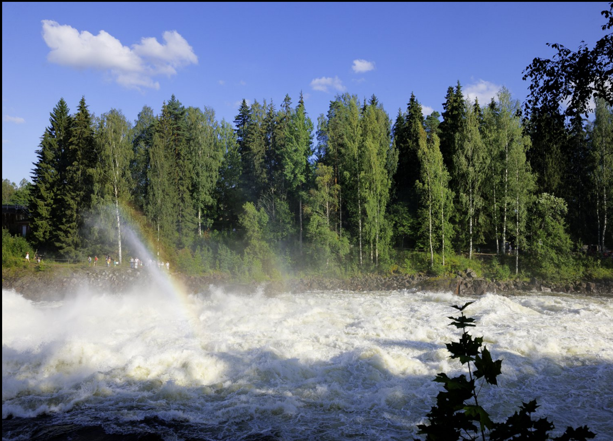
Imatra: Wasserfall des Vuoksi Flusses