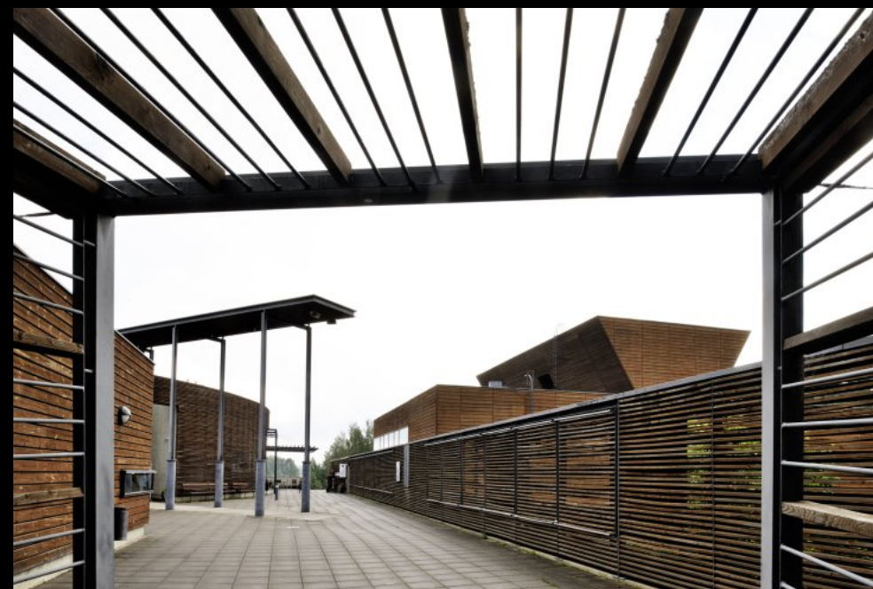
Eingang und Hauptfassade des Lusto (Finnisches Forstmuseum)