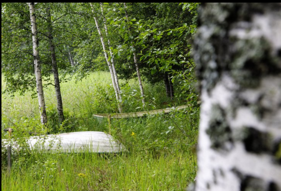
Unterseite eines hölzernen Ruderbootes