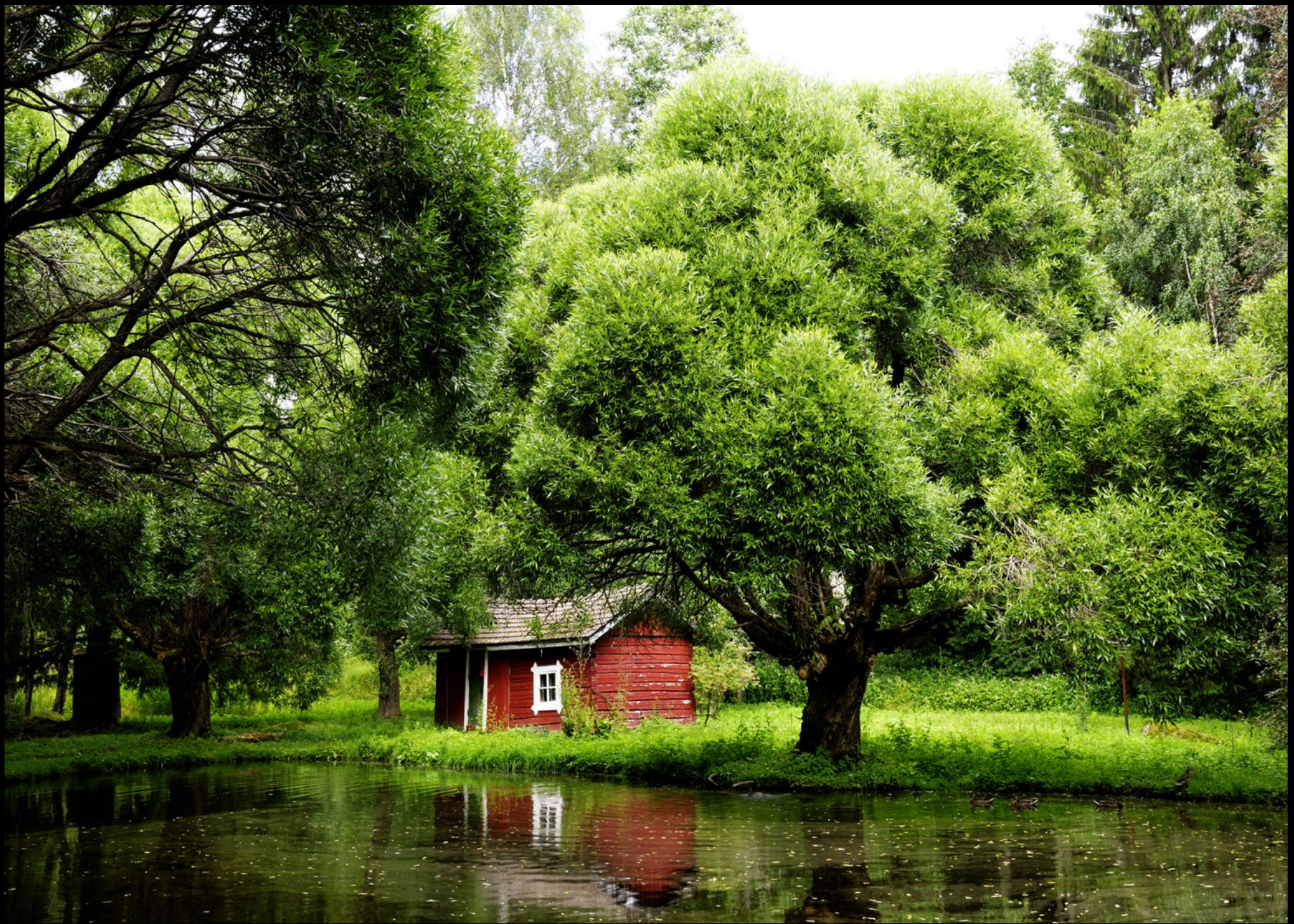
rotes Blockhaus am See und kugelig geschnittene Weiden