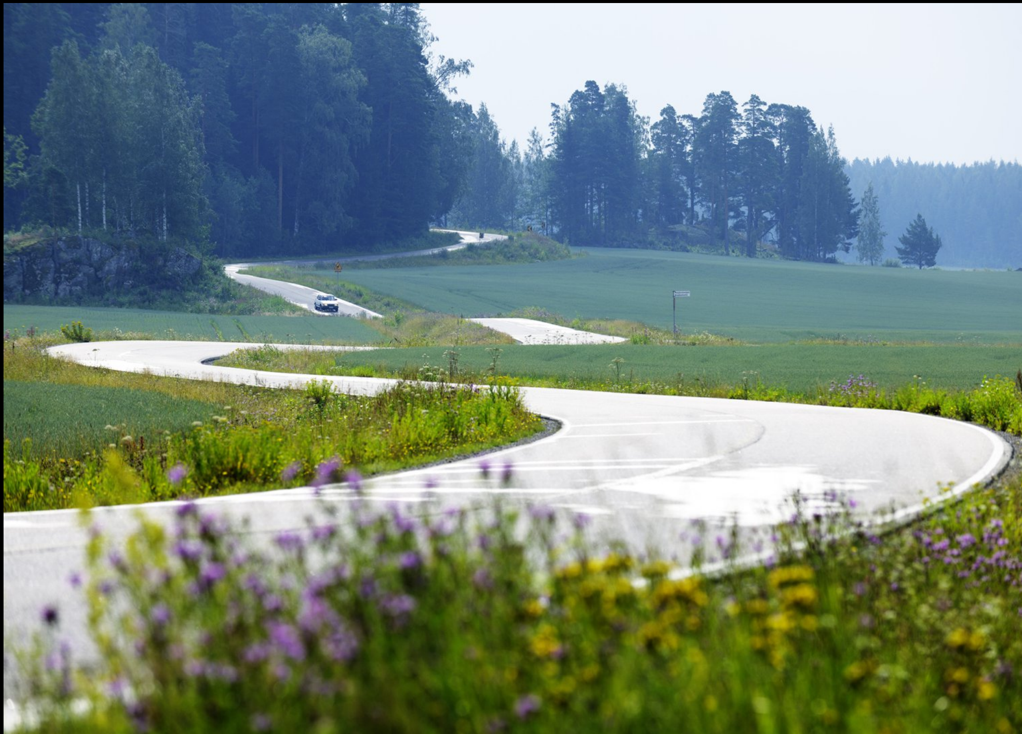
Landstrasse bei Kotka