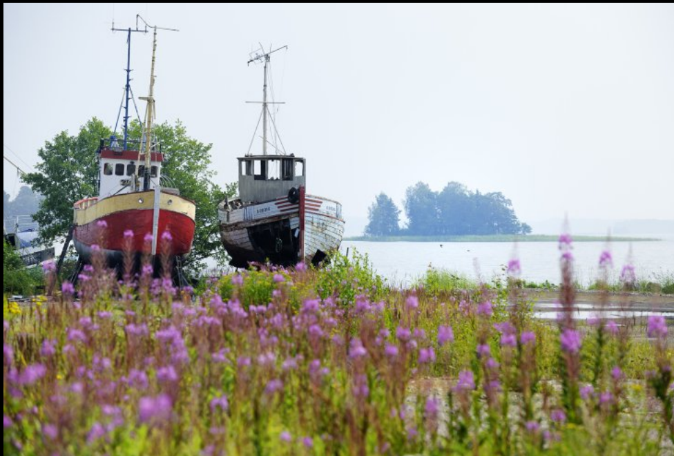
Schiffsfriedhof in Kotka