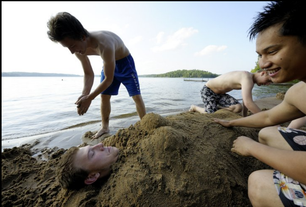
Burschen vergarben einander im Sand