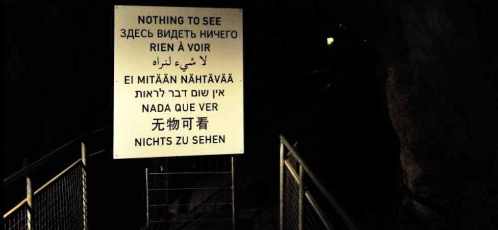
Hinweistafel zu einer Ausstellung im Retretti Museum