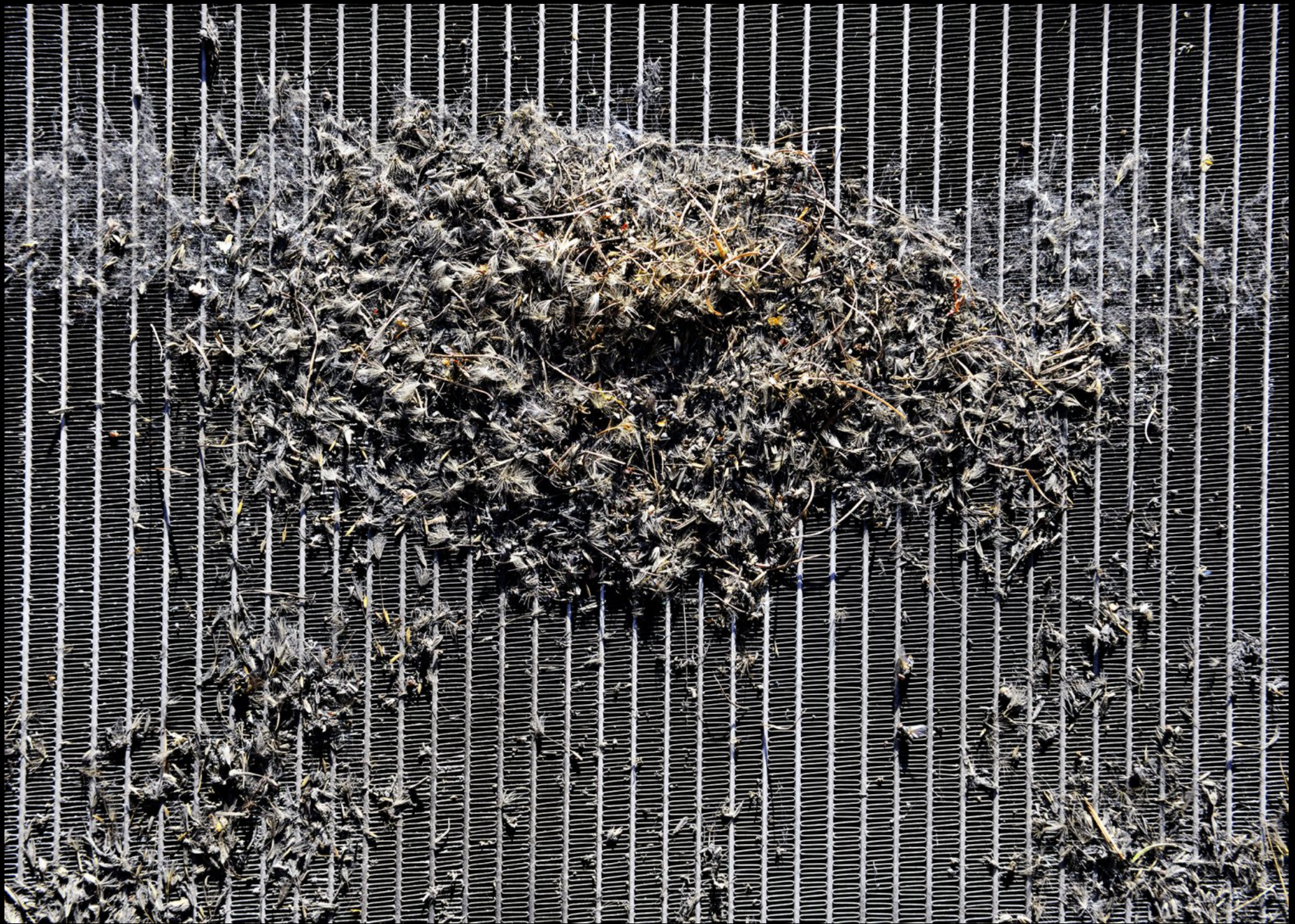
Insekten auf einem Auto-Kühler