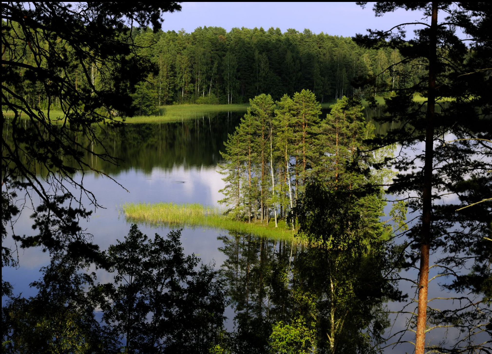
kleine Insel im See Pihlajavesi