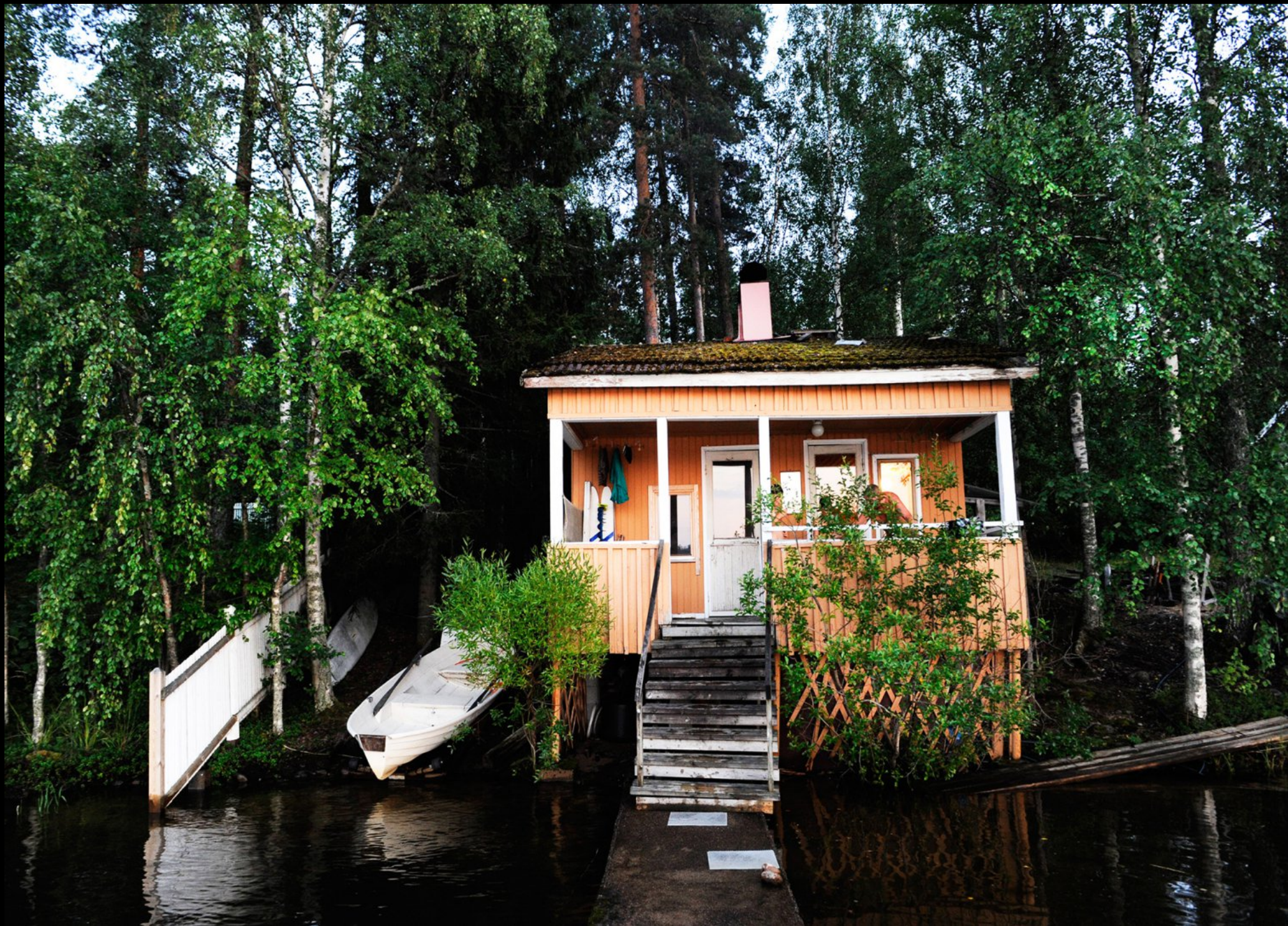
Sauna am Ufer des Saimaa Sees