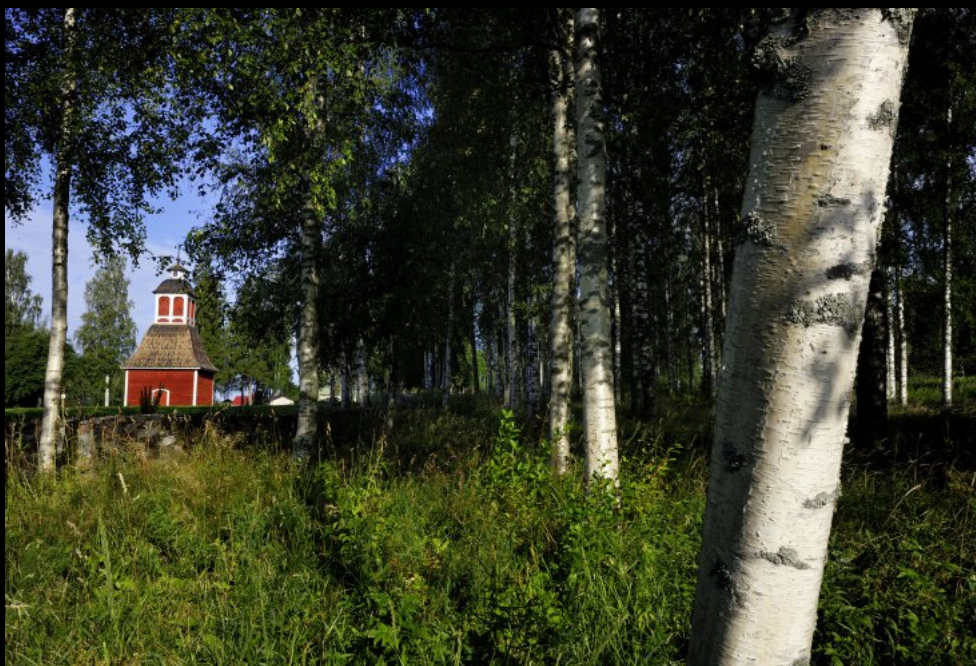
Kirche Kirkkoniemen kellotapuli und Birken im Park