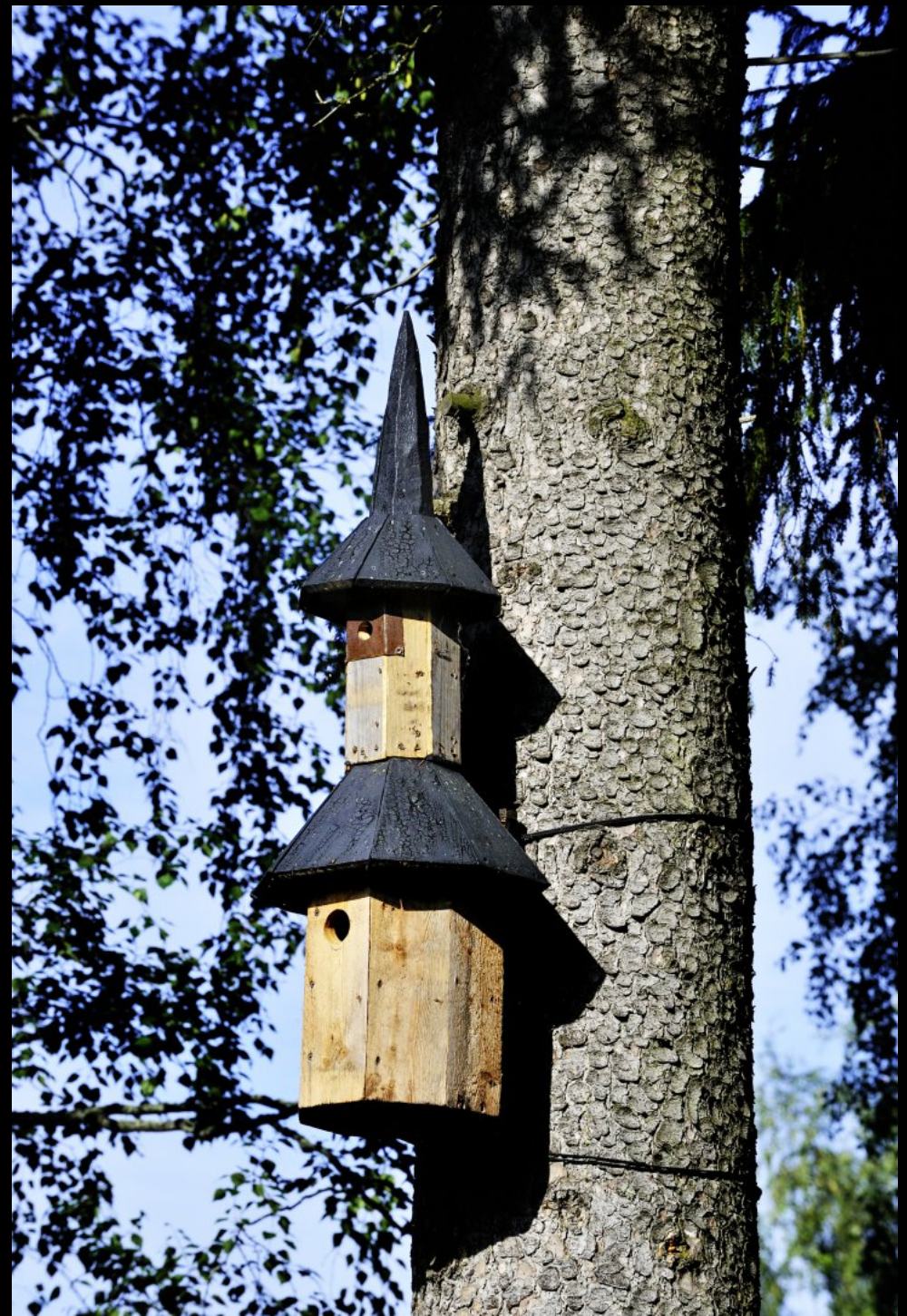
Vogelhaus im Garten der Kirche Kirkkoniemen kellotapuli