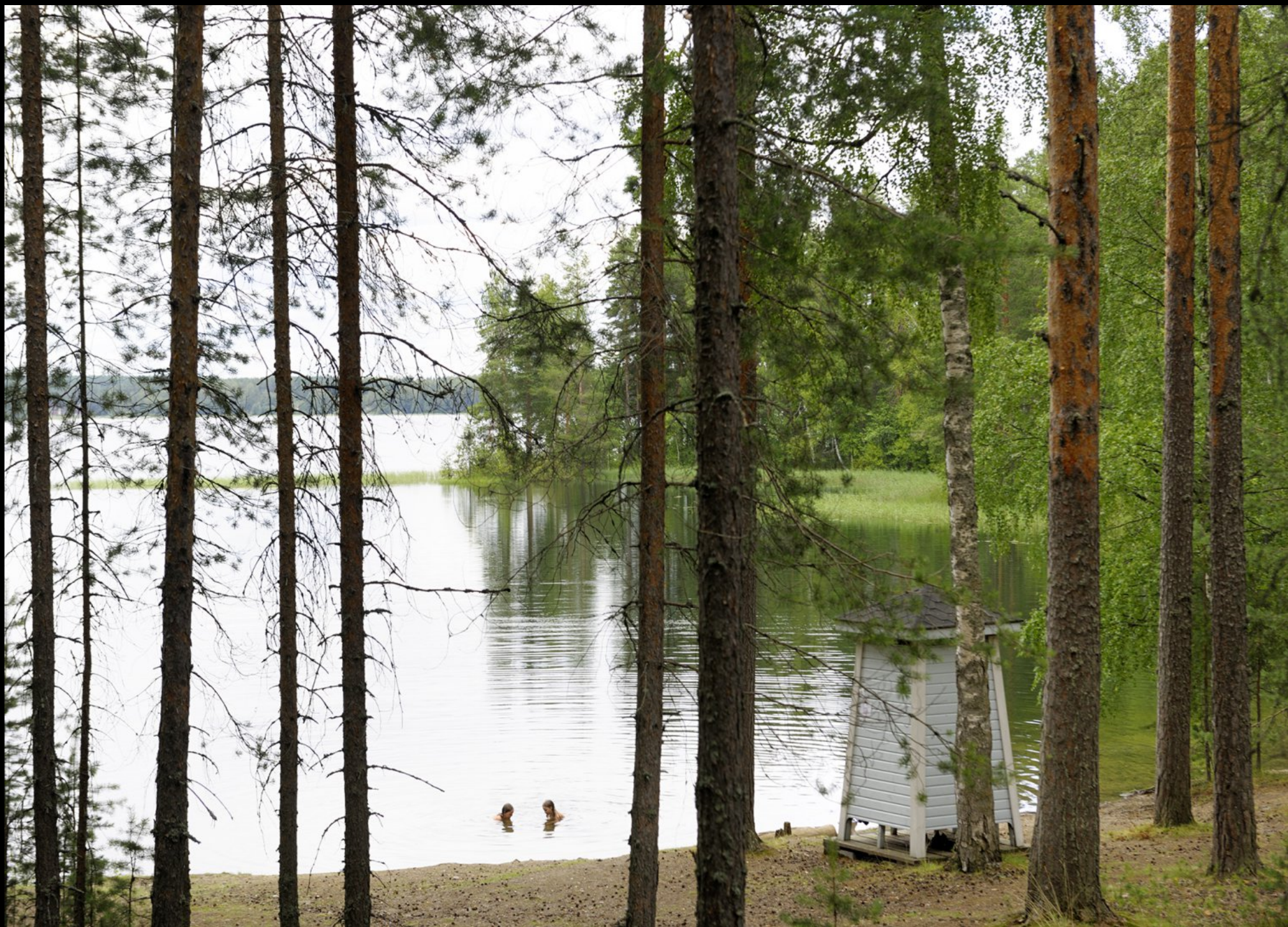
Umkleidekabine am See Pihlajavesi bei Punkaharju