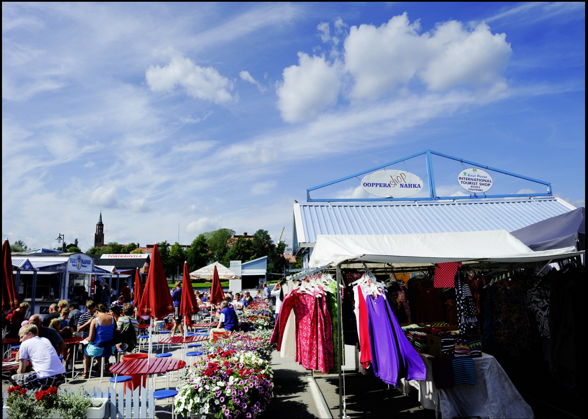
Savonlinna: Kleiderständer und Cafe am Wochenmarkt