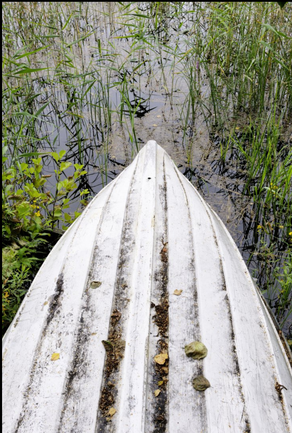
Rumpf eines Holz-Tuderbootes an einem Seeufer