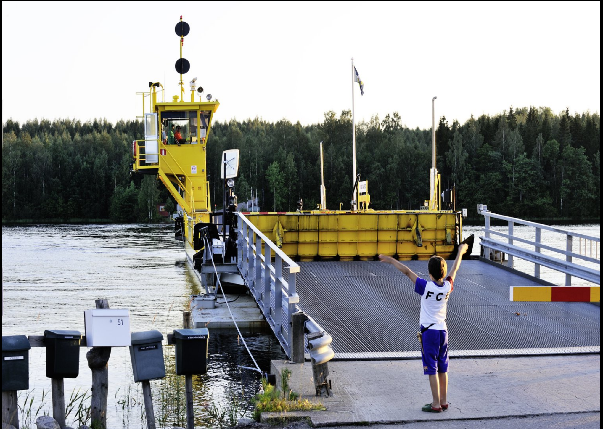
Schranke und Station der Autofähre auf die Insel Inkeroinen