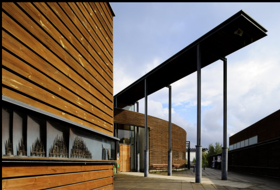
Eingang und Hauptfassade des Lusto (Finnisches Forstmuseum)