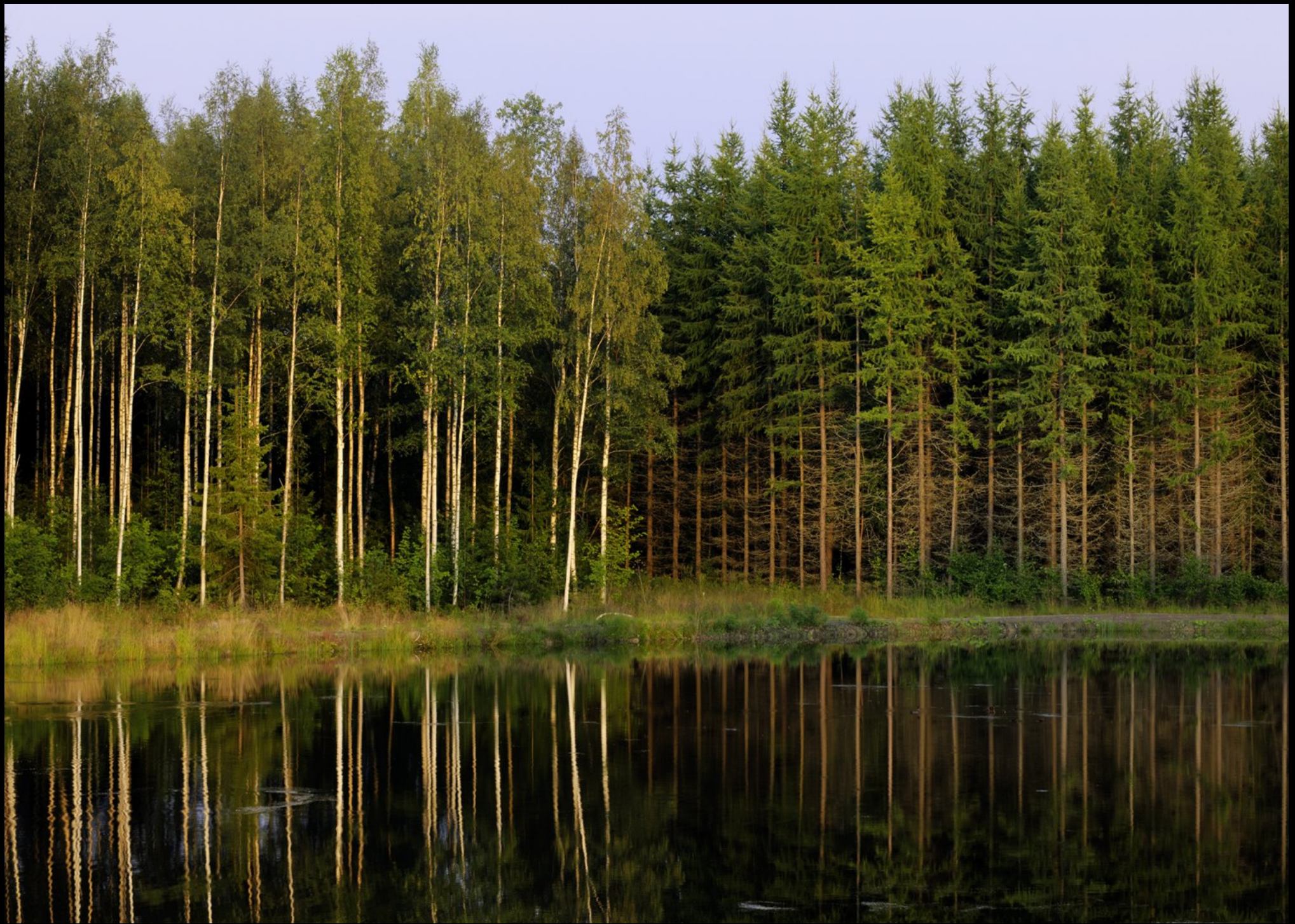
Birken und Nadelbäume am Ufer bei Kotka