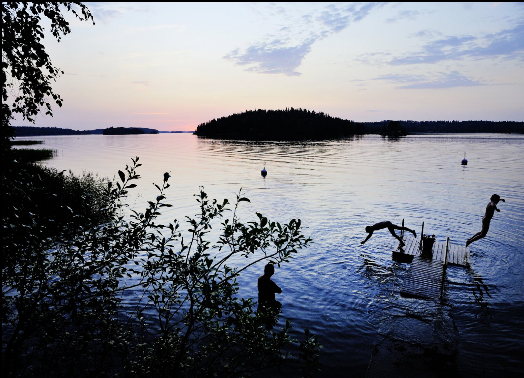
Baden nach dem Saunagang im Saimaa See bei Savonlinna