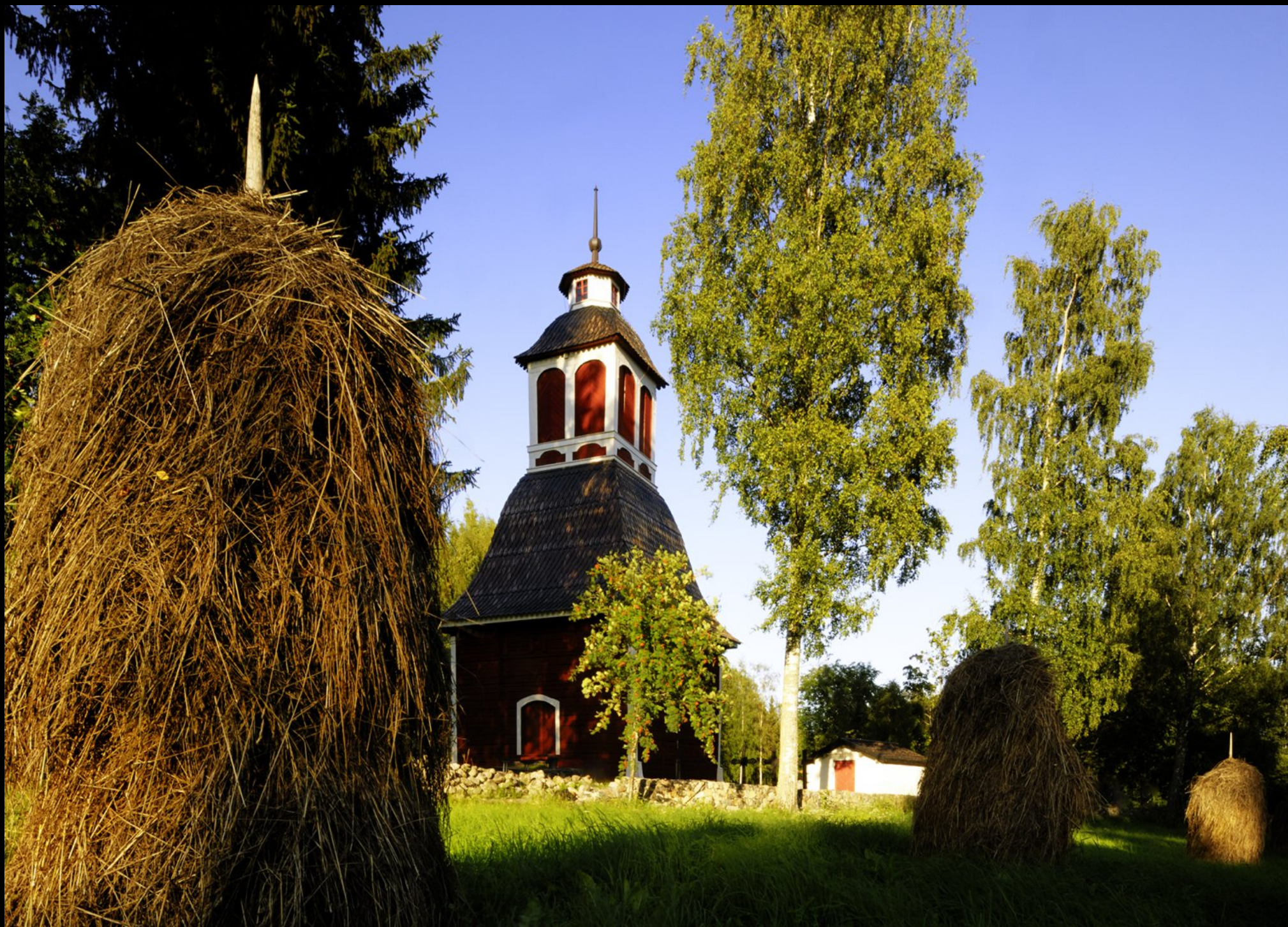
Kirche Kirkkoniemen kellotapuli und Heumandel