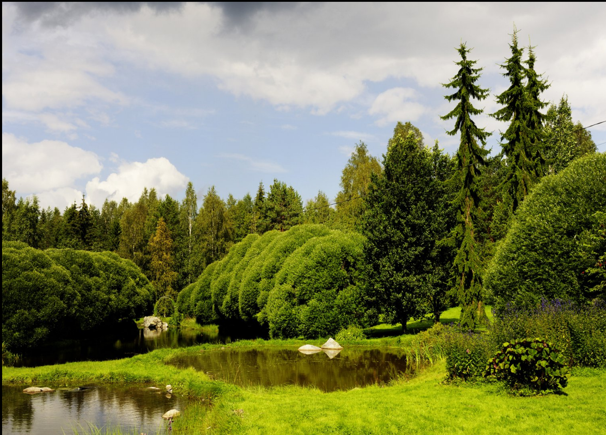
Lipunmyyjä, Anna Pääsymaksu-Garten Felsen, See und kugelig geschnittene Weiden