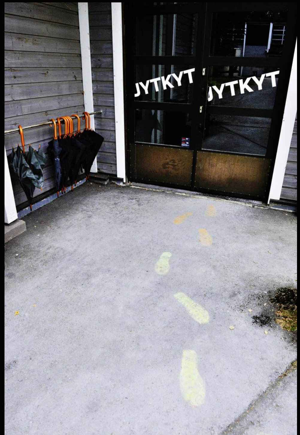
Regenschirme vor einer Ausstellungshalle im Retretti Museum