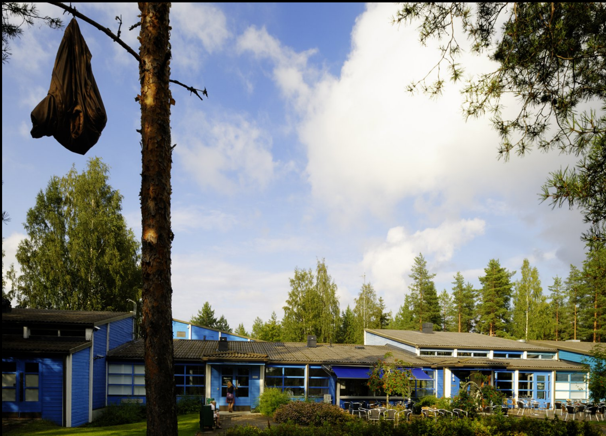
Kunstinstitution (Lederjacken hängen im Baum) im Retretti Musum