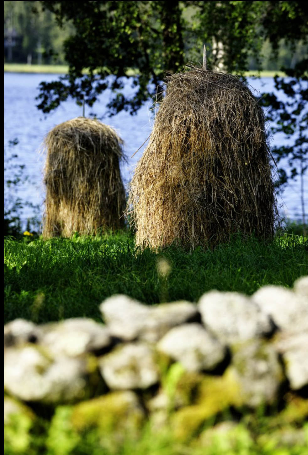
aufgeschichtetes Heu (Heumandeln) und Steinmauer