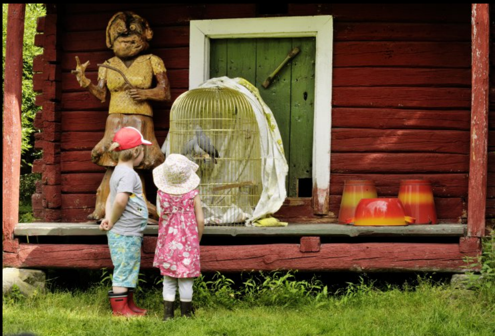
Kinder vor einem Bauernhaus mit Vogelkäfig