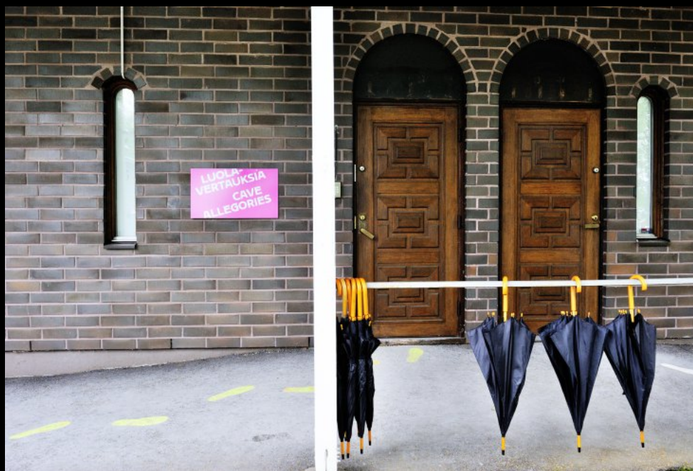
Regenschirme vor einer Ausstellungshalle im Retretti Museum