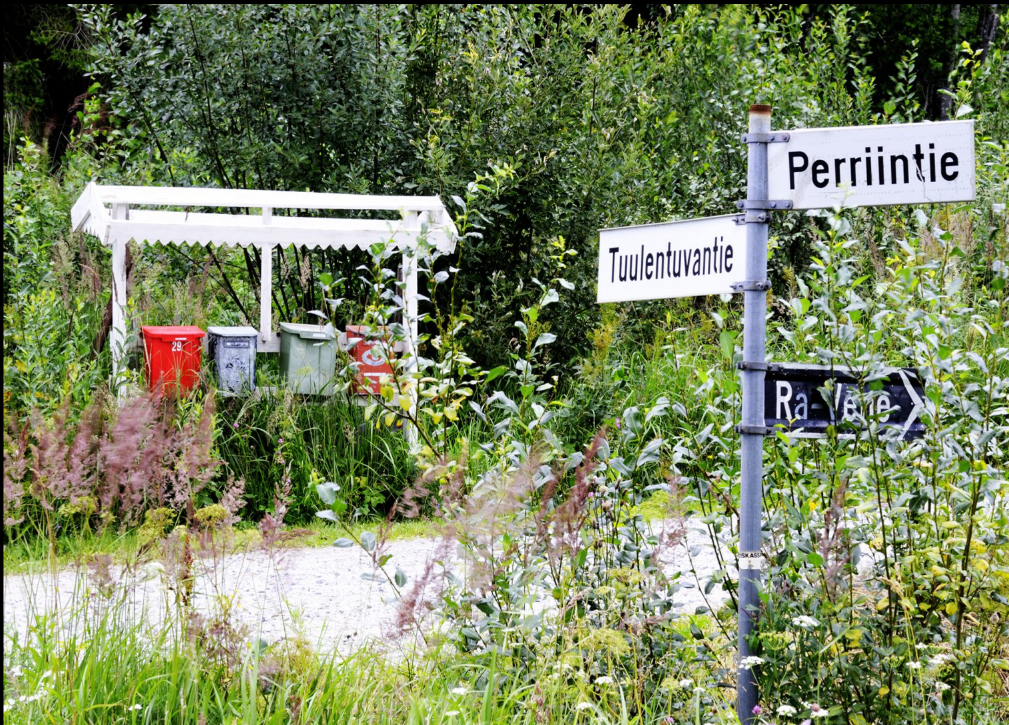
Briefkästen an einer Strassenkreuzung