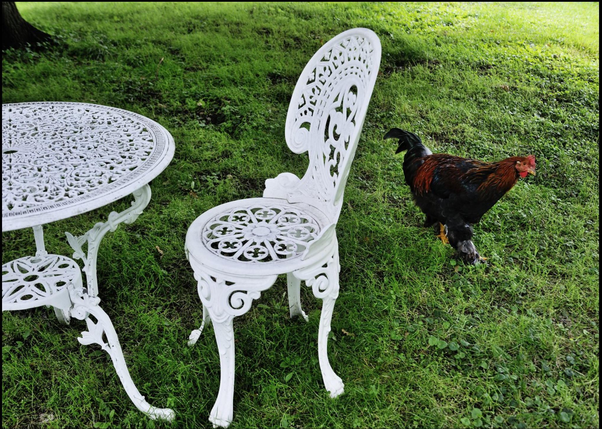
englische Gartenmöbel und frei laufendes Huhn