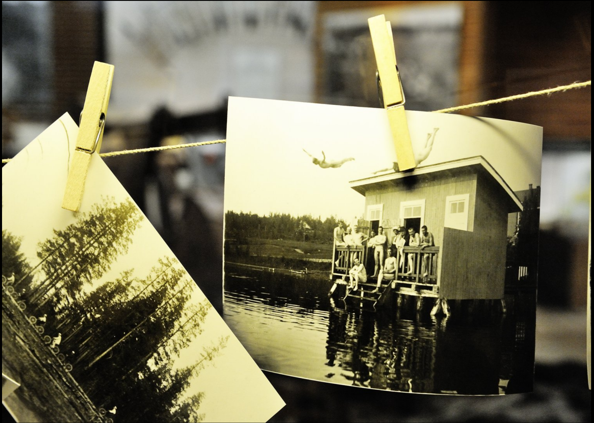
Saunahütte um 1920 im Finnischen Forstmuseum Lusto