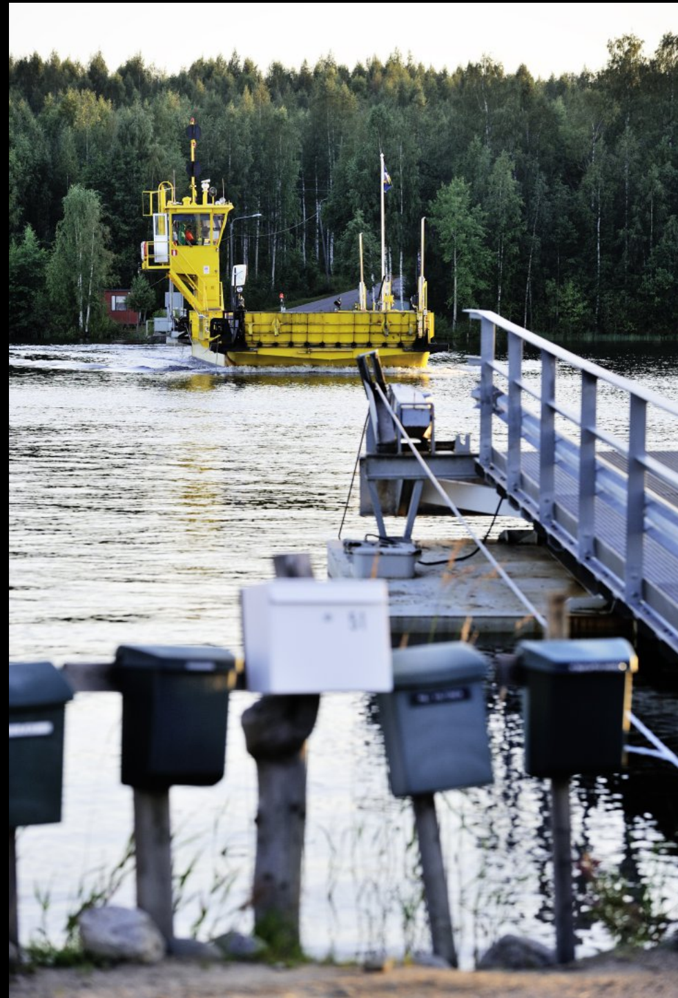
Schranke und Autofähre auf die Insel Inkeroinen