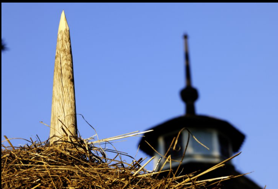
Savonlinna: Kirche Kirkkoniemen kellotapuli und Heumandel