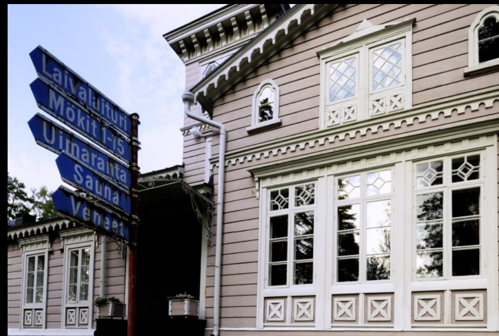
Mit finanzieller Unterstützung des russischen Zars Nikolai wurde Punkaharjun Valtionhotelli (Punkaharju State Hotel) 1845 gebaut.