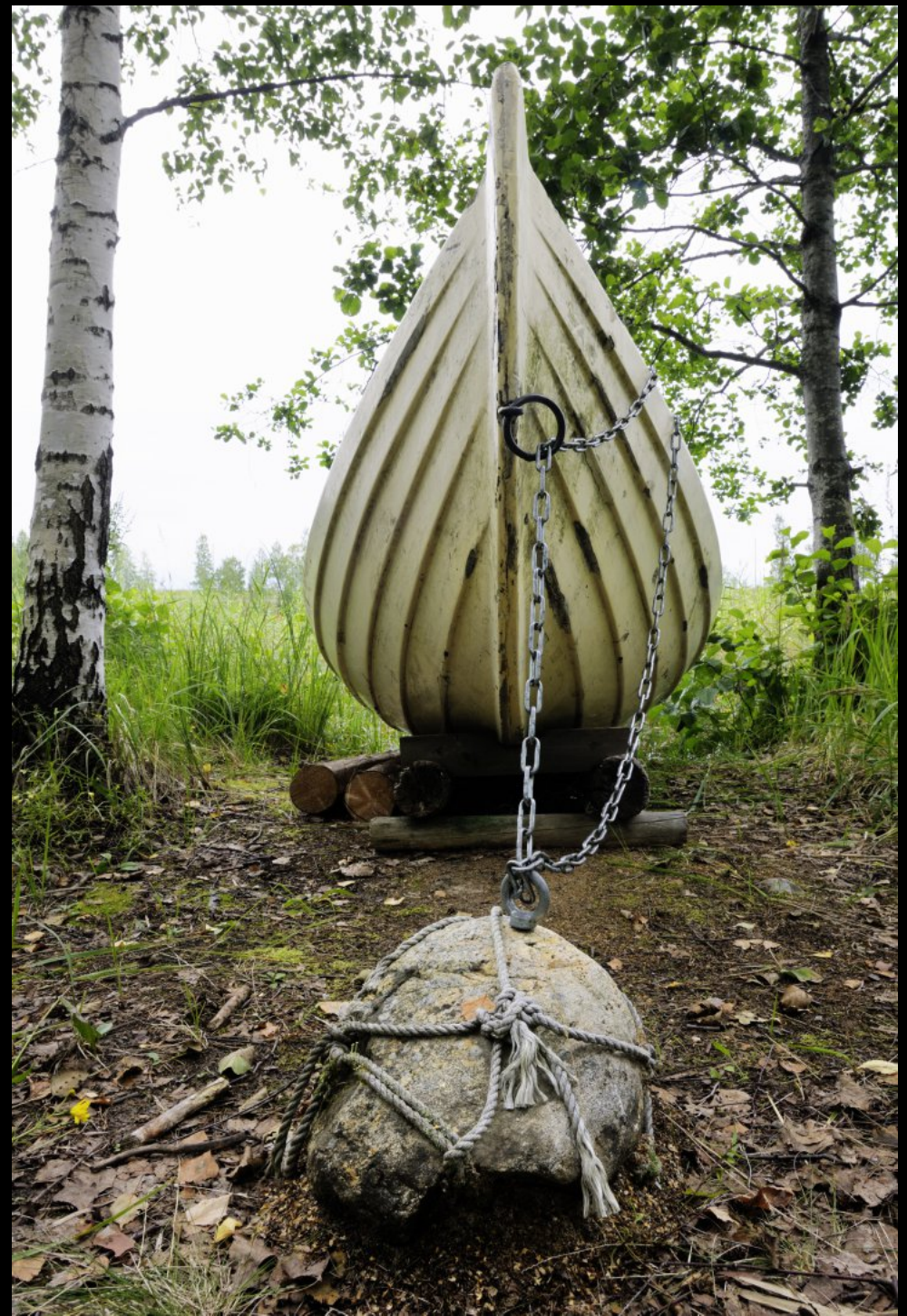
Ruderboot an einem Stein festgebunden