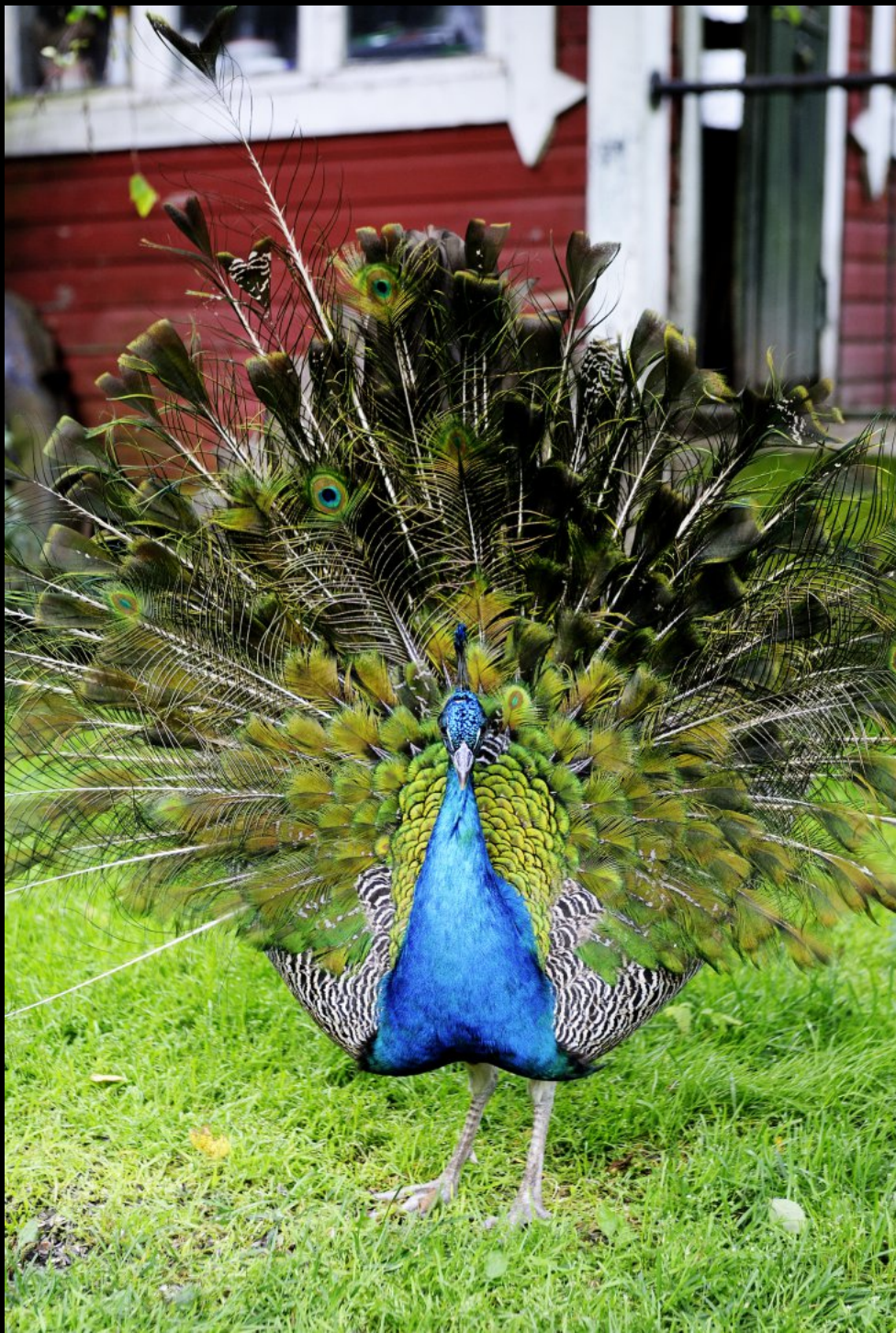
Pfau schlägt ein Rad und plustert sich