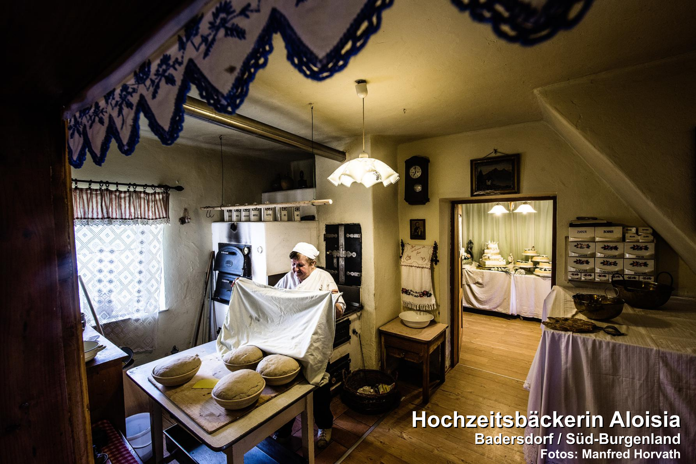
Hochzeitsbäckerin Aloisia Badersdorf / Süd-Burgenland