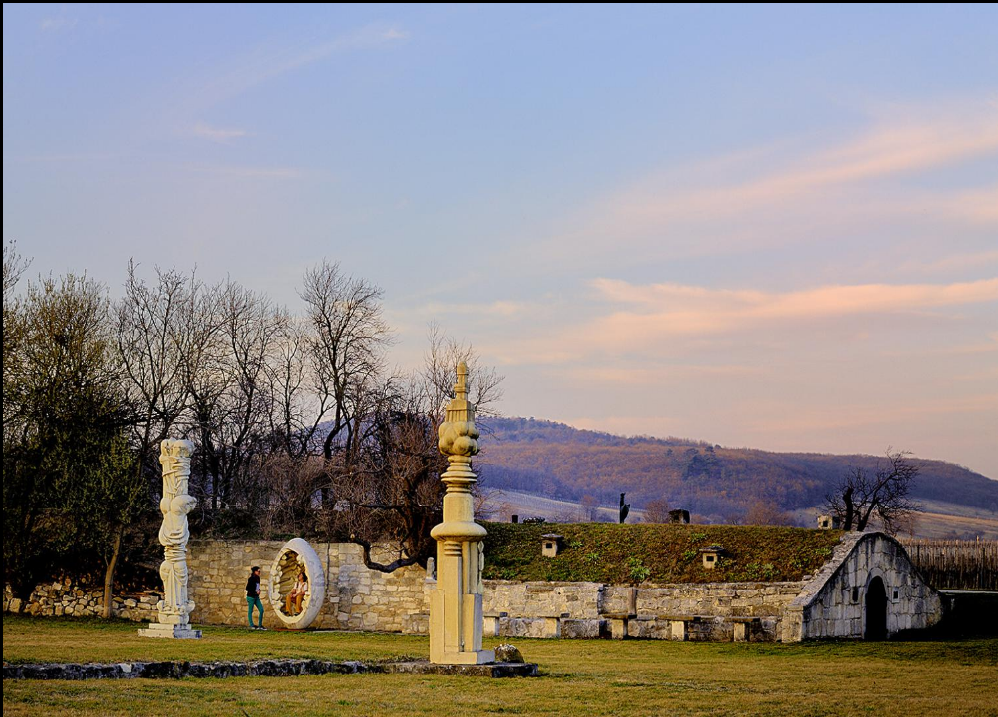
Skulpturengarten am Leithagebirge von Wander Bertoni