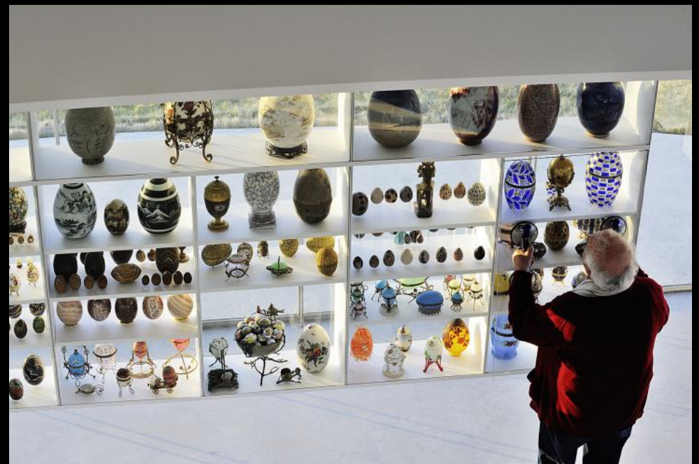
ägyptisches Ei im Eiermuseum Wander Bertoni