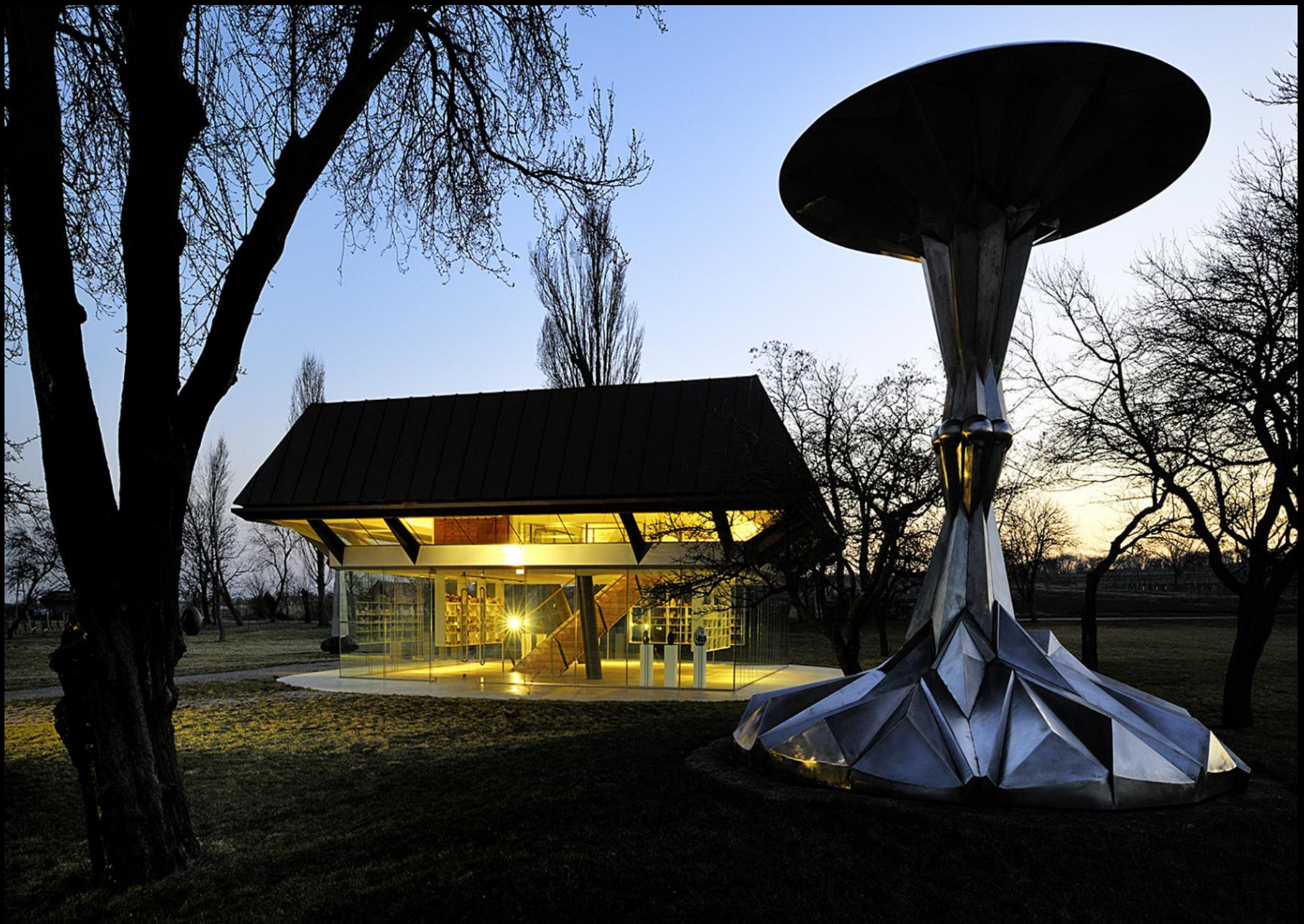
Eiermuseum und Skulptur von Wander Berti