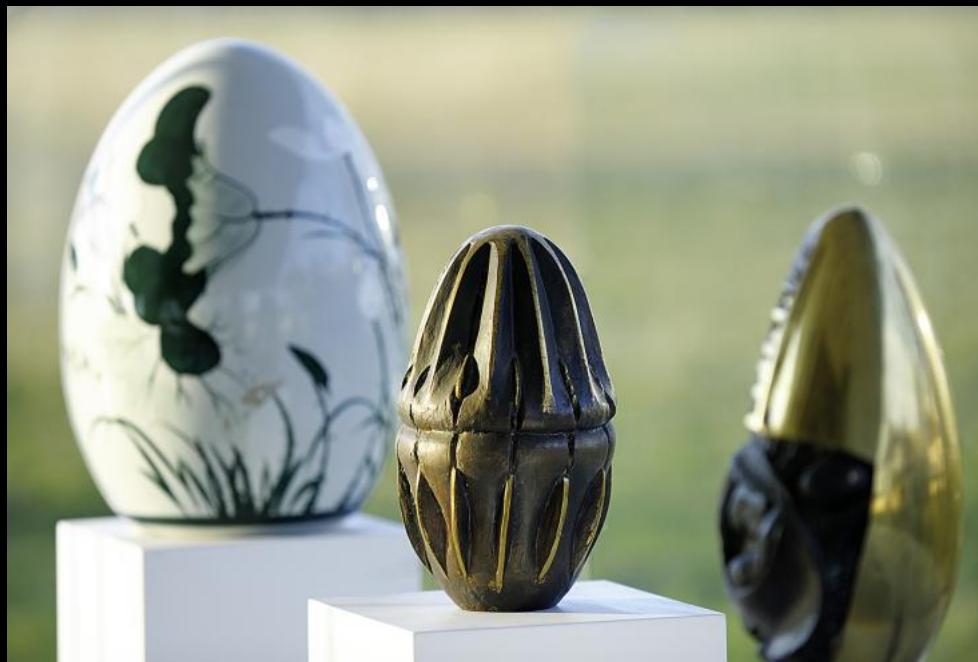
Eier im Eiermuseum Wander Bertoni