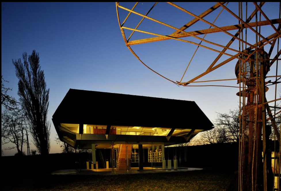
Eiermuseum und Skulpturen-Gerüst von Wander Bertoni