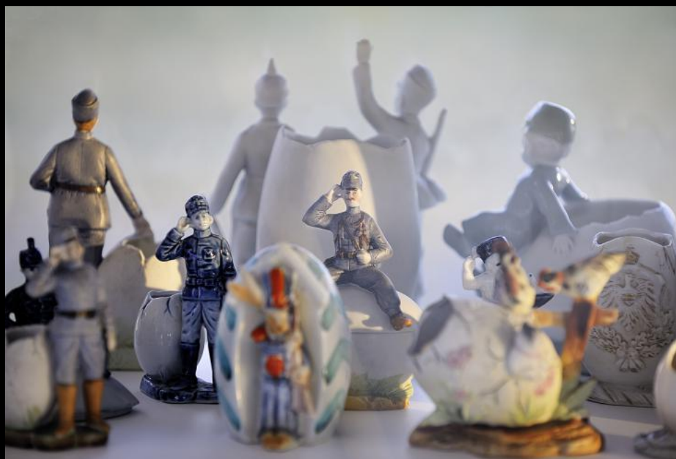
Soldaten-Eier im Eiermuseum Wander Bertoni