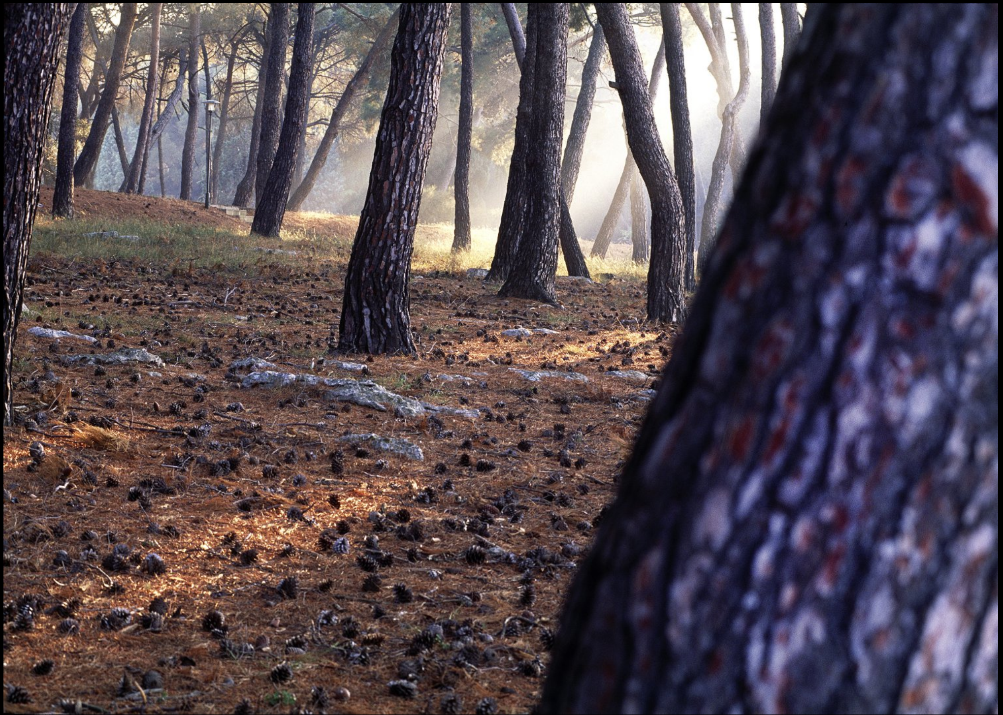
Schwarzföhren-Wald und Morgennebel