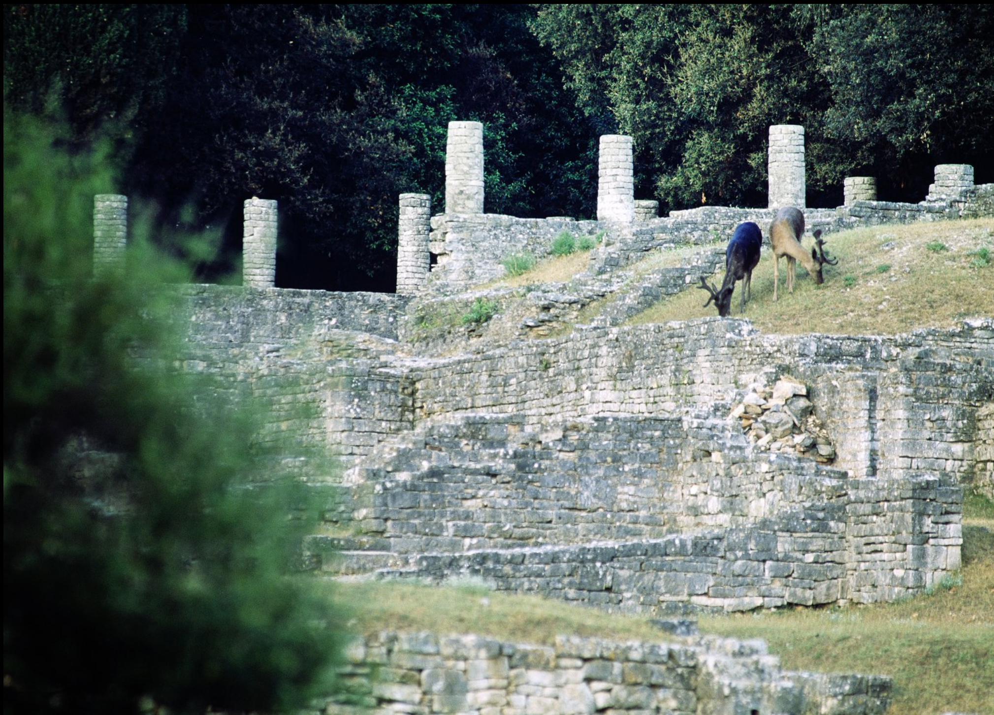
Ruinen aus der Römerzeit in der Verige Bucht und zwei Damhirsche