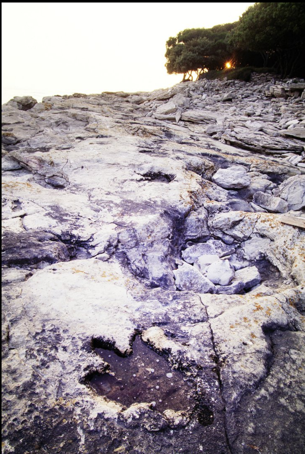
Dinosaurierspur am Cape Ploce aus der Kreidezeit (Mesozoikum, 145 bis 65 Millionen Jahre alt).