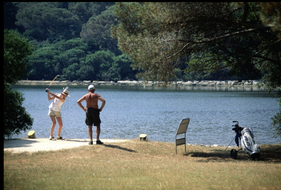
Der Golfplatz ist der älteste in Kontinentaleuropa