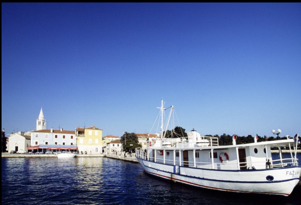
Der Hafen von Fazana an der Südwest-Küste von Istrien. Von hier legt die Fähre zur Insel Brioni ab. Fazana ist als Geburtsort von Pier Paolo Pasolini bekannt.