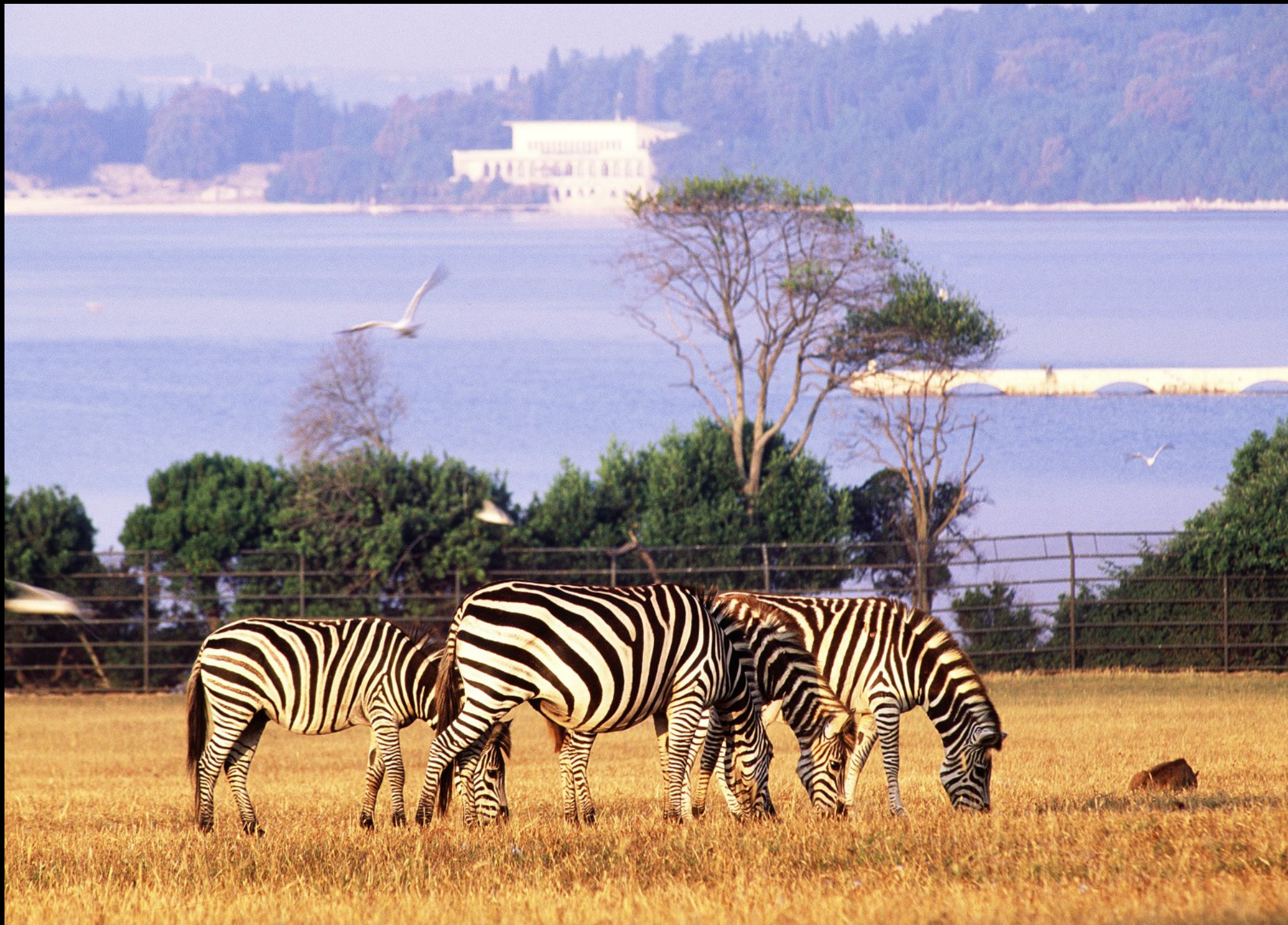
Zebras im Safari-park von Tito