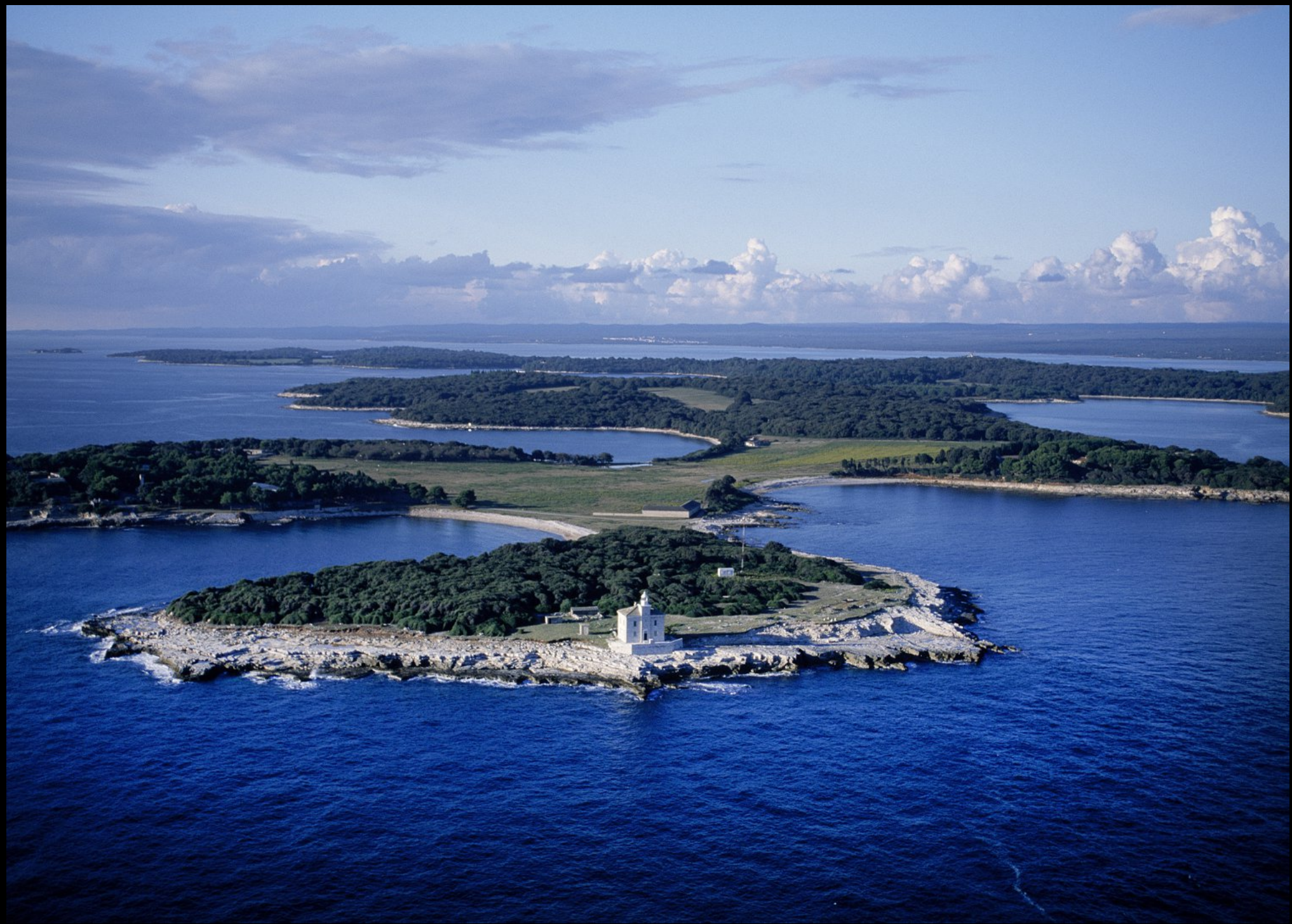
Brijuni-Inselgruppe mit Leuchtturm auf Veli Brijun