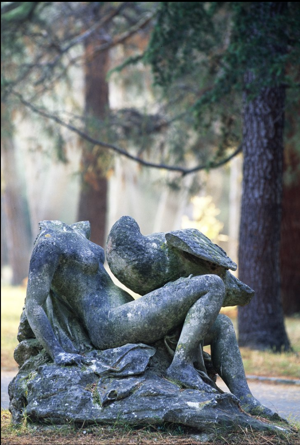
Skulptur beim Hotel Neptun