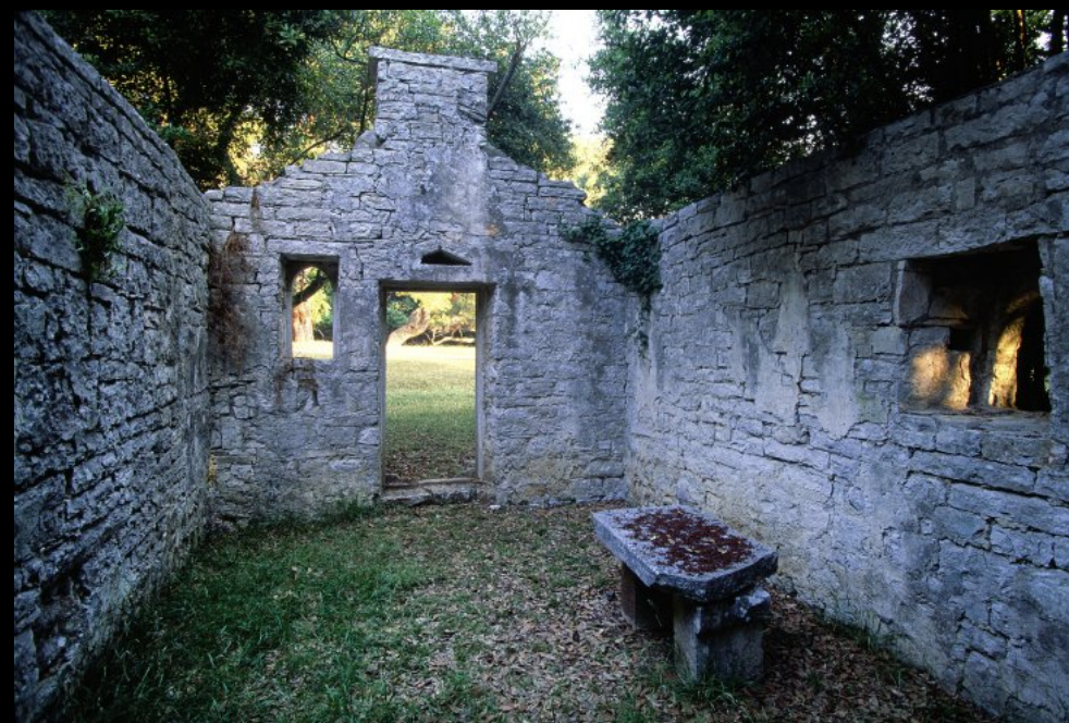
Kirchen-Ruine beim Hotel Neptun