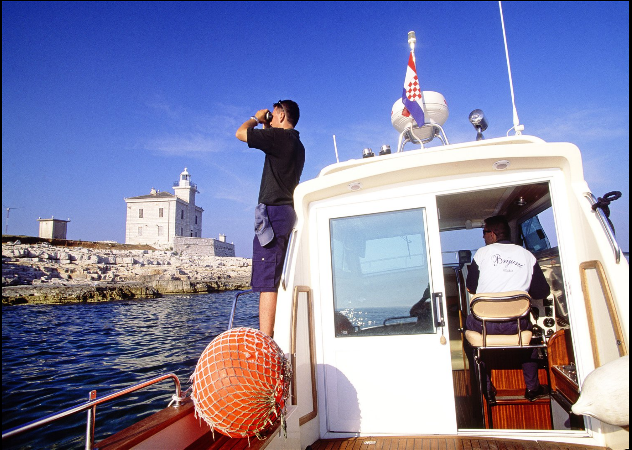
Küstenwache beim Leuchtturm