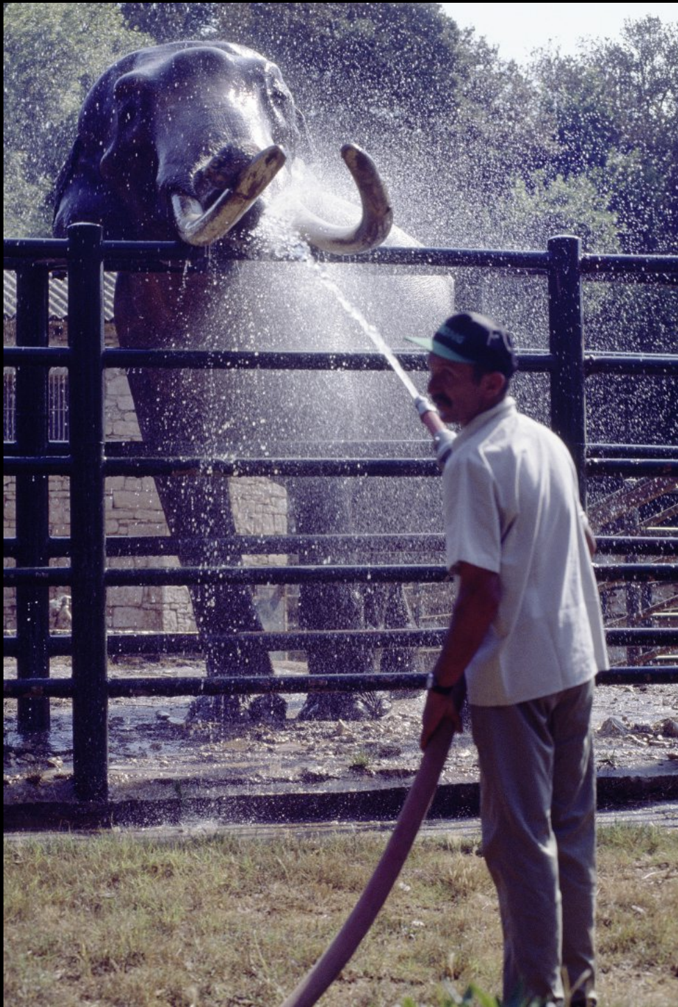
Abkühlen der Elefanten im Safaripark