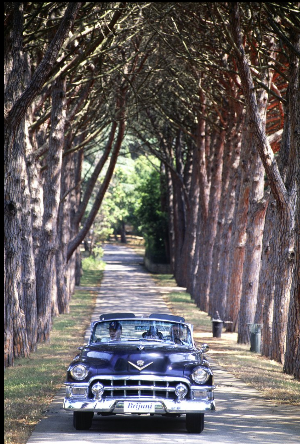
Der 50er-Jahre Chevrolet Titos (ein Gastgeschenk des US-Präsidenten Dwight Eisenhower) steht für Rundfahrten zur Verfügung.