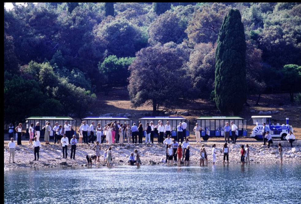
Bummelzug mit Fahrgästen am Strand