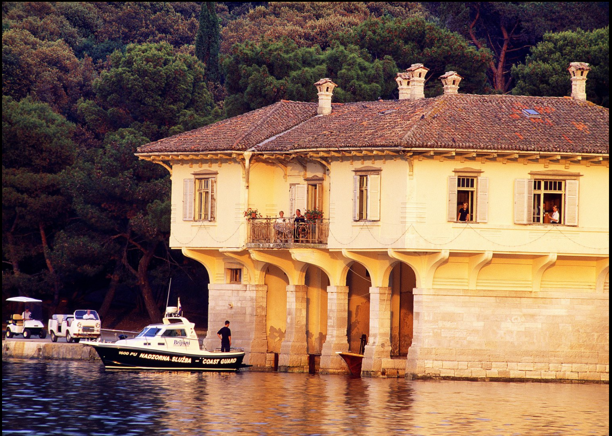
Bootshaus des Hotel Neptun