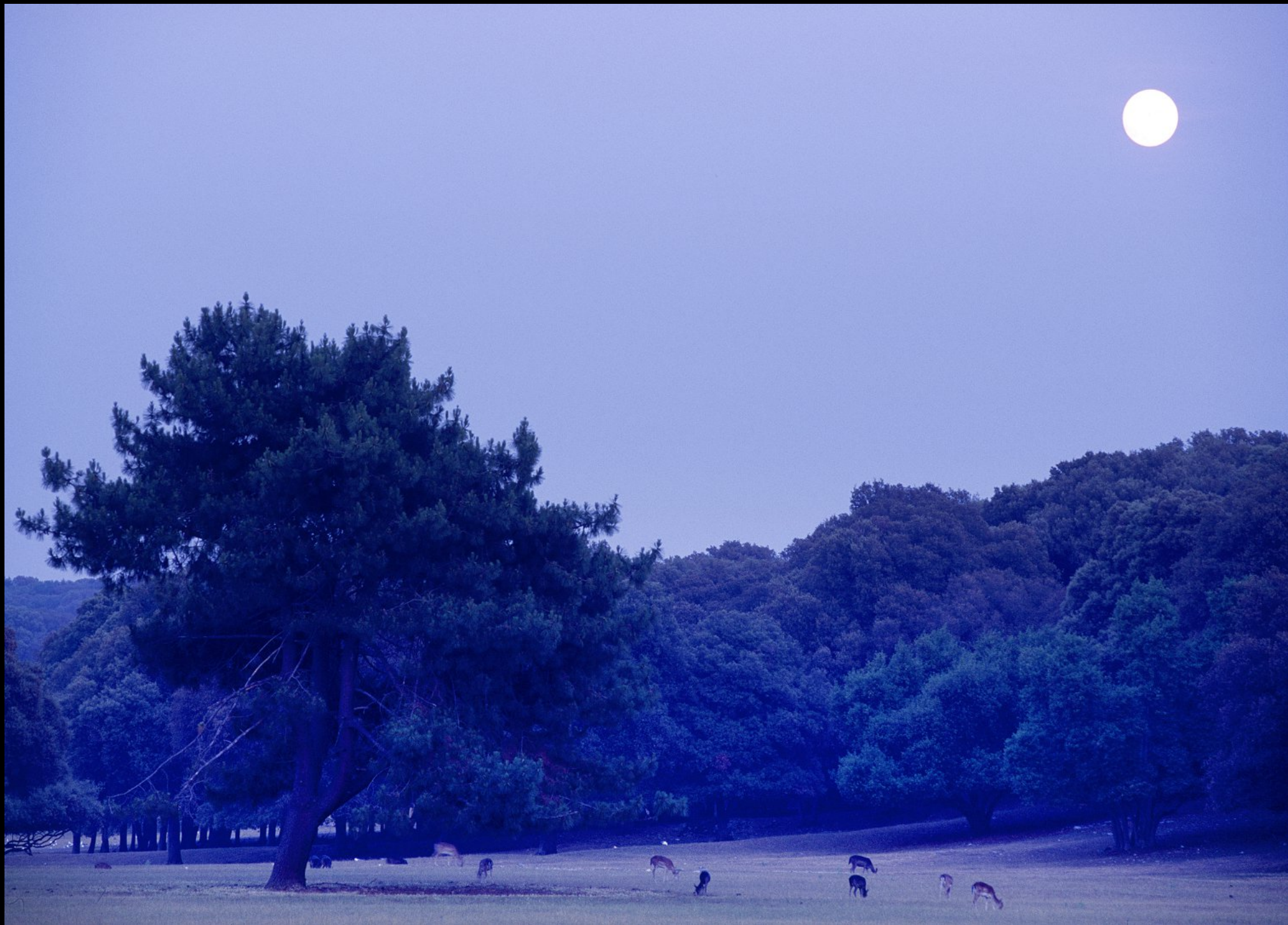
Steineiche und Damwild bei Vollmond-Licht